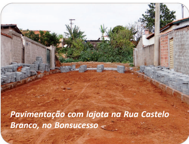
Pavimentação com lajota na Rua Castelo Branco, no Bonsucesso

ta (sentido Bairro Vera Cruz-Centro). A equipe de Praças e Jardins esteve na Praça Bertinho Rocha, no Bairro Colina Verde, executando os serviços de corte de grama.