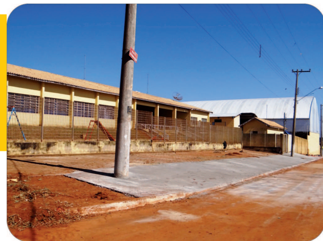
Calçada na Rua João Roberto Kernbeis, no Jardim Paraíso

Nos últimos dias, a prefeitura também está colocando redutores de velocidade em algumas ruas onde acidentes e colisões de trânsito são mais frequentes. Aprovada pelo Conselho Municipal de Trânsito, a medida foi implantada na Avenida Governador Mário Covas, em frente da unidade escolar do SESI, via onde veículos costumam imprimir velocidade além do permitido. Recentemente a equipe de calceteiros implantou os dispositivos na Rua Minas Gerais, próximo ao trecho onde os motoristas de fretes e mudanças ficam estacionados; na Avenida Espanha, nas proximidades da rotatória, pista direi-