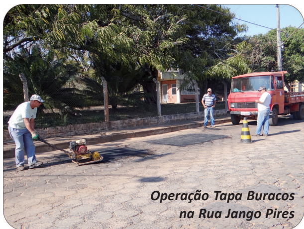
Operação Tapa Buracos na Rua Jango Pires