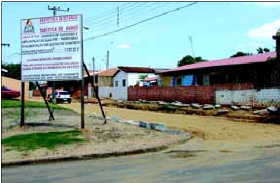
Pavimentação está sendo realizada em lajotas