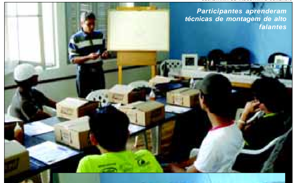
Curso proporciona o surgimento de novos profissionais na área

O principal objetivo é proporcionar a geração de emprego com a capacitação profissional e formação de mão de obra especializada. O curso foi realizado durante todo o dia e na conclusão os participantes receberam certificados.