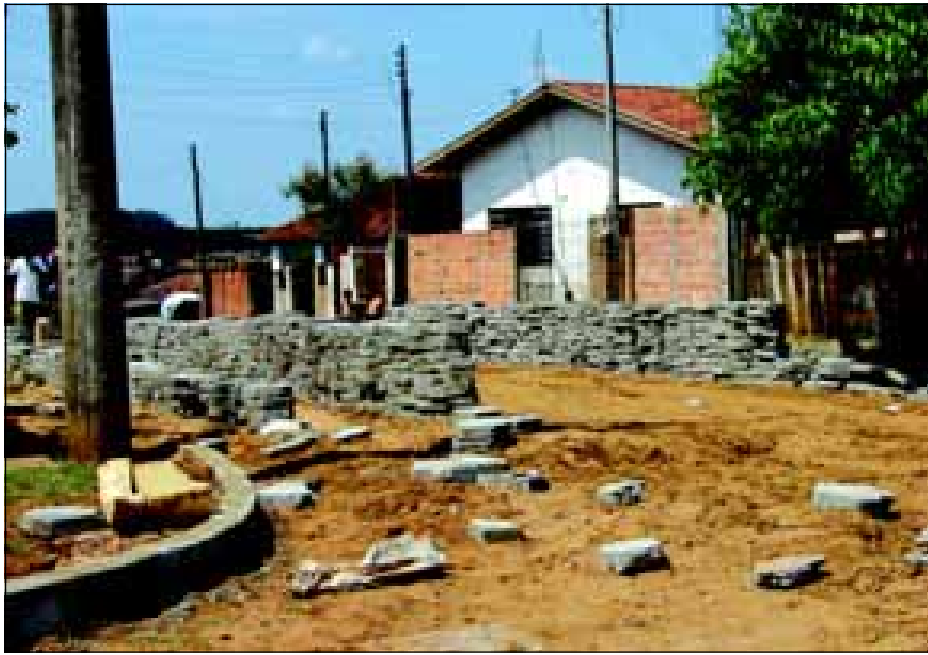
Obra é uma reivindicação antiga da população local