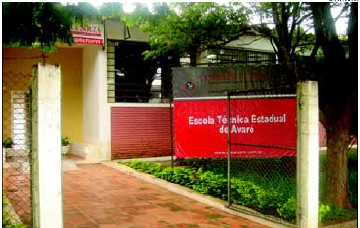
Caravana do Trabalho será realizada na sede da ETE

Em Avaré, a Caravana do Trabalho estará, no dia 13 de novembro, na sede da Escola Técnica Estadual (Rua Álvaro Lemmos Torres, 651 – Bairro Brabância).