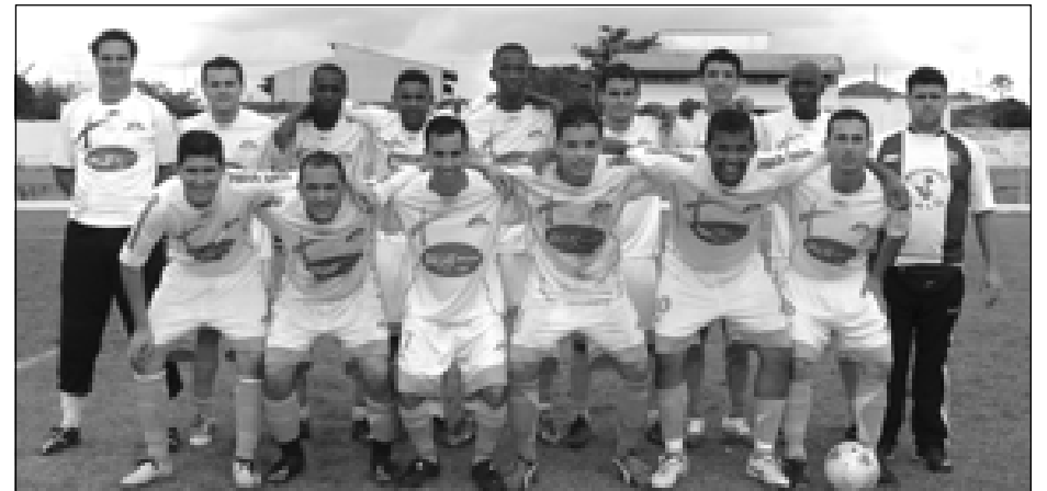
Equipe dos Cícero é uma das finalistas da Segunda Divisão

Retire gratuitamente o Semanário Oficial da Estância Turística de Avaré no Paço Municipal e nas Bancas de Jornais