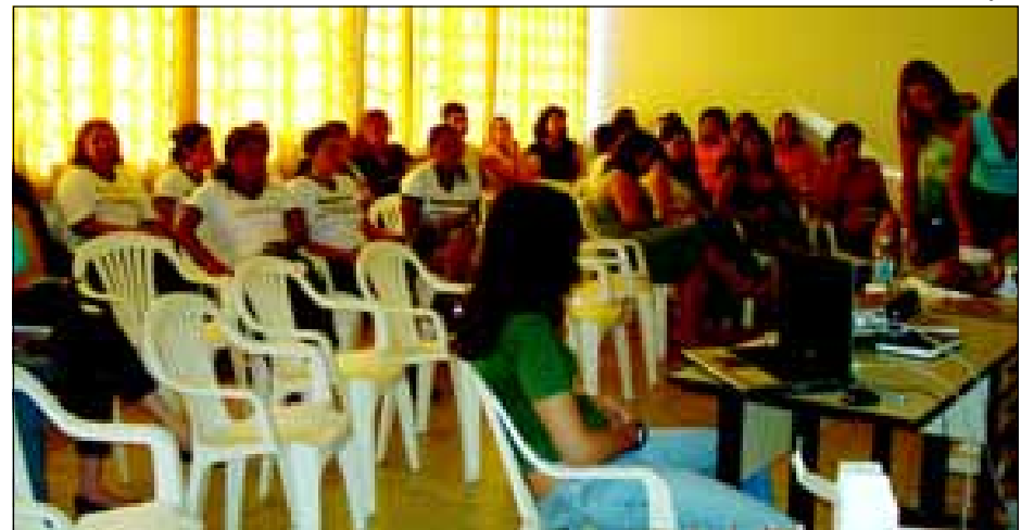
Curso foi dirigido a funcionários da educação e saúde

A Secretaria Municipal de Educação, preocupada com o bem estar dos alunos dentro das escolas e creches, promoveu no último sábado, dia 27 de outubro, o curso "Principais Acidentes no Ambiente Escolar e Seu Retorno".