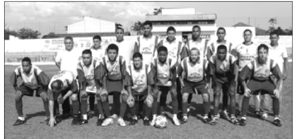
São Pedro está na final da Primeira Divisão