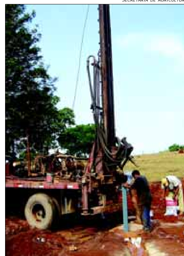
Equipamento realiza a perfuração: água com mais qualidade e quantidade para os agricultores da microbacia do Pinhal

A obra é de suma importância para os agricultores da região devido à escassez de