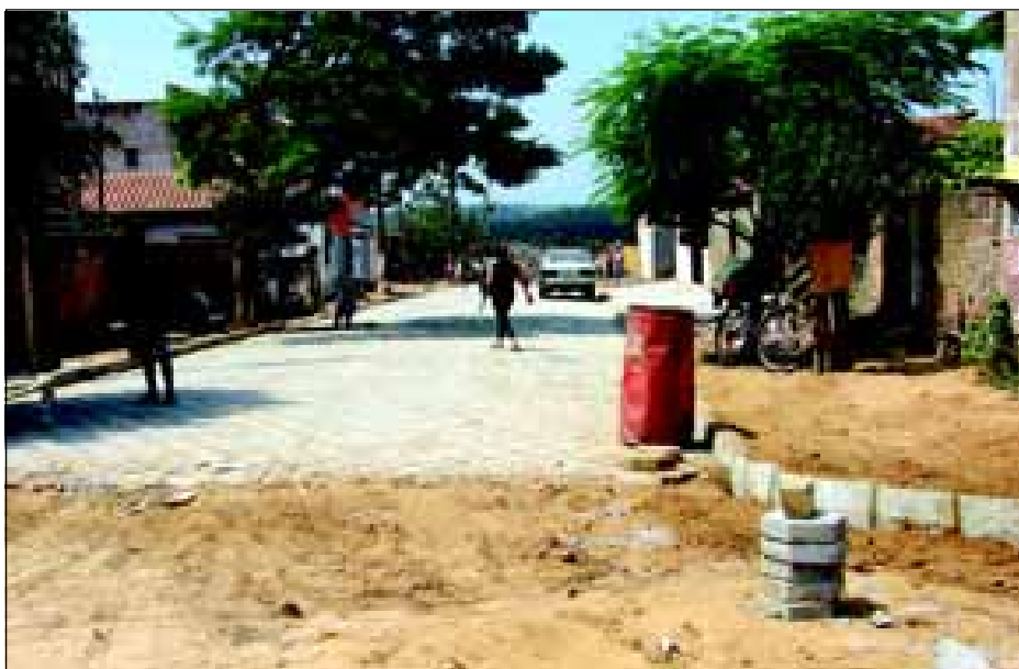
Ruas esperam pavimentação desde 1956

A Prefeitura da Estância Turística de Avaré está investindo na pavimentação do Bairro Jardim Bonsucesso II. O bairro foi implantado em 1956 e somente agora, depois de mais de 50 anos, recebe a pavimentação.