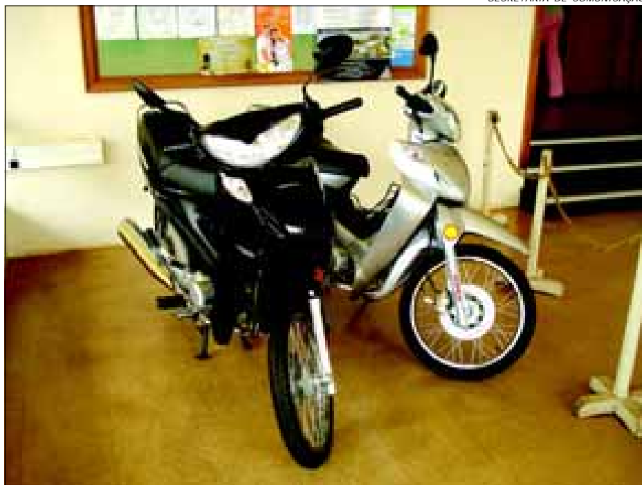
Motos serão sorteadas na festa de confraternização dos funcionários, dia 21 de dezembro