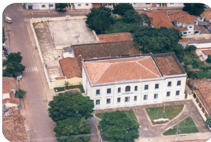
Vista aérea da área remodelada, 1987.