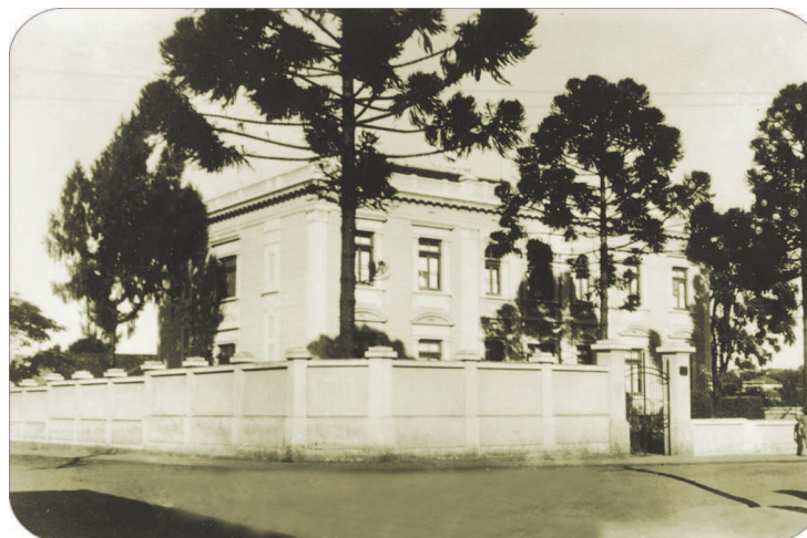
A escola murada nos anos 1940.