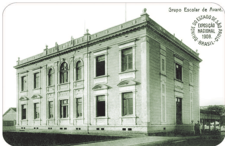
Grupo Escolar recém-inaugurado, 1908.

tado de São Paulo, estendendo teoricamente a proteção ao seu entorno.