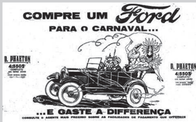
Publicidade da época