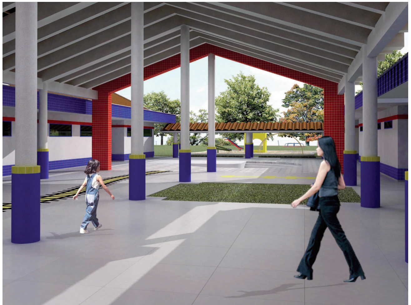
Maquete eletrônica do pátio coberto da nova creche

A Secretaria Municipal de Educação, após a conclusão de todas essas obras, criará 701 novas vagas para as crianças do município, fato que, com a construção de mais duas creches, irá sanar de uma vez por todas a questão da falta de vagas em na cidade.