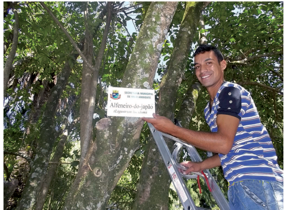
Funcionário da Secretaria do Meio Ambiente identificando uma das árvores do Largo São João

Como parte do projeto, na última terça-feira foram plantadas mudas de ipês (árvore escolhida como símbolo do Sesquicentenário) em frente à Câmara Municipal. Essa iniciativa da Prefeitura trará grandes benefícios para a cidade uma vez que a arborização urbana contribui para diminuição da poluição sonora, absorção de parte dos raios solares, proteção contra ventos, sombreamento, paisagismo e resgate da fauna silvestre.