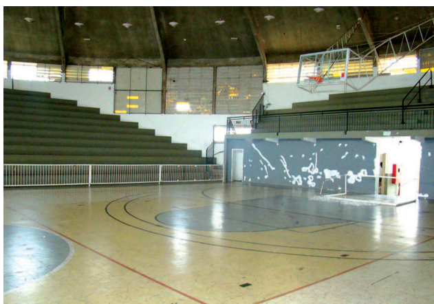
Reformas começaram pelo Ginásio de Esportes Kim Negrão