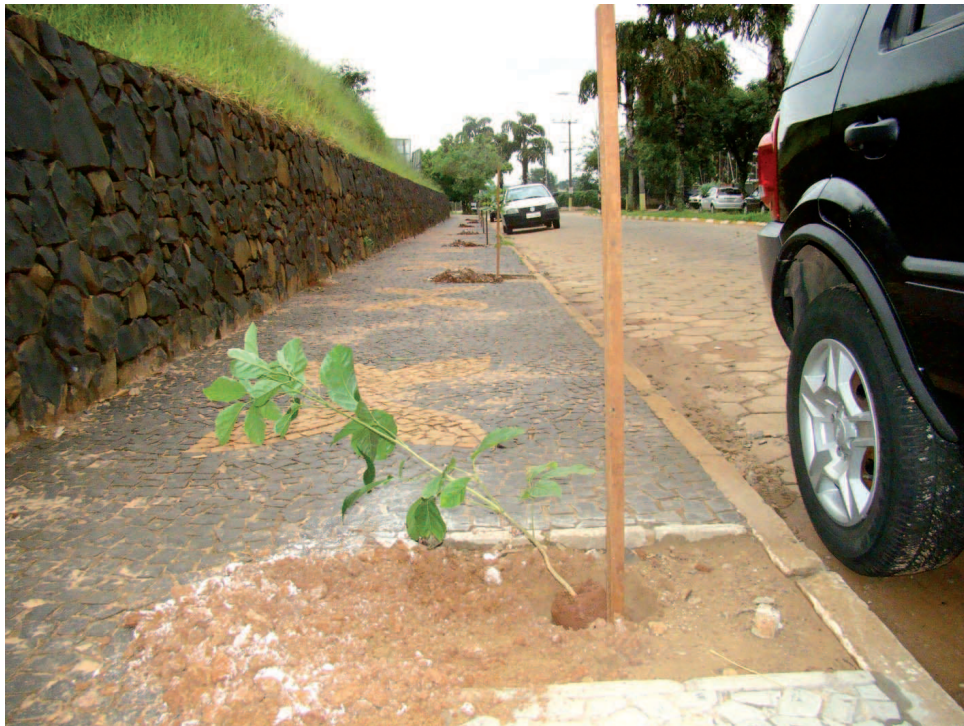
Mudas de ipês plantadas ao longo da calçada defronte ao prédio da Câmara