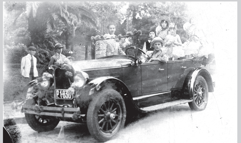
Curso carnavalesco: foliões desfilavam fantasiados em seus carros pelas ruas centrais

“Vale destacar – relatou Chico de Almeida na mesma ocasião - ainda dois lindos carros enfeitados: um