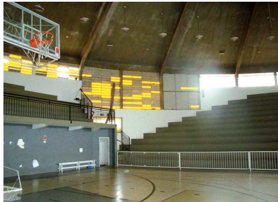
Reformas no Ginásio de Esportes Kim Negrão já começaram

Na manhã da última terça-feira, 14, a Prefeitura da Estância Turística de Avaré deu início às obras no Ginásio de Esportes Kim Negrão e em mais 11 praças esportivas da cidade, necessárias para a realização dos Jogos Regionais 2012.