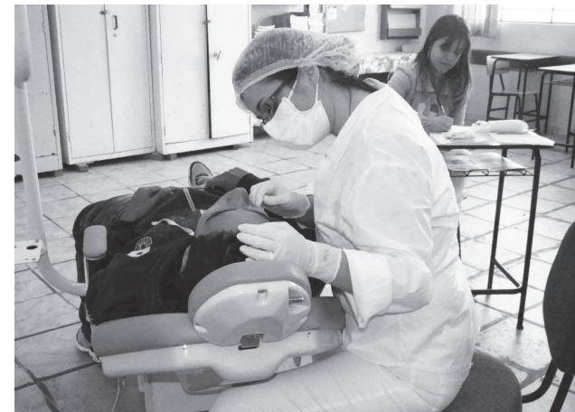
Serviço odontológico, tratando da saúde bucal da população

O projeto é um grande facilitador, por permitir à população, a quebra de barreiras burocráticas e o intercâmbio com todos os setores da administração pública, levando reivindicações e anseios da população de forma direta, inclusive a qual-