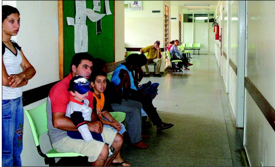
Atendimento no Pronto Socorro tem melhorado muito

Hoje a situação é outra. Além destes materiais essenciais não faltarem, a Prefeitura in-