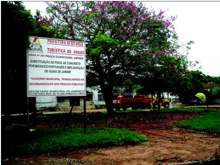
Praça contará com calçada em mosaico português

A Prefeitura da Estância Turística de Avaré está realizando o trabalho de reurbanização da Praça Guaraciba Amorim, antiga Praça Engenheiro Miller, de frente a antiga estação ferroviária. A praça ficou conhecida pela antiga paineira