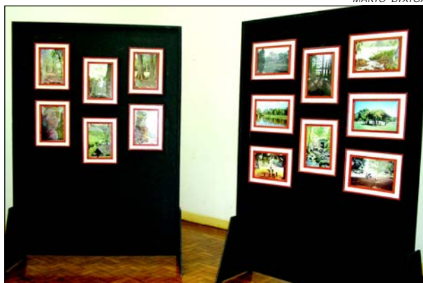
Fotos de diversos autores retratam o Horto Florestal

cipal está localizada no Centro Cultural "Djanira da Motta e Silva" e atende de 2ª a 6ª feira