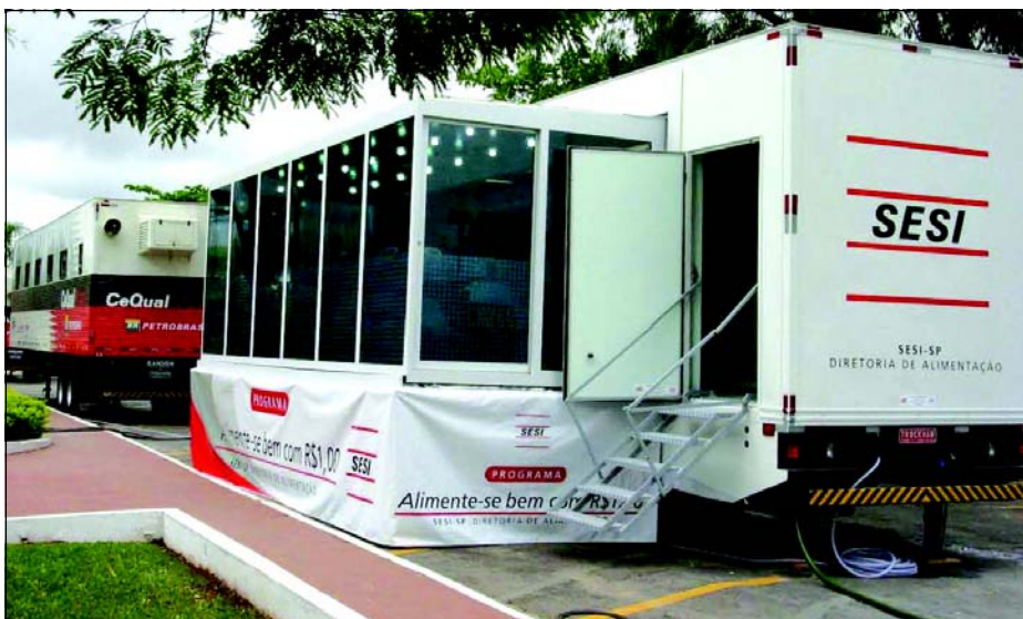
Inscrições vão de 22 a 26 de janeiro

Idealizado pelo SESI-SP o Programa Alimente-se Bem chega a Avaré. Trata-se de um programa educativo que incentiva a mudança de hábitos alimentares para a população. As aulas práticas ensinam recei-