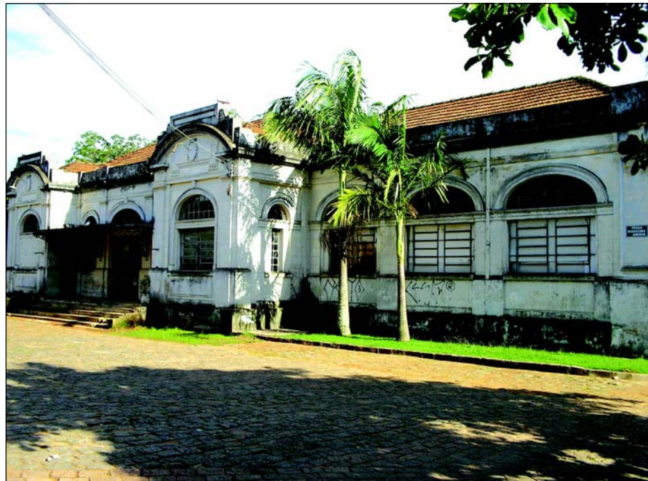
Prefeitura decretou como de utilidade pública toda a área envolvendo a antiga estação

um complexo de residências e prédios pertencentes a Rede Ferroviária Federal. Preocupada com a preservação da Região, a Prefeitura decretou toda a área como de utilidade pública. Desta forma a Prefeitura pretende futuramente des-