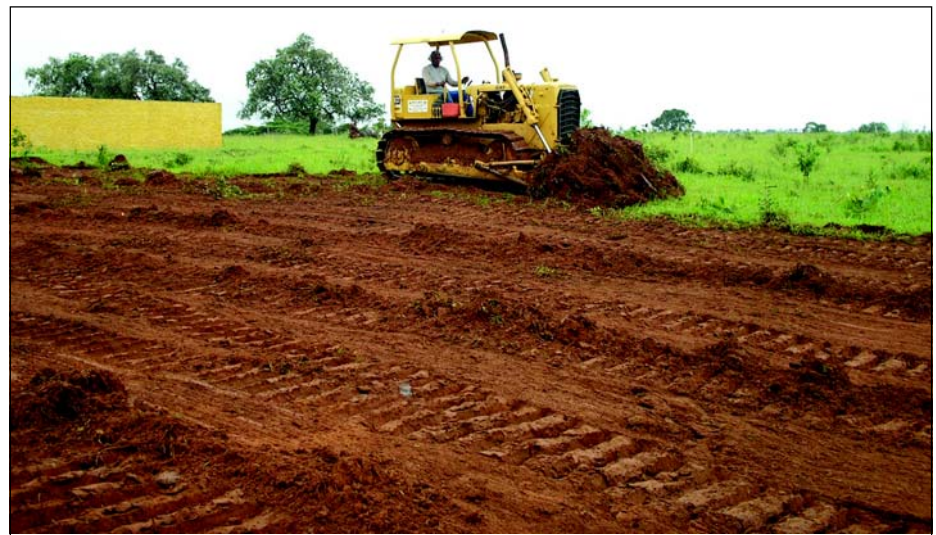
Local está recebendo terraplanagem

A Prefeitura da Estância Turística de Avaré iniciou a construção de uma escola de ensino fundamental no povoado de Barra Grande. Inicialmente está sendo realizado o trabalho de terraplanagem do terreno.