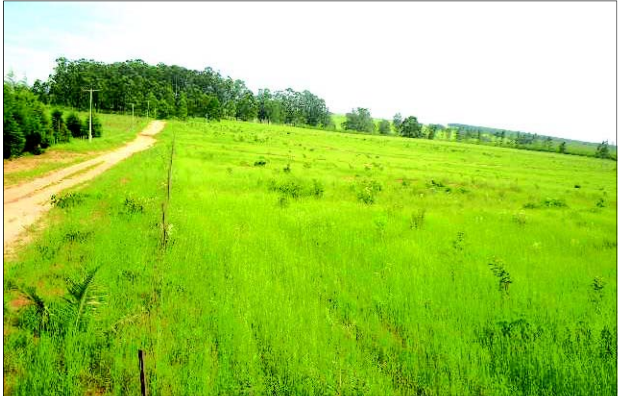
Local onde será implantado o novo Distrito Industrial

A abertura de um segundo Distrito Industrial em Avaré já se fazia necessária, pois o primeiro Distrito Industrial, inaugurado em 1998, já está praticamente saturado. Algumas áreas que ainda restam estão necessitando de revogações e por isso fica impossibilitada a doação por parte da Prefeitura para novas empresas que mostrem interesse de se instalar em Avaré. Desta forma a Prefeitura se viu obrigada a abrir novas áreas para que possa atender a todos.