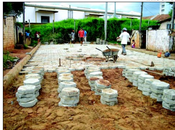
A Travessa está recebendo pavimentação em lajota

A Prefeitura da Estância Turística de Avaré está investindo na pavimentação da Travessa Cambará, no Parque Jurumirim. A via está recebendo pavimentação em lajota, em toda sua ex-