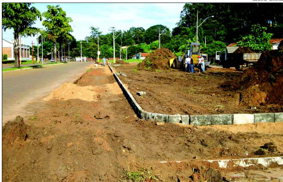
A Praça foi criada oficialmente em 1998 e agora recebe a urbanização por parte da Prefeitura