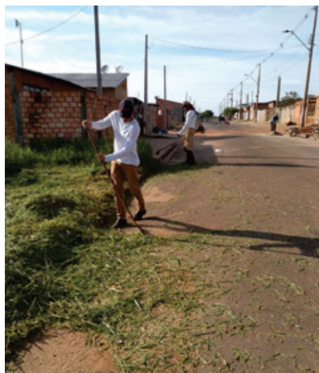
Capina no Jardim Paraíso