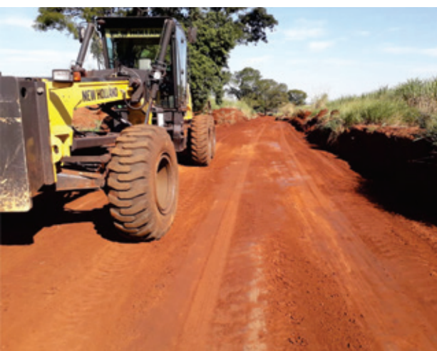
Manutenção das estradas rurais

Recolhimento de entulho e reparação de vias foram algumas das melhorias implementadas pela Secretaria de Serviços