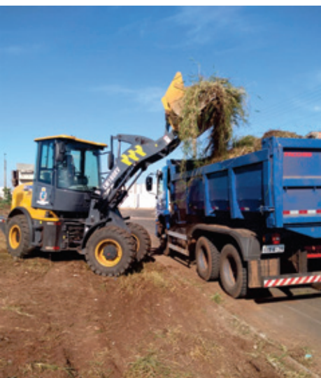
Manutenção no Bairro Camargo

Estradas municipais que dão acesso à zona rural foram adequadas com a ajuda do maquinário pesado. Recentemente, a Prefeitura já havia concluído a construção da ponte de madeira na região do loteamento conhecido como Golf.