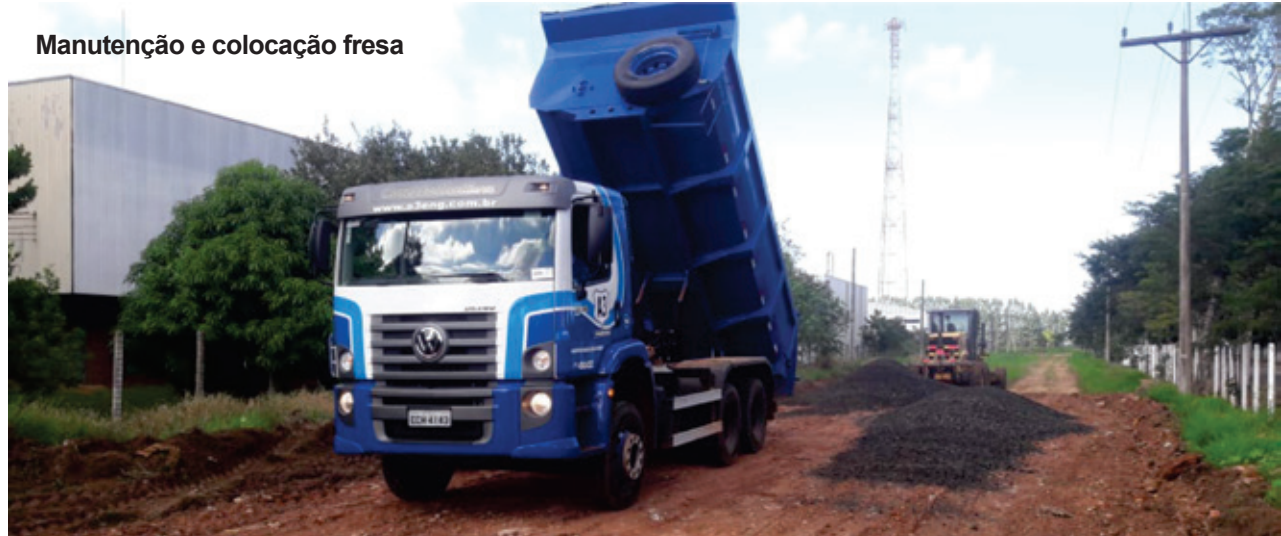
Manutenção e colocação fresa

Os serviços incluíram a substituição de lajotas na Avenida Paranapanema e na Rua Anacleto Pires, a limpeza no canteiro central da Avenida Major Rangel e a poda em árvores nos arredores da Fundação Regional Educacional de Avaré (Frea). Praças