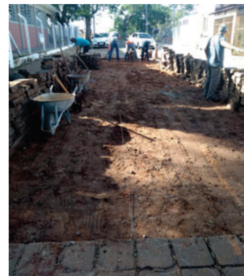
Substituição de lajotas