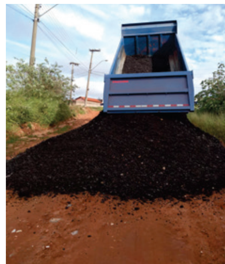
Colocação de fresa