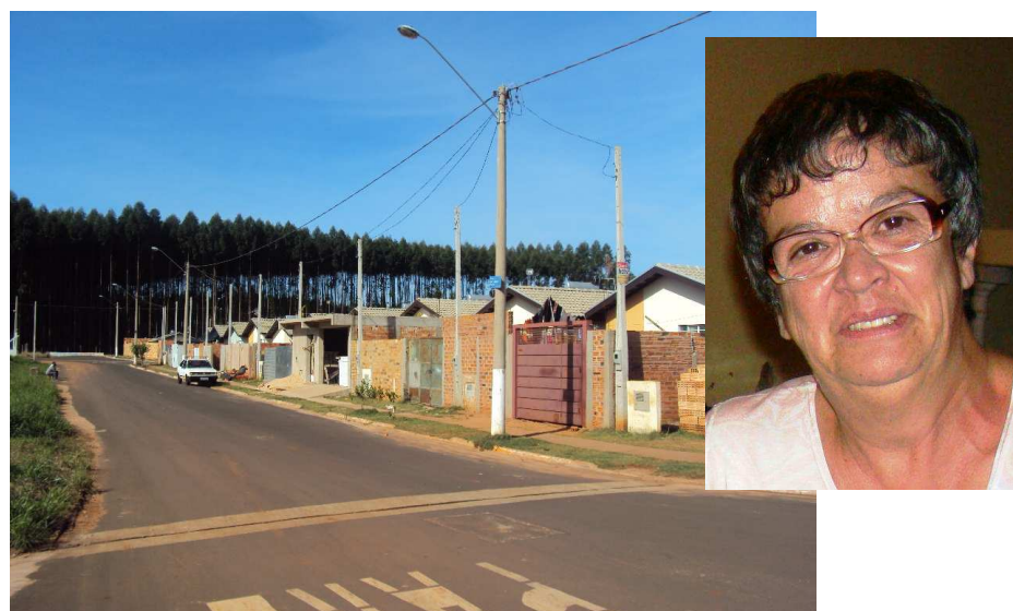
Rua Ana Virgínia Duarte