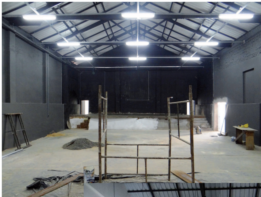
Futuro auditório Elias de Almeida Ward

Marcado para XX de julho, o primeiro evento a ser realizado no Centro Cultural será o Festival de Música Instrumental (Fesmia). O palco do novo local também receberá o Festival de Choro e o Festival Estadual de Teatro (Feseste).