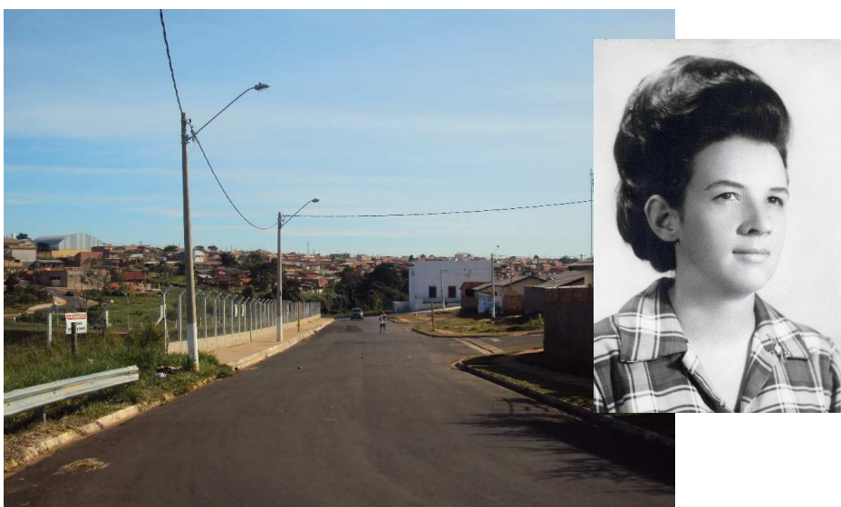
RUA APARECIDA DOS SANTOS JABALI