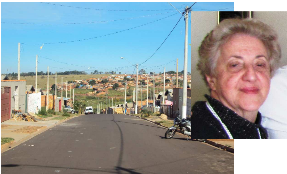
Av. Muntaha B. Urrêa Lopes