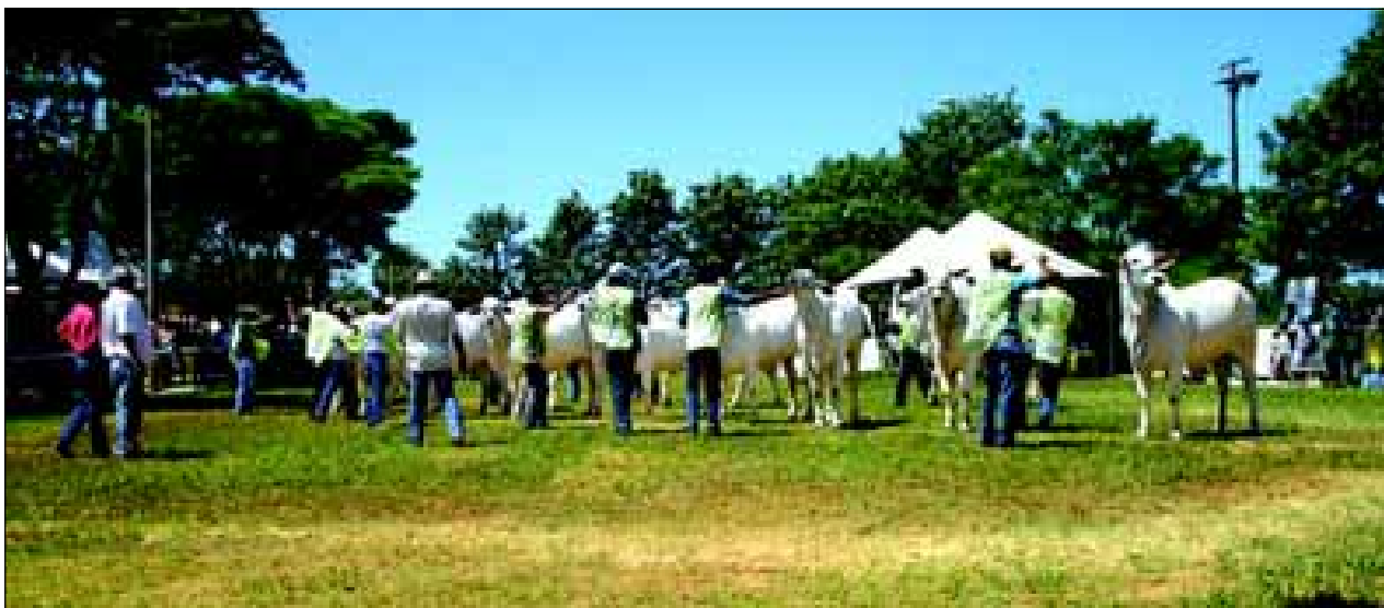
Expectativa é atingir quase 3 mil animais inscritos