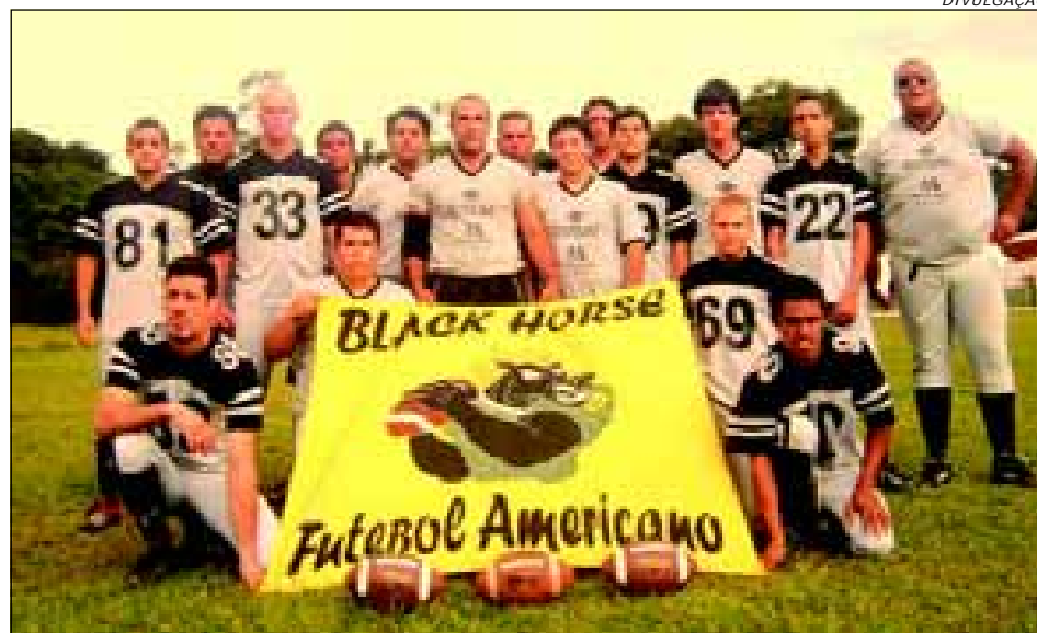
Avaré Black Horse treina no campo da Ferroviária

O Avaré Black Horse, time de Futebol Americano, está treinando em sua pré-temporada para disputar a segunda divisão do Campeonato Paulista. O certame é mais conhecido como Torneio de Integração (TI), e começará no domingo, dia 10 de fevereiro. O Black Horse fará o seu primeiro jogo contra o Brasilândia Dragons, time já tradicional em São Paulo. Os dois times se enfrentaram no ano passado e na oportu-