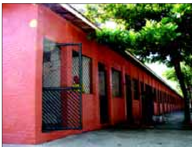
Baias recebem nova pintura

Para abrigar essa imensa quantidade de animais estão sendo