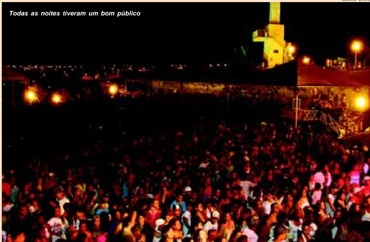
Todas as noites tiveram um bom público