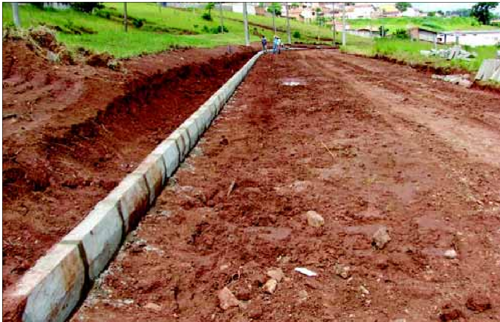
Prefeitura está implantando guias

A obra é uma reivindicação antiga da população e irá beneficiar um grande número de pessoas que trafegam pelo local.