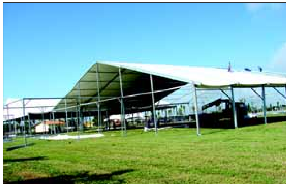
Pavilhões provisórios acomodarão as animais dos leilões

Com as proximidades da realização da 43ª Emapa, o Parque de Exposições Fernando Cruz Pimentel está recebendo benfeitorias por parte da Prefeitura. Os trabalhos estão sendo realizados em parceria com o Núcleo Nelore e visa melhorar as estruturas do