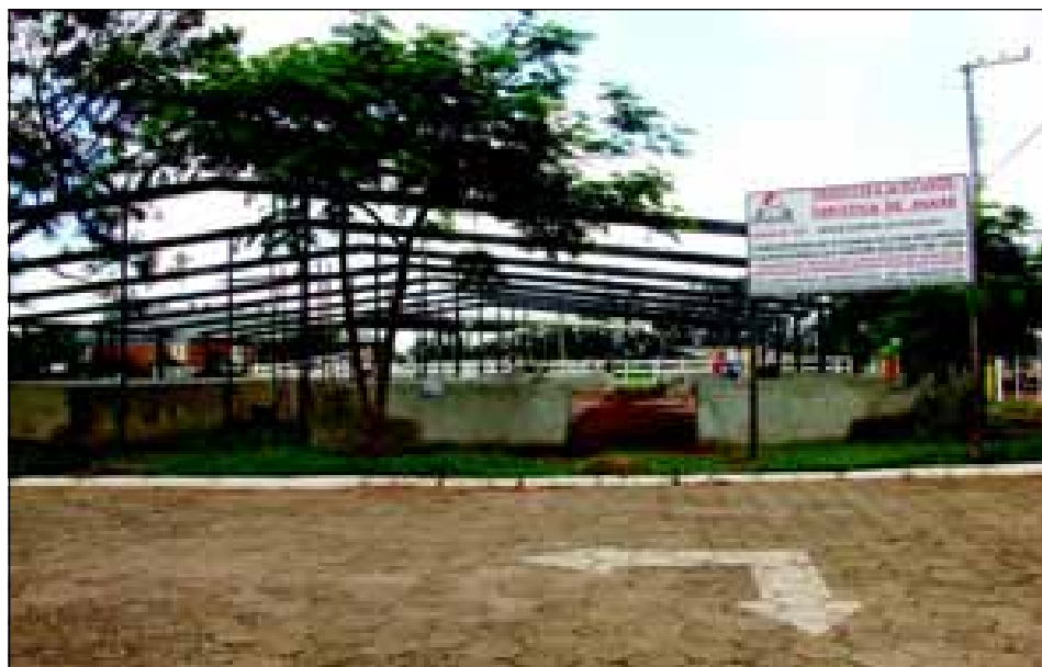
Mais quatro galpões estão sendo construídos