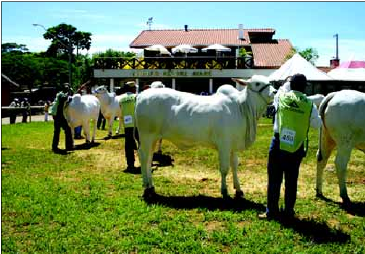
Os julgamentos da raça nelore acontecem de 20 a 24 de fevereiro

A 43ª Emapa também contará com grandes leilões, das raças Nelore, Brahman, Santa Gertrudes e Simental. Serão 4 remates de Nelore, dois de Brahman e um de Santa Gertrudes e Simental.