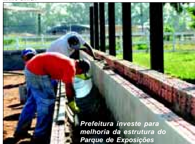
Prefeitura investe para melhoria da estrutura do Parque de Exposições