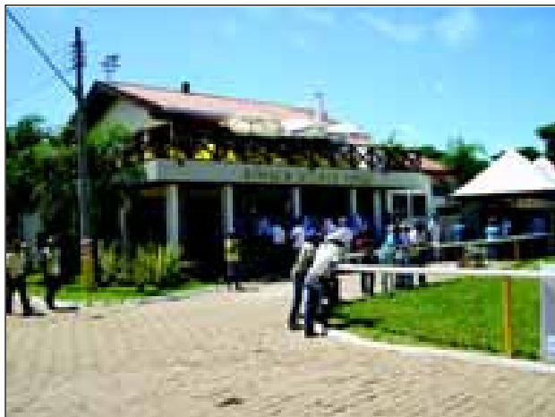
Nuclio Nelore de Avaré

A 43ª Emapa (Exposição Municipal Agropecuária de Avaré) começa no próximo dia 18 de fevereiro e vai até o dia 2 de março. O evento acontece no Parque de Exposições Fernando Cruz Pimentel.