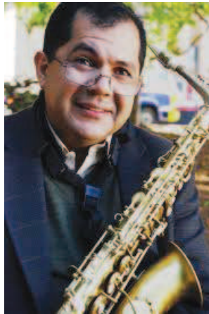
Nailor Proveta e Regional Imperial fecharam com chave de ouro o II Festival de Choro de Avaré

Na noite de encerramento, no dia 08, o clarinetista e saxofonista Nailor Azevedo “Proveta” apresentou-se ao lado do Regional Imperial. Proveta ocupa lugar de destaque na galeria dos principais músicos do Brasil. Já to-