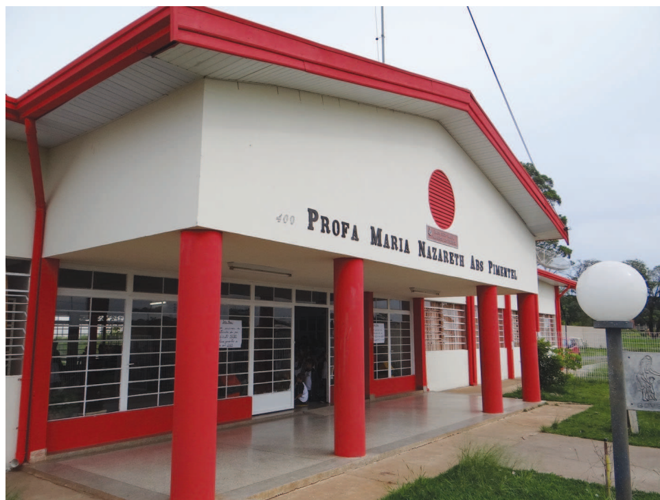
Inauguração da reforma da EMEB Maria Nazareth foi realizada ontem

A partida acontecerá no Estádio "Dr. Paulo Araújo Novaes" (São Paulão), a partir das 16h00 com a disputa entre São Paulo x Amigos do Betão. A Prefeitura da Estância Turística de Avaré convida a todos os amantes do futebol para prestigiar esse grande jogo.