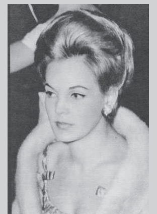
Ilustres fregueses: o ex-presidente Juscelino e a miss Brasil Terezinha Morango.