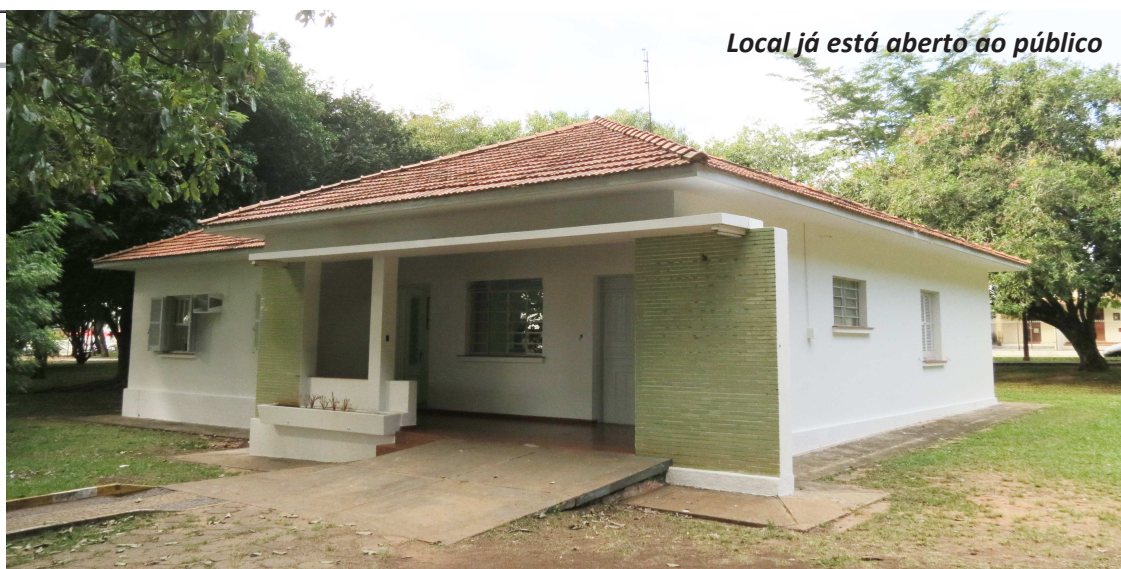
Local já está aberto ao público

CERIMÔNIA - Na noite do dia 29, a partir das 19h30, a abertura da Casa de Cultura obedecerá a seguinte programação aberta ao público: apresentação do novo painel fotobiográfico e de novo folheto do Memorial Djanira; entrega de folhetos da Galeria de Autores Avareenses na Biblioteca Municipal e homenagem ao escritor José Pires