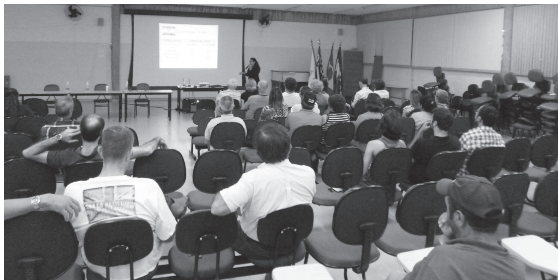
CRÉDITO TEXTO E FOTO: FERNANDO FRANCO AMORIM/COMSEA AVARÉ

Entre outras atribuições, o conselho tem como função principal ser um espaço de articulação entre o governo e a sociedade civil para a formulação das diretrizes e prioridades de construção das políticas públicas e ações na área da segurança alimentar e nutricional da população avareense.