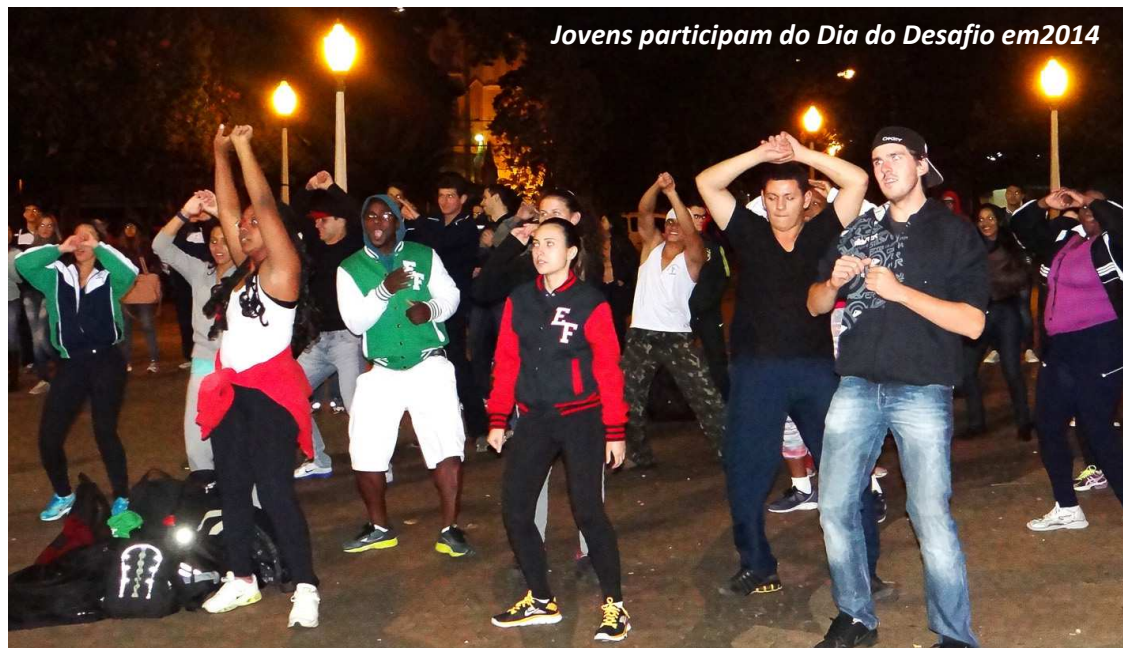
Jovens participam do Dia do Desafio em 2014

Coordenado pelo Sesc, desde 1995, o Dia do Desafio é uma iniciativa da TAFISA - The Association For International Sport for All - conta com o apoio da ISCA - International Sport and Culture Association - e da UNESCO e trata-se de uma realização das prefeituras municipais.