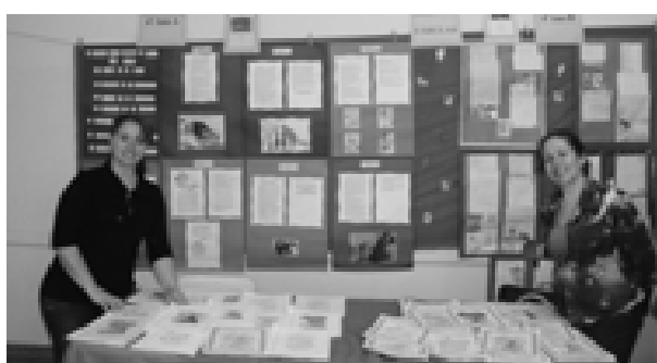
EMEB Fausto Rodrigues