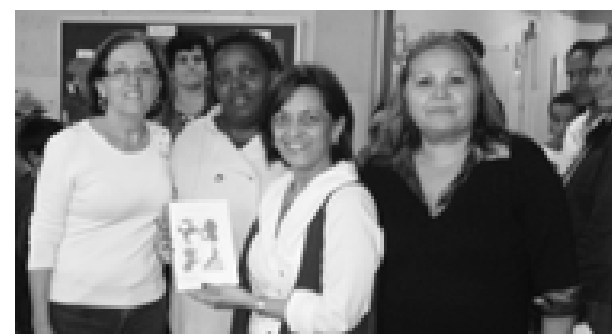
EMEB Eruce Paulucci