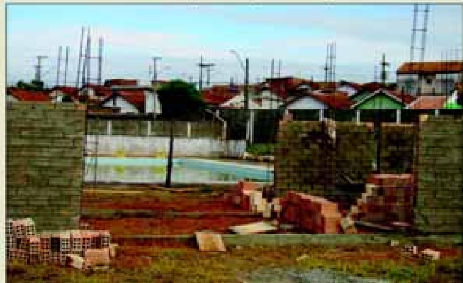
Construção de vestiários do CSU