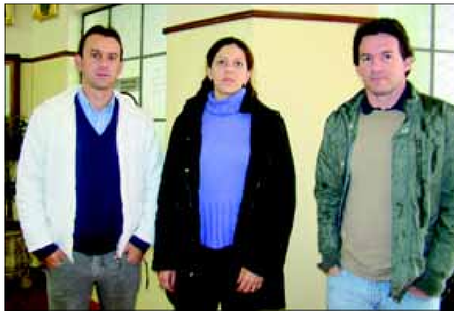
Engenheiros responsáveis e Arquiteta do CDHU de Sorocaba, responsável pela vistoria

No bairro serão construídos 29 muros de arrimo, sendo 18 na quadra K e 11 na quadra L. Os muros terão a finalidade de acertar os terrenos, de maneira a conter aterros e encostas (barrancos). Foi estipulado o prazo máximo de um mês para início das obras.