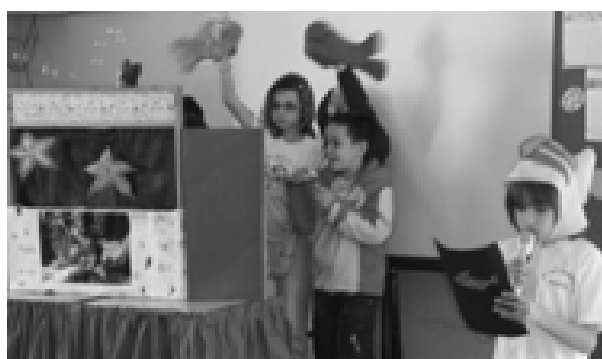
EMEB Clarindo Macedo