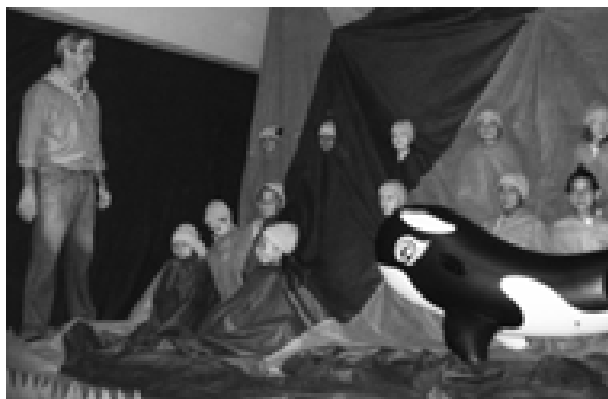
EMEB Elizabeth de Jesus Freitas

importante. Os projetos envolveram toda a rede de ensino, atingindo todos os objetivos com sucesso.