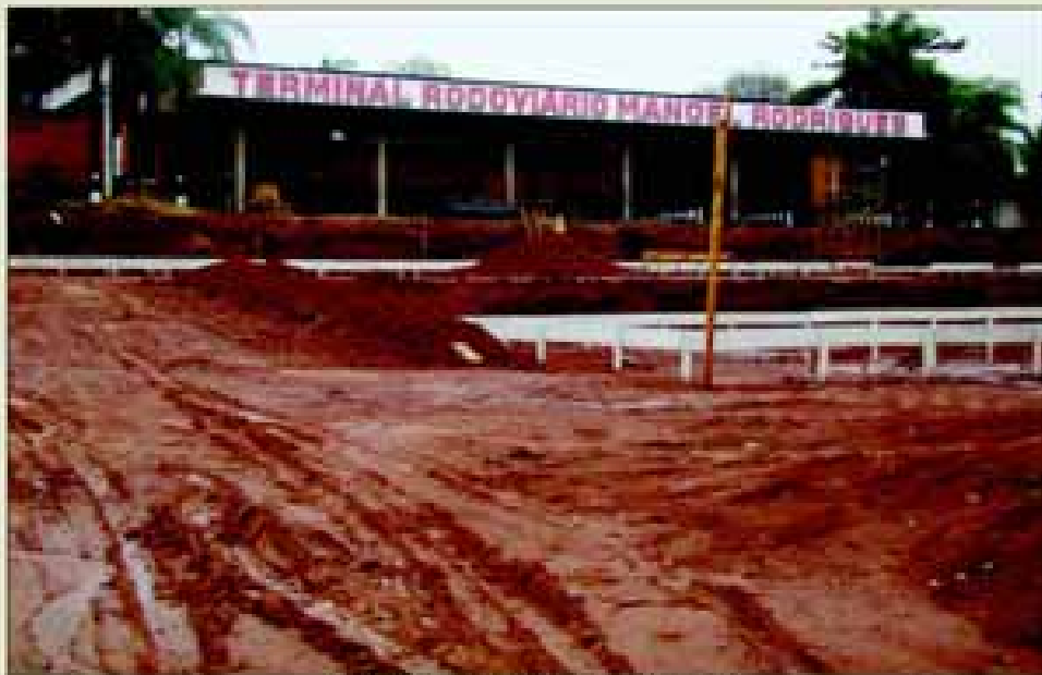
Terminal Rodoviário e Urbano