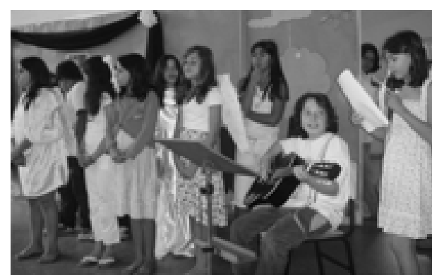
EMEB Dona Anna Novaes de Carvalho