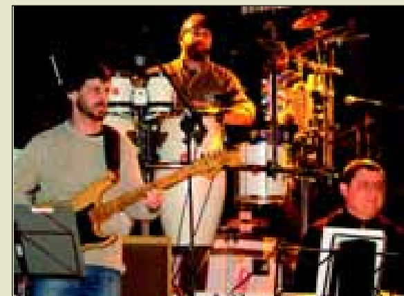
Banda de Apoio do Festival

A cidade já está respirando música com mais uma edição das eliminatórias avareense e regional da Feira Avareense de Música Popular - FAMPOP -, fase essa que ficou co-