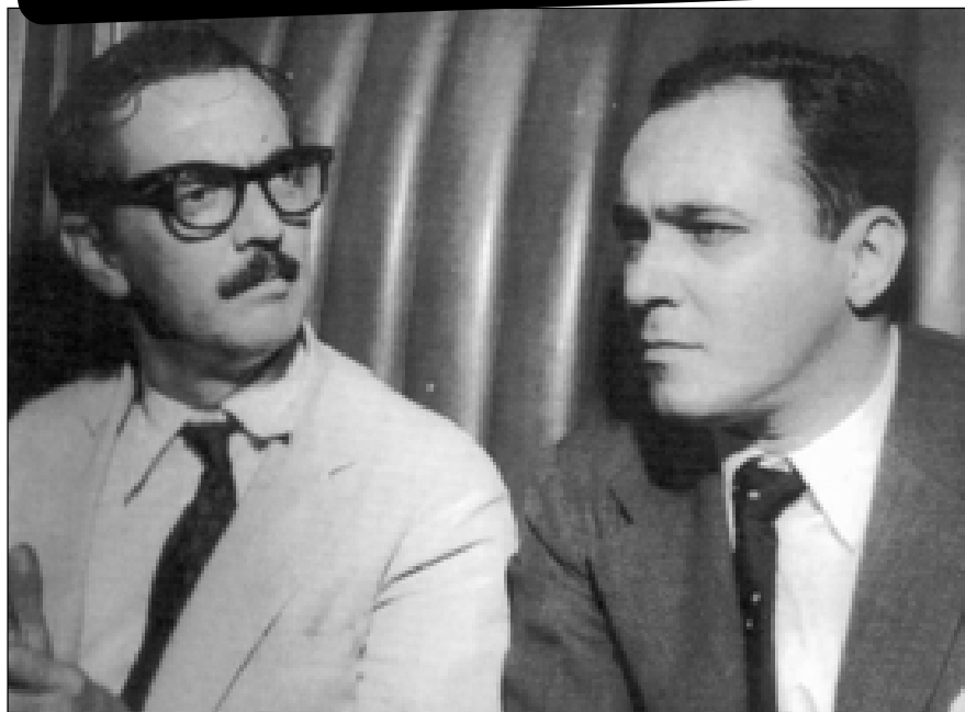
Israel, secretário de Estado de Governo, ao lado do então governador Jânio Quadros, 1957

A trajetória política de Novaes começa ainda no Estado Novo, quando ele esteve entre os signatários do “Manifesto à Nação”, lançado em novembro de 1943, contra Vargas.