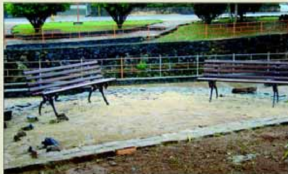
Remodelação da Praça Brasil-Japão