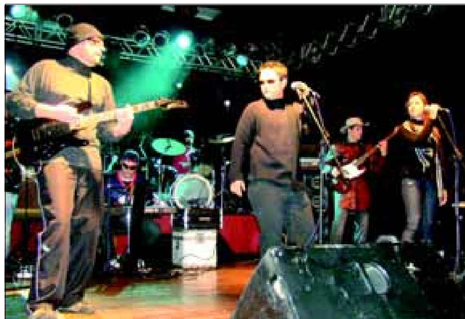
Banda Iandé com a música "Rótulos"