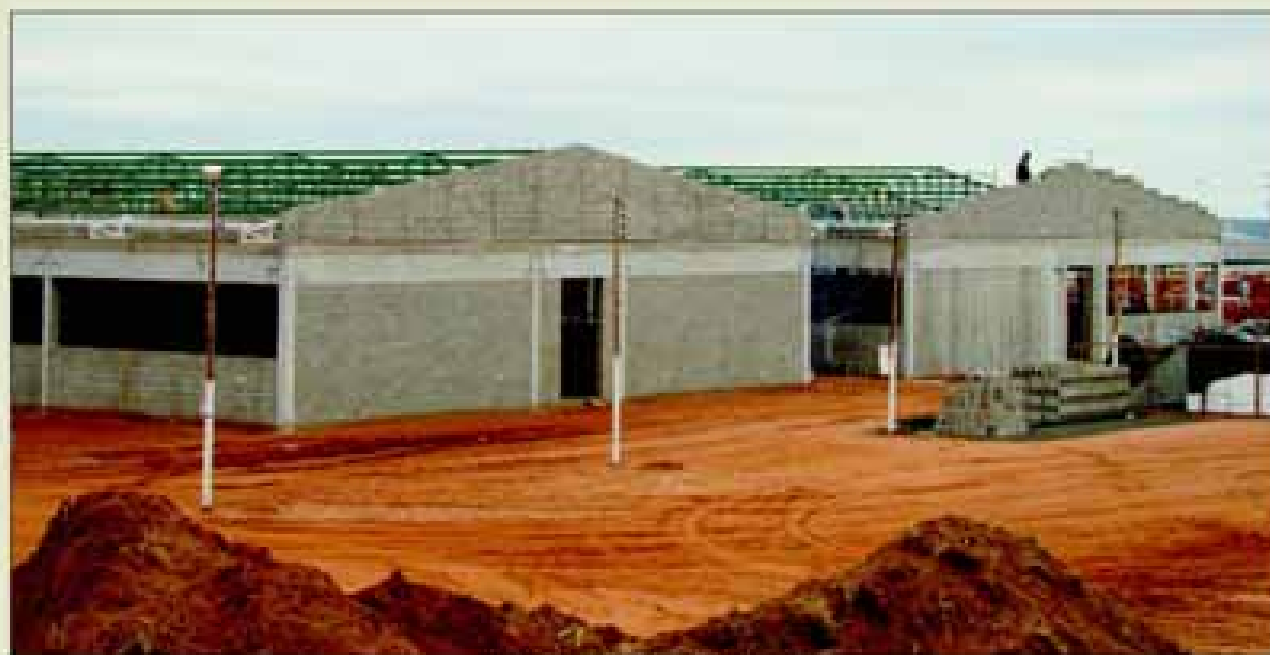
Escola Técnica Federal

de 9 meses. Na segunda fase da obra, serão implantados 2 laboratórios, auditório, quadra poliesportiva e auditório. Vale ressaltar que a obra gera cerca de 200 empregos diretos e indiretos.