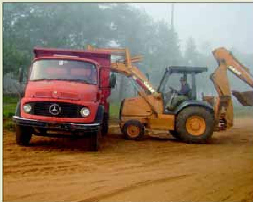
Início da pavimentação da Avenida Cunha Bueno

A reforma e ampliação do Terminal Rodovi-