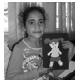
EMEB Celina Bruno