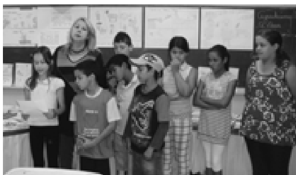
EMEB Victor Lamparelli