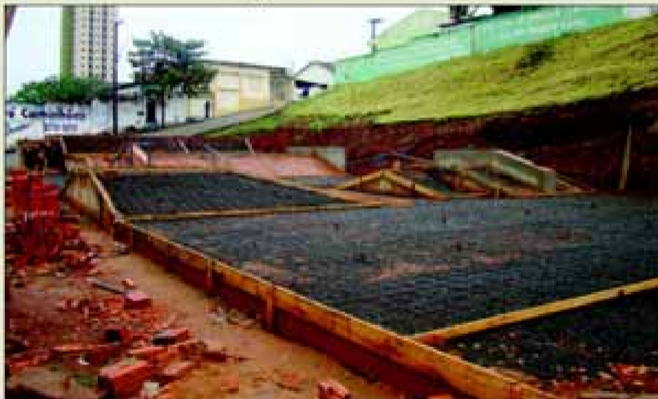
Pista de Skate