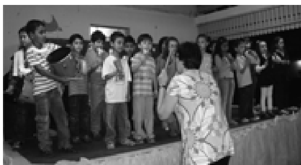
EMEB Maneco Dionísio