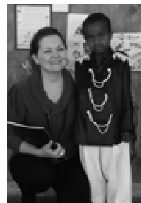
EMEB Suleide Maria Bueno