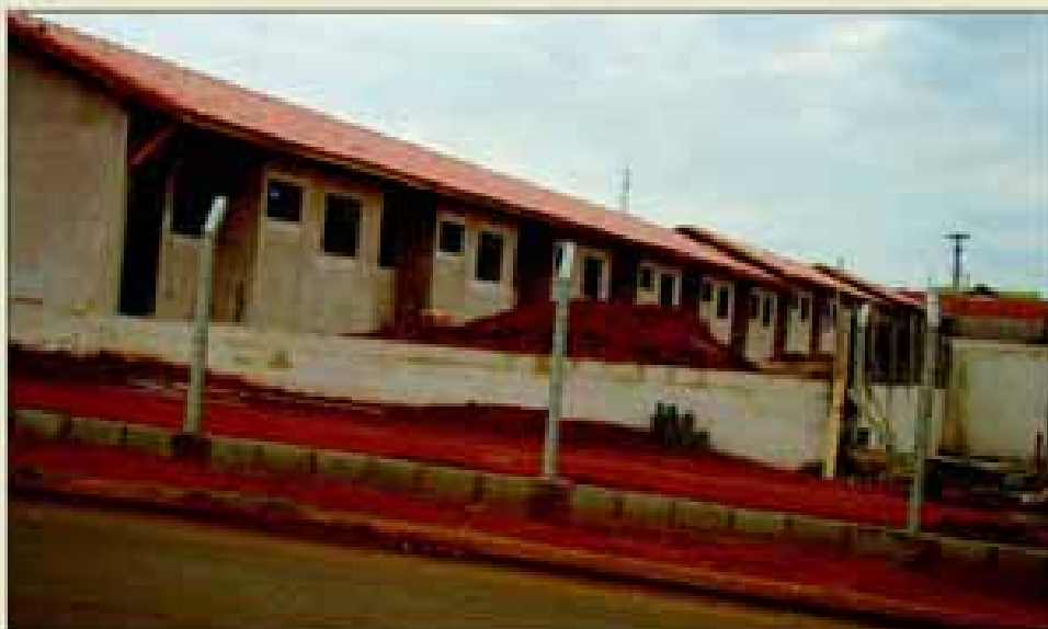
Moradias do Programa "Minha Casa, Minha Vida"