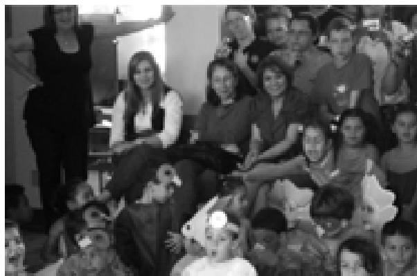
EMEB Zainy Zequi de Oliveira