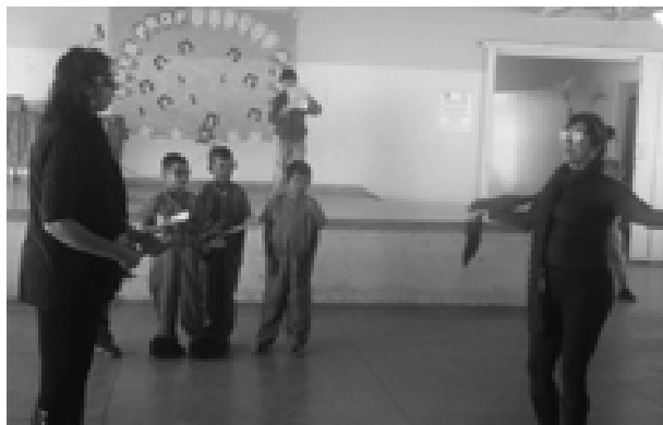
EMEB Carlos Papa