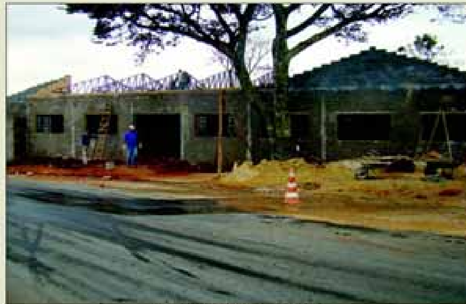
Creche do Bairro Camargo