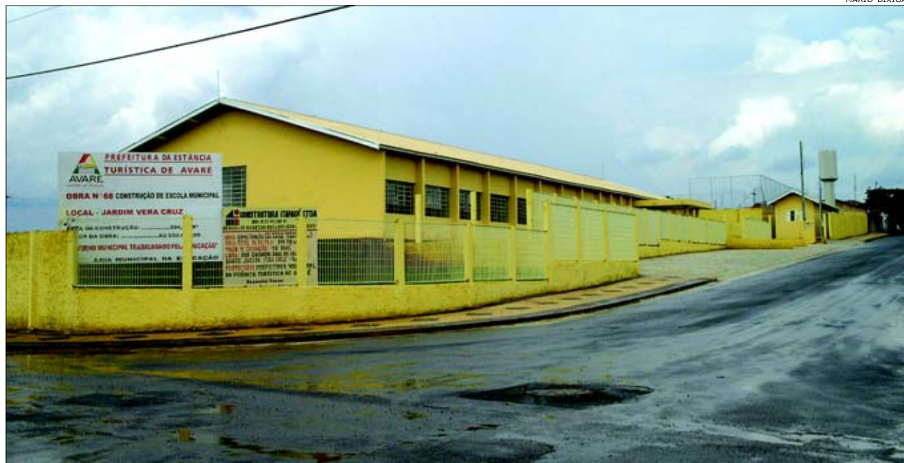
A escola conta com oito salas de aula, além de quadra poliesportiva

874 metros quadrados e contará com oito salas de aula, quadra poliesportiva e casa do zelador. Uma outra escola está sendo construída no Jardim Paraíso. A escola terá