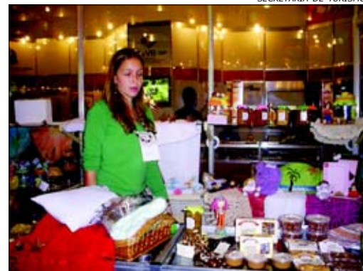
O stand de Avaré foi bastante concorrido

Realizado de 22 a 24 de setembro, no Esplanada Shopping, em Sorocaba, o 5º Salão Regional de Turismo do Cuesta Alto Paranapanema contou com a participação de Avaré.