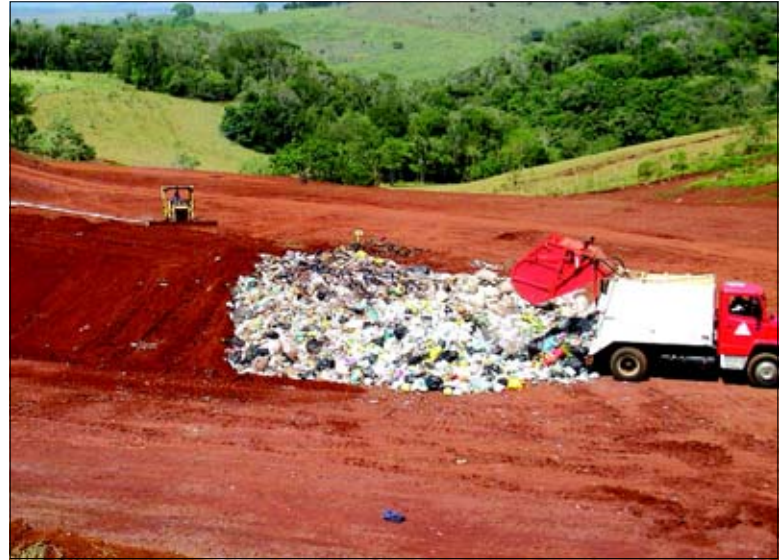
Aterro Sanitário de Avaré já está sendo considerado como modelo

balho e cada um deles faz duas viagens por dia. Tomando-se por base essa demanda de lixo, acredita-se que o aterro sanitário poderá ser utilizado por 20 anos. O objetivo da Secretaria de Meio Ambiente é prolongar esse tempo para mais 10 anos. Para isso iniciará em breve uma campanha maciça para conscientizar a população a separar o lixo reciclável do lixo orgânico. Desta forma o lixo reciclável seria destinado aos catadores da Unicoop (Cooperativa de Catadores) e o lixo orgânico teria como destino o aterro sanitário. Assim o acúmulo de lixo no aterro seria menor e possibilitaria uma vida útil maior ao aterro.