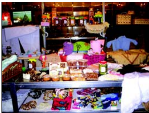
Produtos de Avaré tiveram destaque na feira