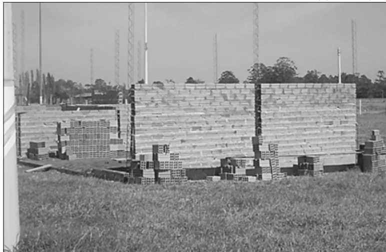
Posto fará atendimento preferencial em equinos, devido ao grande número de exposições no local

A Prefeitura da Estância Turística de Avaré está construindo no Recinto da Emapa um Posto de Atendimento Veterinário. O posto terá como