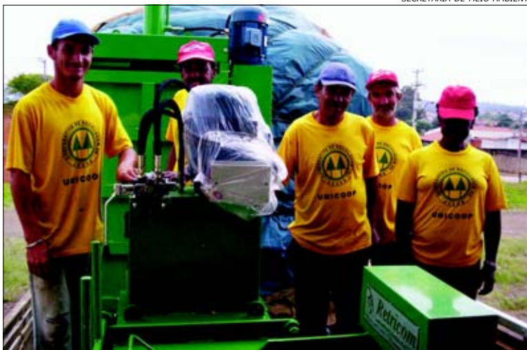
Com material prensado, cooperados conseguem preço melhor

Com as prensas os catadores terão oportu-