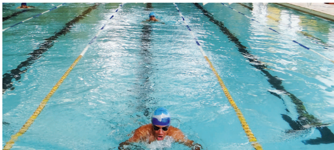
Aulas de natação são realizadas na Piscina municipal

As aulas de natação ocorrem às segundas, terças e quintas, das 8h às 10h, na Piscina Municipal. Já a hidroginás-