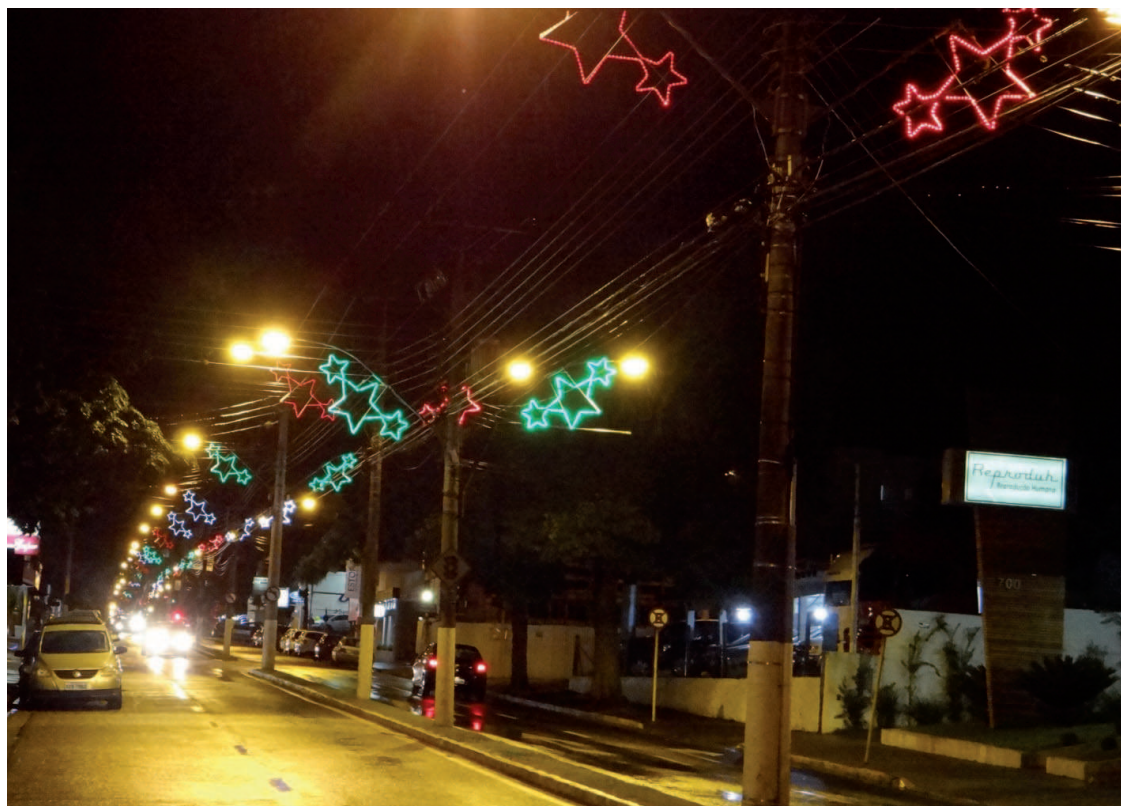
Avenida Prefeito Paulo A. Novaes já decorada para o Natal

O corpo de jurados será formado por cinco membros que julgarão as decorações apresentadas de acordo com os seguintes critérios: Categoria Imóveis Residenciais e Edifícios - Parte externa: 1 - Criatividade, beleza, originalidade, inovação e iluminação; Categoria Imóveis Comerciais - Par-