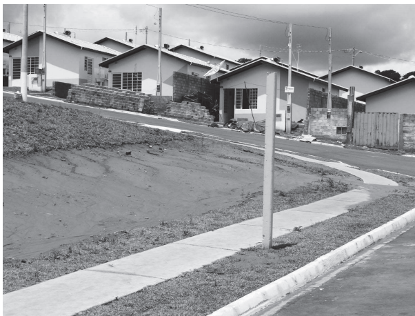
Ponto de ônibus no Residencial Mário Emílio Bannwart

A partir de agora os "circulares" vindos do centro da cidade vão entrar no Jardim Paraíso pela Rua Seme Jubran, passando em seguida por trechos das ruas Félix Costa de Oliveira, Dona Lolita e Jandira Pereira até atingir a rotatória. De lá vão seguir pela Rua João Paulo Nogueira e pela Avenida Armando Padredi até o acesso ao Residencial Mário Bannwart. No novo bairro o ônibus sobe pela Rua Aparecida dos Santos Jábali, passa pela Avenida Wilma De Maria Valente e pela Rua João Tezza Neto