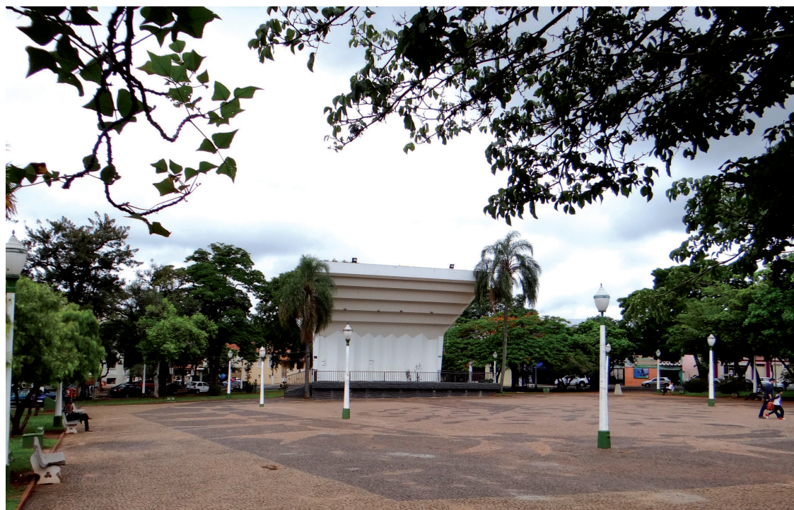
Praça Prefeito Romeu Bretas será revitalizada

A intervenção na Praça da Paz vai garantir melhor visibilidade e valorização daquele ponto turístico frequentado por avareenses e visitantes que passam pela cidade.