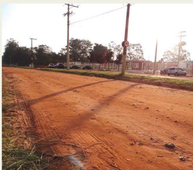
Avenida Mário Covas e trecho da segunda pista da Avenida Parapanema receberão asfalto