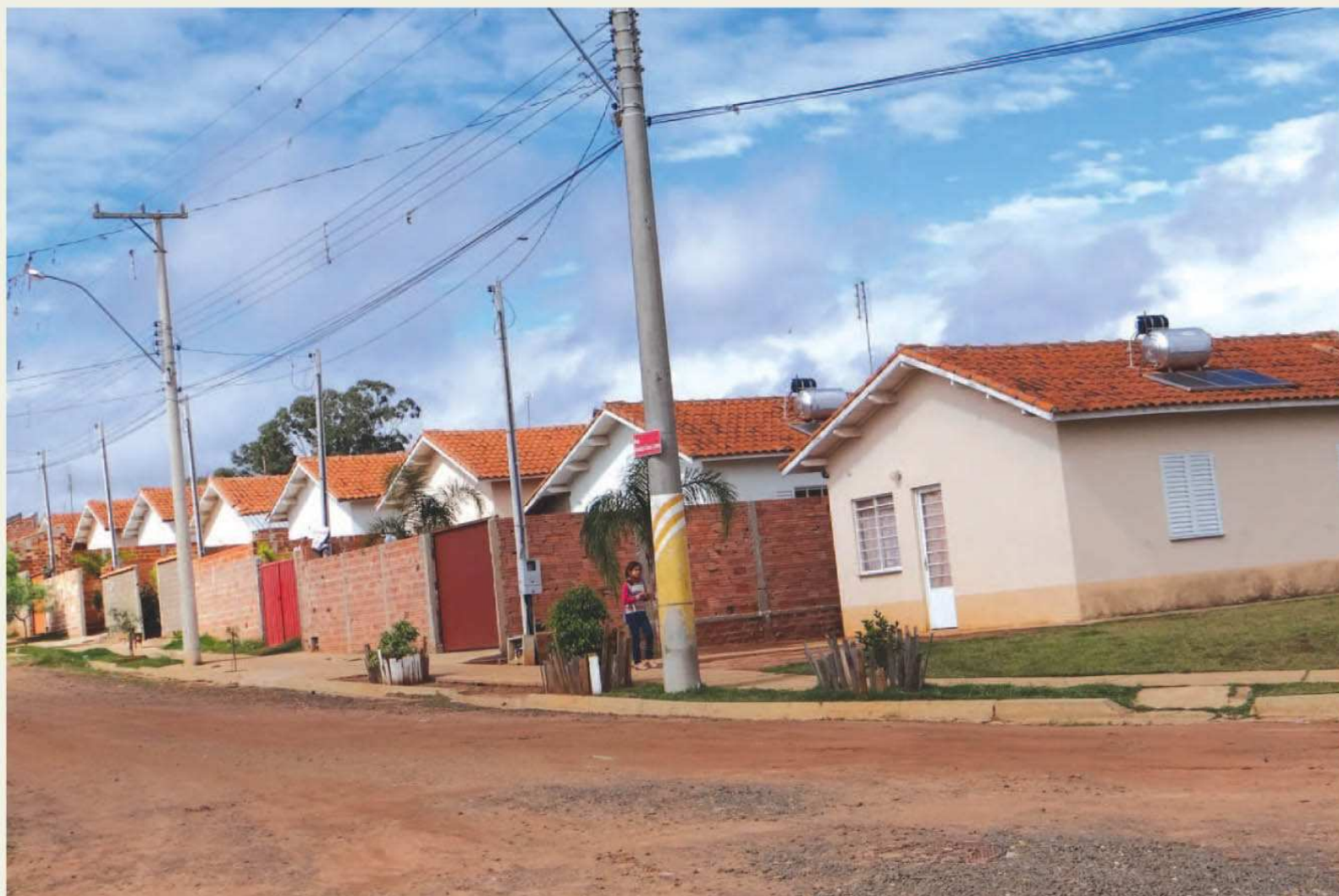
Conjunto Habitacional do Camargo também será asfaltado