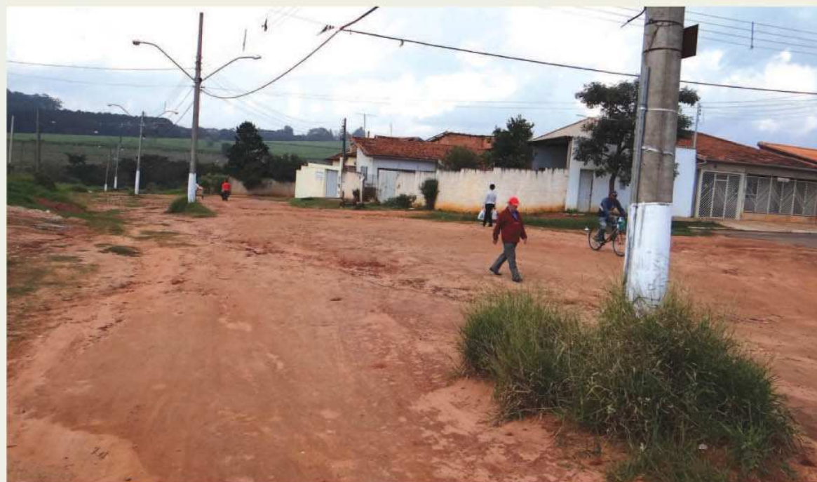
Novas ruas do Jardim Paraíso serão asfaltadas