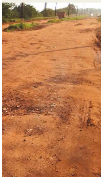
Asfalto no segundo semestre