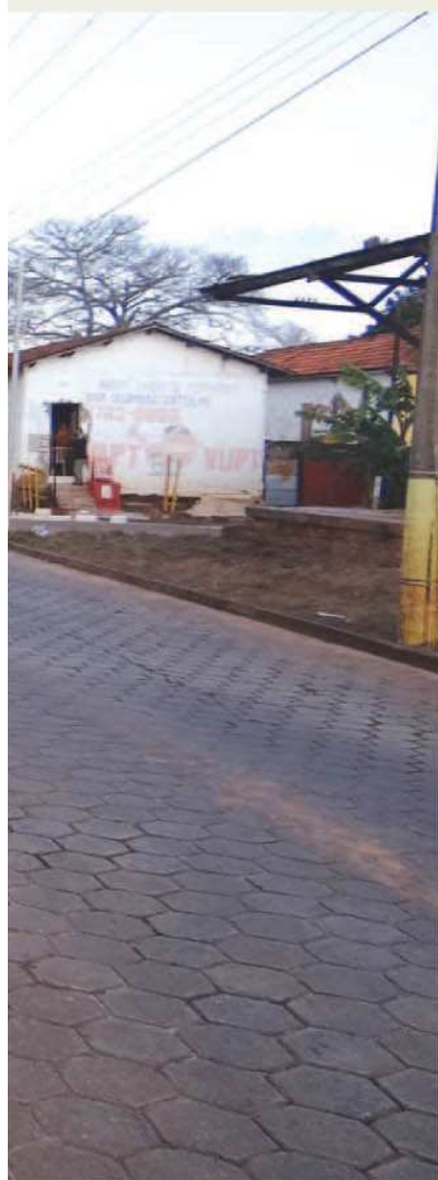
Asfalto em Avaré