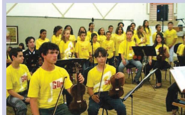
Projeto Guri, pólo Avaré

Com atrações envolvendo música, teatro e dança, Avaré terá a primeira Noite Cultural Beneficente, que acontecerá no próximo dia 19, a partir das 19h00, no Baracão da União Negra Avareense (UNA), localizada na Rua Júlio Belucci, 401, no Bairro Brabância. A entrada é 1 kg de alimento não perecível.