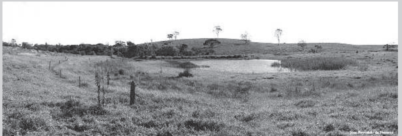
Rio Novo, em sua nascente no município de Itatinga. Abaixo o rio em terras de Avaré. Desenho de Franzolin mostrando o histórico paiol próximo das águas do Abaré-i

O cronista lembra que esse grande rancho ocupava o mesmo lugar em que,