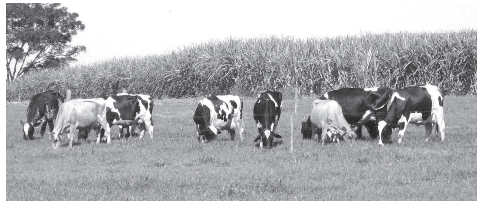
Alimentação adequada do gado são fatores fundamentais na produção leiteira

Texto e foto: Assessoria de Imprensa CATI Regional Avaré