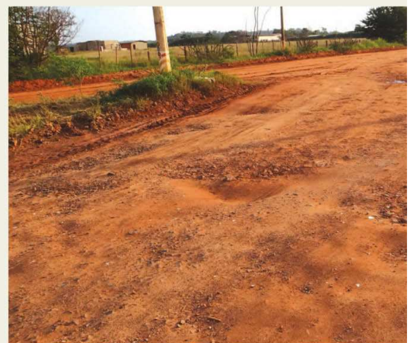
Trecho final da Donguinha Mercadante receberá asfalto