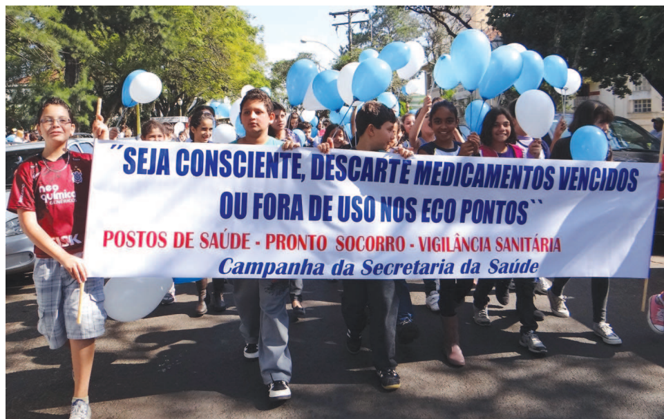
Alunos da Rede Municipal de Ensino participam da passeata para divulgar a campanha

Para o descarte dos medicamentos, foram criados Eco Pontos, que já estão instalados nos Postos de Saúde, Pronto Socorro e Vigilância Sanitária, podendo assim a população fazer o descarte de forma adequada. A maioria das pessoas acaba jogando erroneamente os medicamentos em ralos, pias, va-