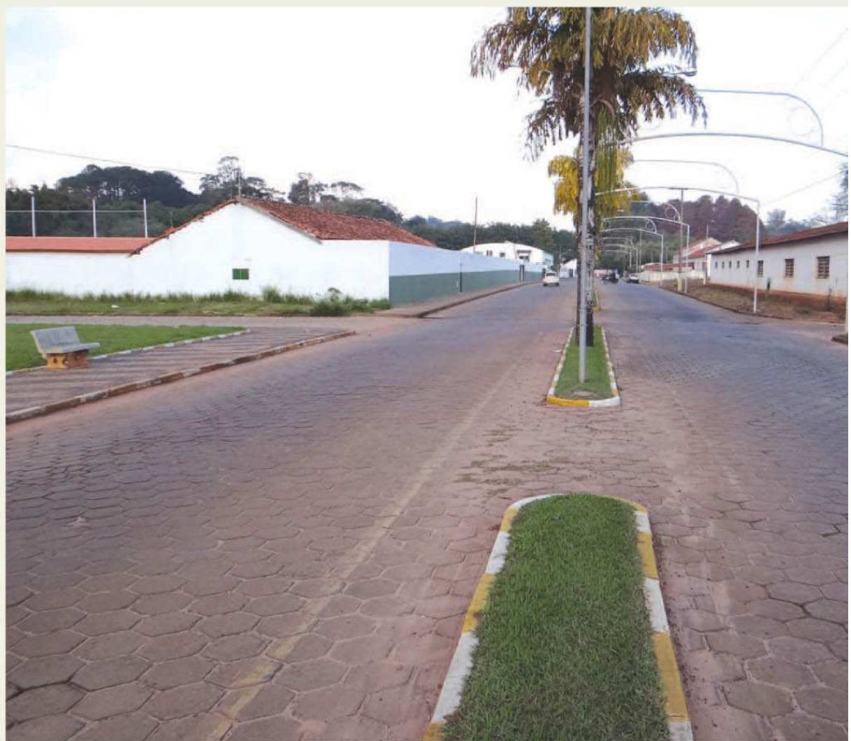
Asfalto das Avenidas Major Rangel e Misael Euphrásio Leal impulsionarão o turismo

A Prefeitura Municipal informa ainda que já concluiu o asfaltamento da Rua Miguel Chibani e está concluindo a pavimentação asfáltica da Avenida Emílio Figueiredo, ambas localizadas no bairro Jardim Paraíso. Após a conclusão da Avenida Emílio Figueiredo, terá início a pavimentação asfáltica das ruas Jandira Pereira, João Paulo Nogueira e Seme Jubram.