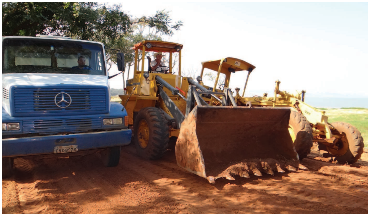
Maquinários trabalhando na construção do calçadão do Balneário Costa Azul

Com uma área de 48.000 m 2 e com 1 Km de praia, este local dispõe hoje de infra-estrutura básica para a prática do campismo, como 3 sanitários masculinos, 3 sanitários femininos, chuveiros elétricos e parque infantil. Em época de temporada, obtém-se um público de 4.000 a 6.000 pessoas por dia. No local existe uma área de estacionamento para 250 veículos e 50 ônibus, bem como, um pesqueiro público com capacidade para 100 pessoas.