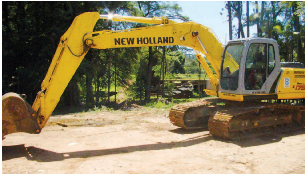
Máquina do DAEE já está no Horto Florestal para o início dos trabalhos na próxima semana.

O novo maciço será construído em gabião, espécie de estrutura armada em formato de caixa construída em malha de fios de aço galvanizado e preenchidos com seixos ou pedras britadas. A barragem terá 80 metros de extensão, 4 me-