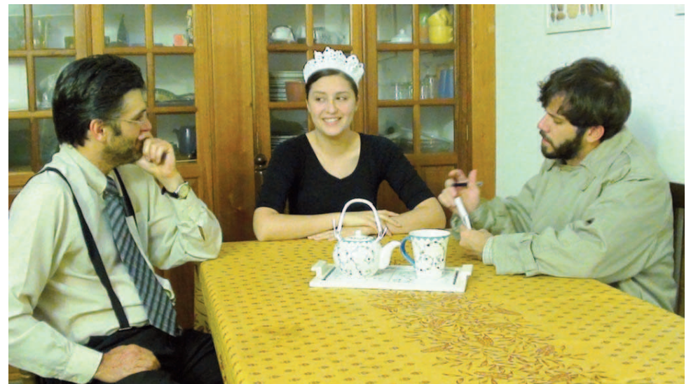
Atores avareenses gravam cenas do filme "O Gosto da Morte"