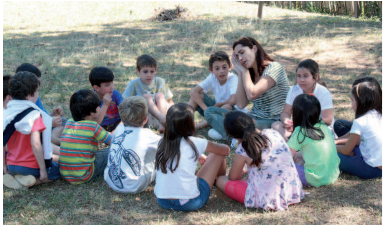
Aulas ao ar livre inspiram a imaginação dos alunos.

No Brasil, há doze escolas que aderiram a esse método pedagógico voltado primeiramente ao de-