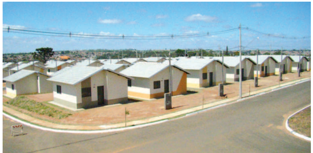
Inauguração das 202 casas acontece hoje