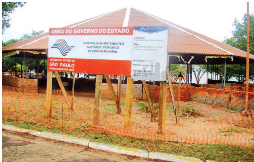
Construção do restaurante

As obras de construção do restaurante e dos novos sanitários e vestiários do Camping Municipal estão em pleno andamento. Com a construção do restaurante do Camping Municipal, algo almejado há muito tempo pelos campistas, assim como dos novos sanitários e vestiários,