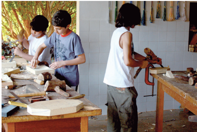
Estudantes interagem em tarefas práticas.

Escola Rudolf Lanz é uma das poucas no Brasil a seguir a pedagogia Waldorf