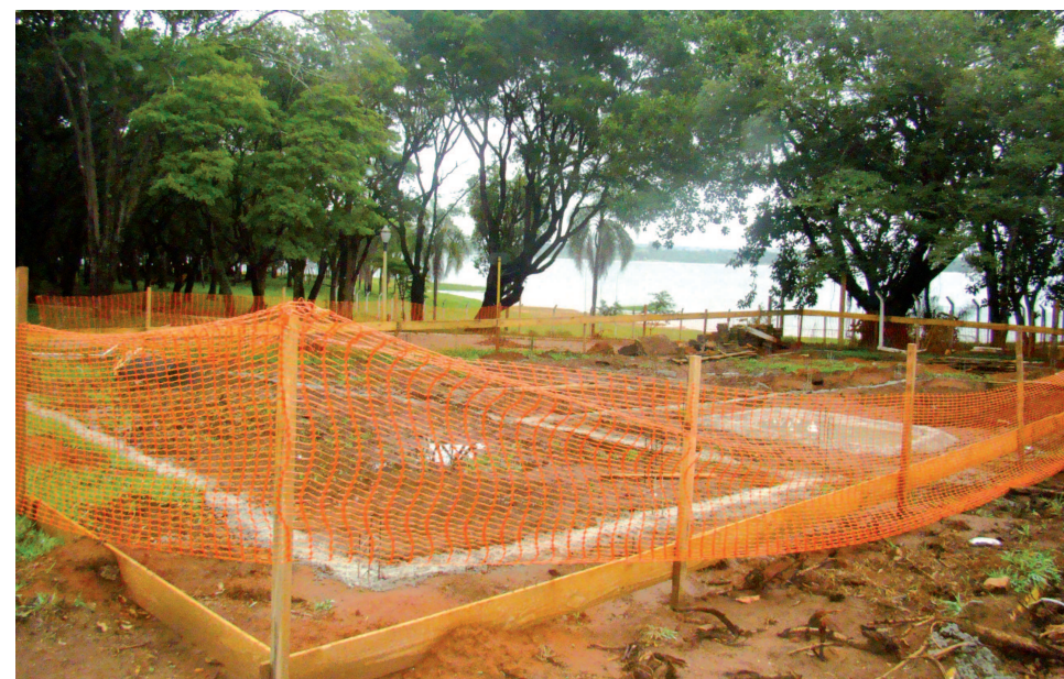
A construção dos vestiários também já teve início

campings do País, envoltos em ar puro, sol e águas límpidas. Sendo administrado pela Secretaria Municipal de Turismo, o seu horário de funcionamento é das 8h00 às 22h00, com capacidade de alojamento para aproximadamente 700 barracas en-