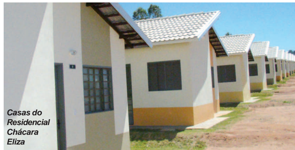
Casas do Residencial Chácara Eliza

fundamentais de 1269 casas populares. Um dos residenciais, em parceria com o SEC de Avaré, localizado no Bairro Jardim Presidencial, contará com a construção de 588 casas. Já o outro residencial, localizado no bairro Jardim Paraíso, oferecerá 681 casas para a população que tanto luta para a conquista de uma casa própria.