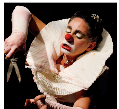
Peça é a última apresentação do Circuito Cultural Paulista em 2011 em Avaré

A peça conta a história de "Mafalda Mafalda", uma artista de cabaré banida pelo seu público após uma apresentação mal sucedida com uma tal "platéia do lado de lá". O espectador considerado "o público do lado de cá", por meio de flashbacks reais e também pelo depoimento da protagonista, tem acesso a uma realidade deturpada dos fatos, porém, logo acaba