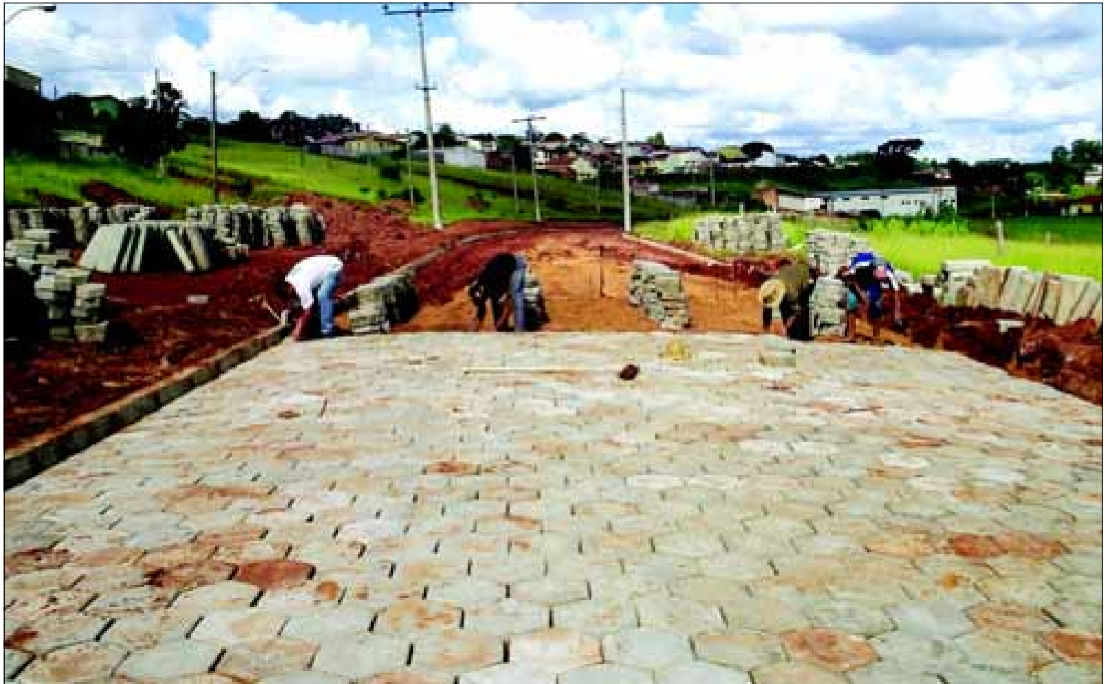
Avenida Nações Unidas já recebe a pavimentação em lajotas

A obra é uma reivindicação antiga da população e irá beneficiar um grande número de pessoas que trafegam pelo local.