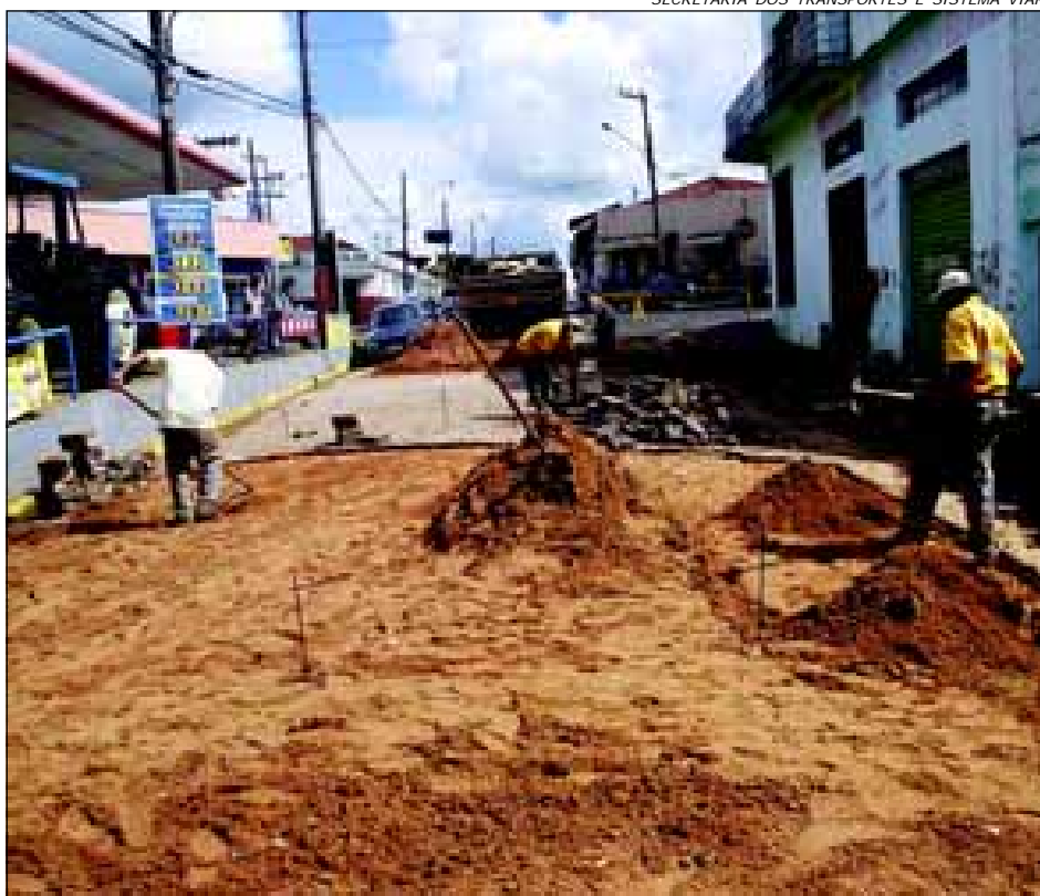
Rua Amazonas, próximo a Rua Félix Fagundes

Desta forma é fundamental o trabalho da equipe da Operação Tapa Buraco para a regularização das ruas.