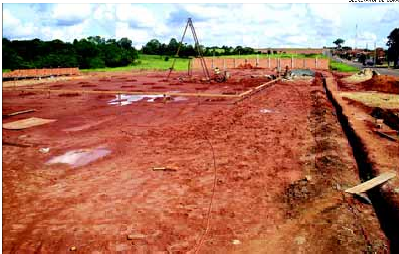
Escola está localizada na Rua Getúlio Vargas

seis salas de aula, área de recreação, administração, residência de zelador e quadra poliesportiva, sendo que o referido prédio escolar virá atender a reivindicação antiga daquele bairro, que devido o grande crescimento, aumentou muito a demanda de alunos, considerando-se que os investimentos na área educacional são de extrema importância e devem atender todos os bairros da cidade.