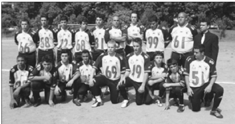
Time avareense vem fazendo um a boa campanha no Paulista

No último final de semana, o time de Futebol Americano Avaré Black Horse esteve em São Paulo e jogou suas duas primeiras partidas pelo Torneio de Integração (Campeonato Paulista da 2ª Divisão), ven-