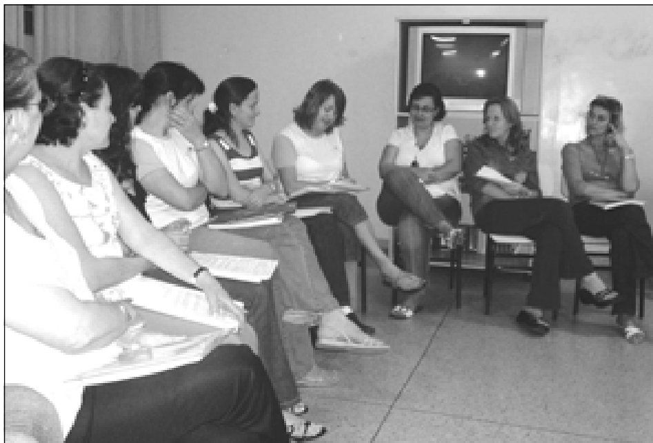
Workshop foi uma preparação para os próximos cursos a serem ministrado