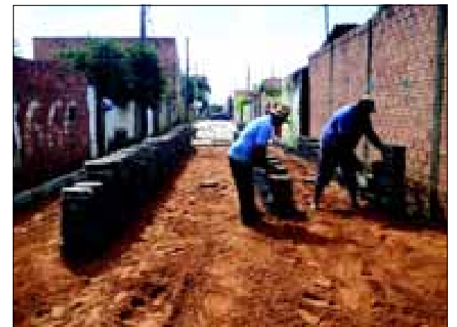
A obra é o complemento da pavimentação da Rua Anhanguera

SECRETARIA DOS TRANSPORTES E SISTEMA VIÁRIO