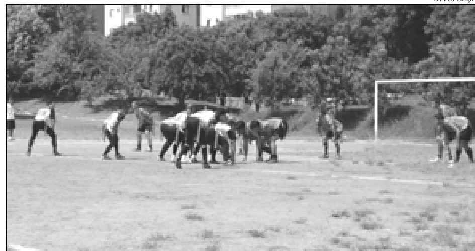
No dia 1º de março o Avaré Black Horse fará mais duas partidas