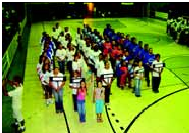
Empresas de diversos setores devem participar do evento

A Secretaria Municipal de Esportes (SEME) está convidando diversas empresas de Avaré para participarem de mais uma edição dos Jogos Industriais do Sesi. Esta é a quinta vez consecutiva que o evento é realizado em Avaré através