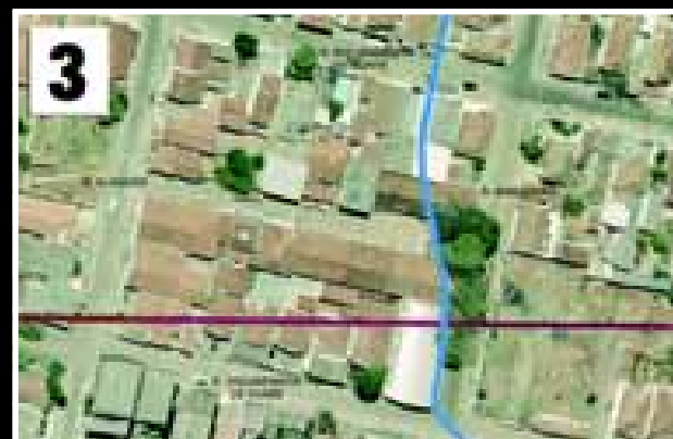
Cruzamento da Rua Voluntários de Avaré com Maranhão