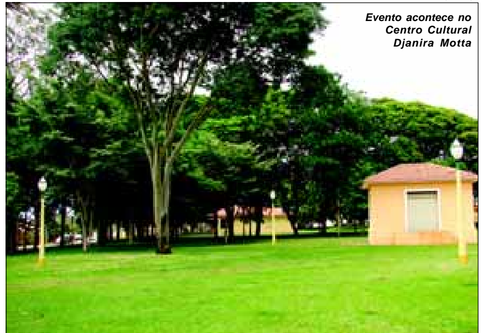
Evento acontece no Centro Cultural Djanira Motta