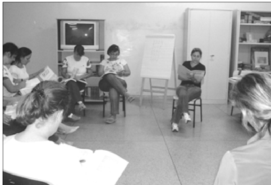
Cursos possibilitam a melhor capacitação dos funcionários

O primeiro módulo do curso será iniciado no dia 22 de fevereiro, na EMEB Dona Anna Novaes de Carvalho.