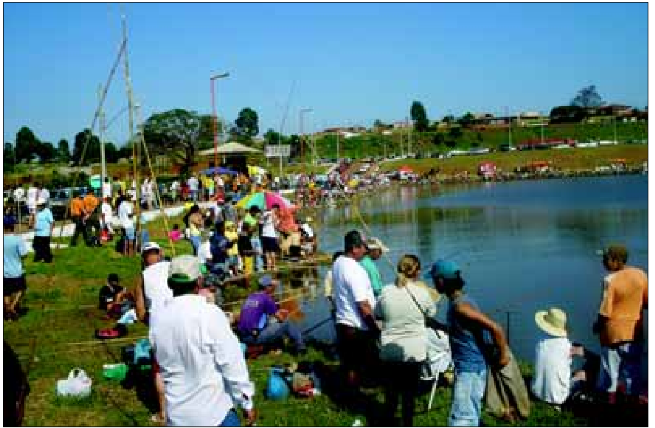
Haverá premiação em diversas categorias

Para definir o local onde cada pescador poderá ficar, será feito um sorteio antes do início.