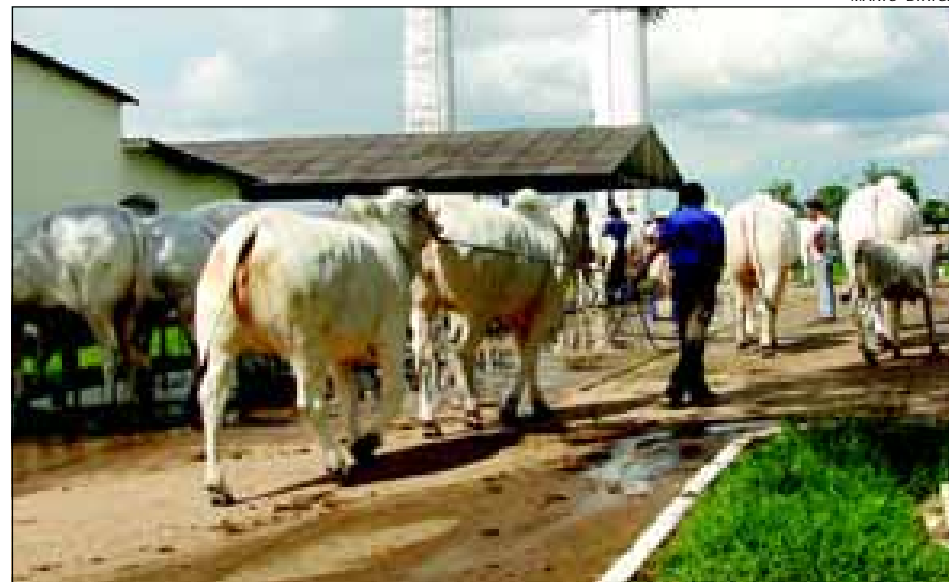
Primeiro turno é inteiro dedicado a raça Nelore

Já o segundo turno, que contará com a presença das raças Angus, Canchim, Brahman, Guzerá, Limousin, Santa Gertrudes e Simental, os julgamentos serão do dia 29 de fevereiro à 2 de março – data de encerramento da exposição.