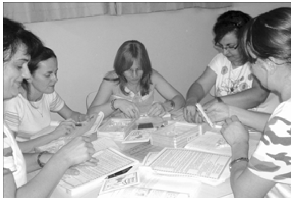
Os cursos são para funcionários de CEIs (Centro de Educação Infantil)