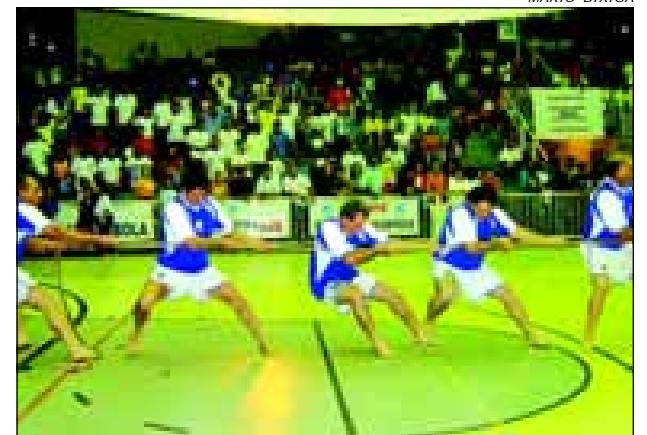
Durante a competição várias modalidades estarão em disputa

Entre as empresas, em um clima de muita descontração, acontecerem disputas de Pesca-ria, Tênis de Mesa, Cantor, Tiro ao Alvo, Xadrez, Damas, Dominó,