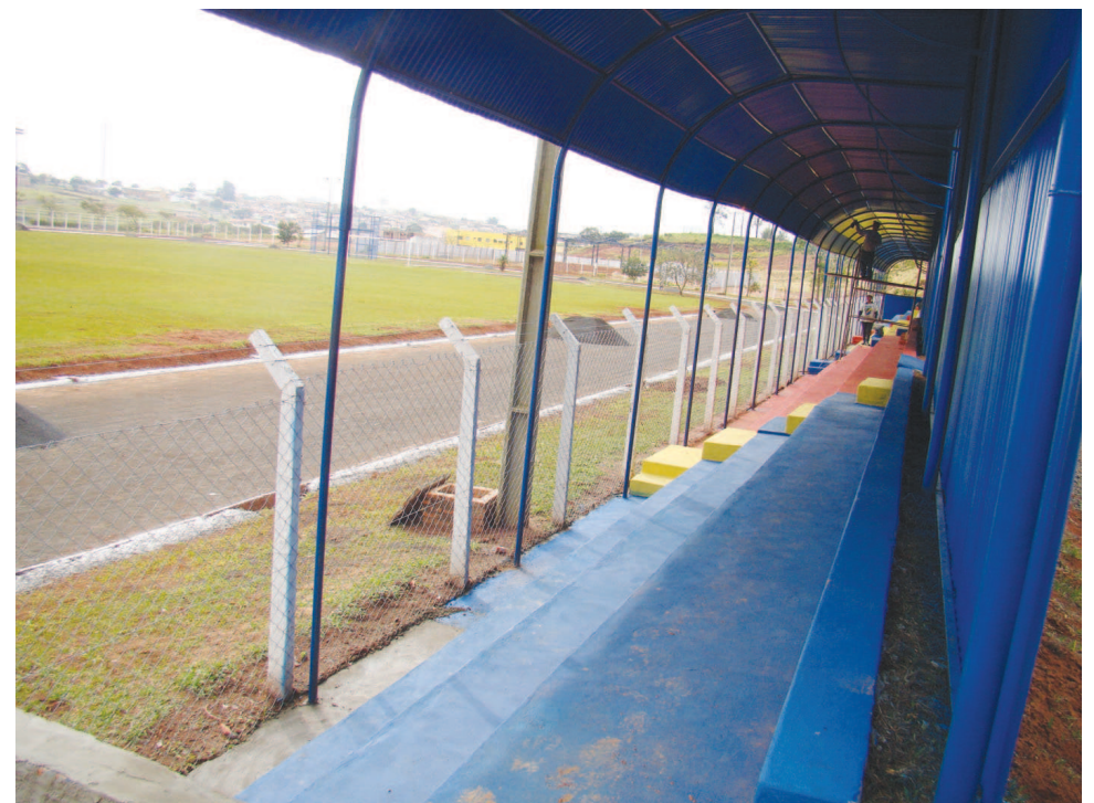
Reforma do Campo Municipal também será inaugurada