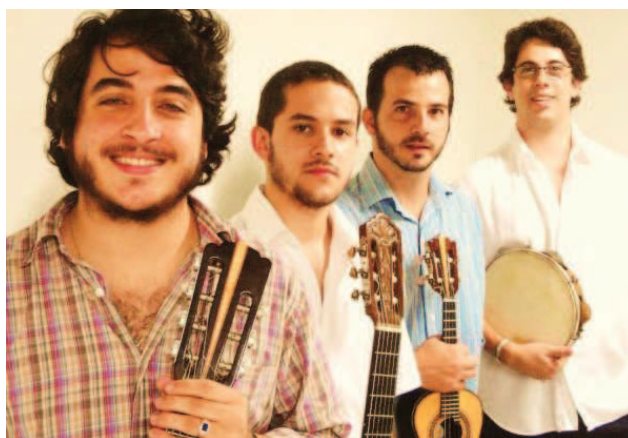
Regional Imperial e Nailor Proveta encerram hoje II Festival de Choro