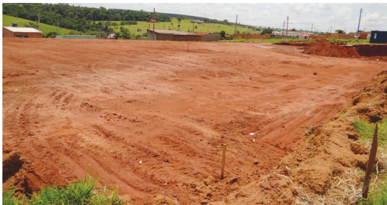
Nova Creche do Jardim Paraíso atenderá 224 crianças

Com a conclusão da terraplanagem, as obras estão previstas para se iniciarem no primeiro trimestre de 2013 e, juntas, irão oferecer 336 novas vagas para as crianças avareenses. Além disso, o Governo