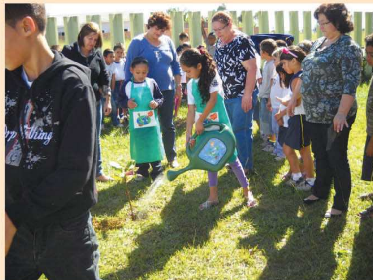
Alunos e professores da Emeb Eruce Paulucci realizam o plantio no jardim da escola