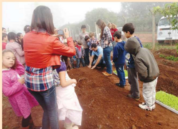
Alunos da Emeb Evani E. Batochio Casolato realizando o plantio de hortaliças, auxiliados pelos alunos do curso de agronomia da Eduvale