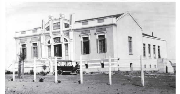
Santa Casa de Misericórdia de Avaré, 1914

O nome Misericórdia, uma das antigas invocações da Virgem Maria, foi empregado na Idade Média para nomear, em Florença, na Itália, uma irmandade: a de Nossa Senhora da Misericórdia.