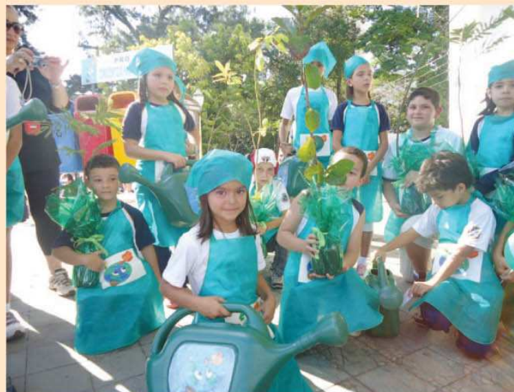
Crianças com a roupa que representa os amigos da natureza em suas escolas