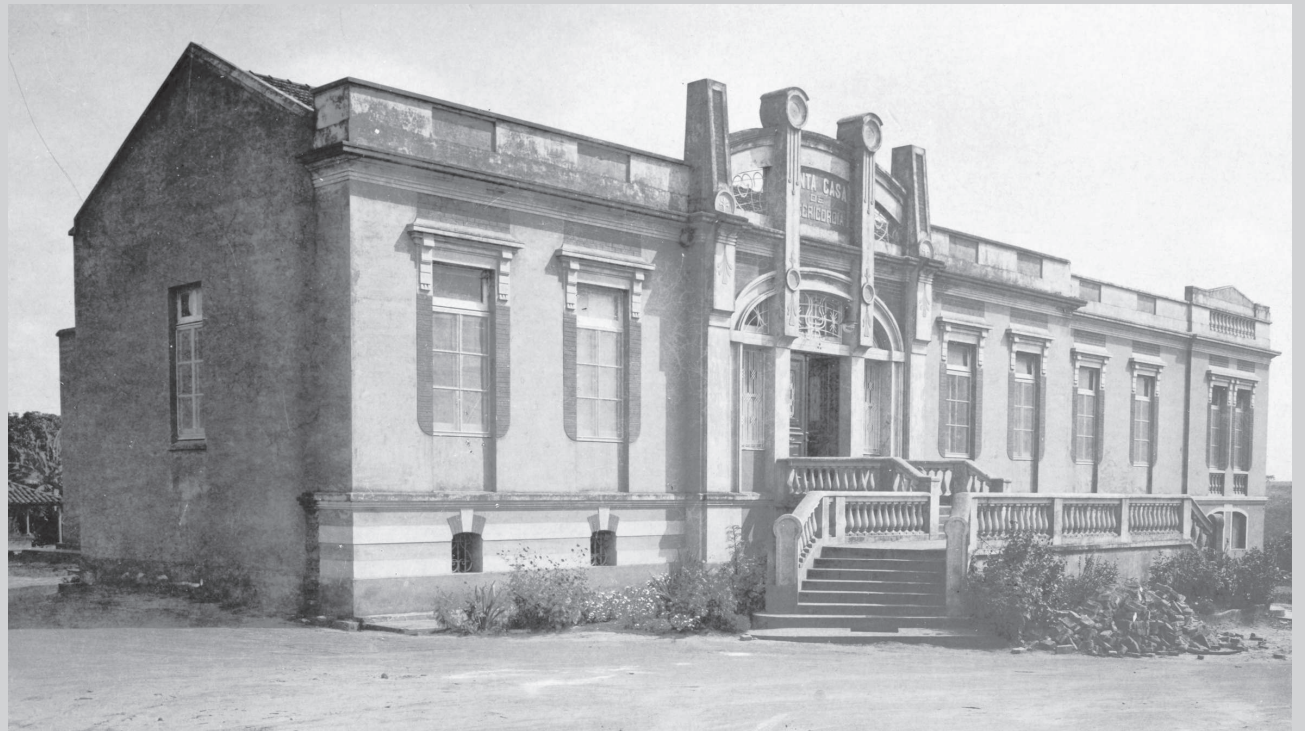
Em 1934, com as instalações já ampliadas

Em janeiro de 1906, a título de subvenção, o Congresso Estadual liberou a importância de 3 contos de réis para a Casa de Misericórdia.