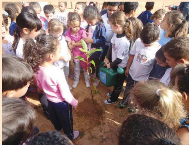
Alunos dos 1ºanos da Emeb Flávio Nascimento participam do plantio das árvores