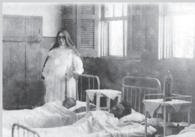
Doentes pobres atendidos pelas freiras de Madre Paulina, 1918