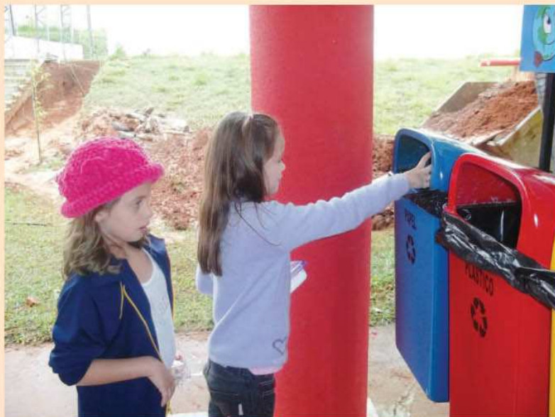
Alunos da Emeb Maria Nazareth utilizam as lixeiras de coleta seletiva

Futuramente, nossas escolas terão grandes árvores, plantadas durante o projeto e a sociedade, pessoas conscientes de suas ações contribuindo para a preservação do nosso planeta.