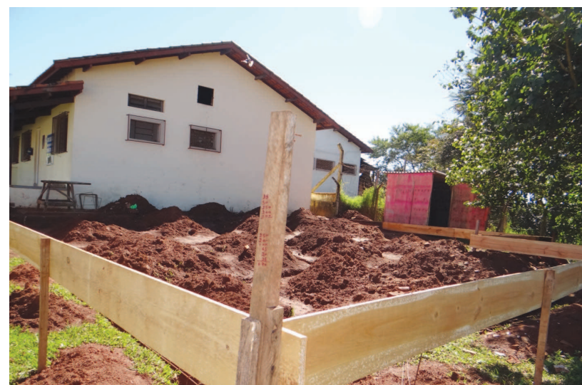
Ampliação do Posto de Saúde do Jardim Brasil

A obra, estimada em R$ 128.264,51, contará com a