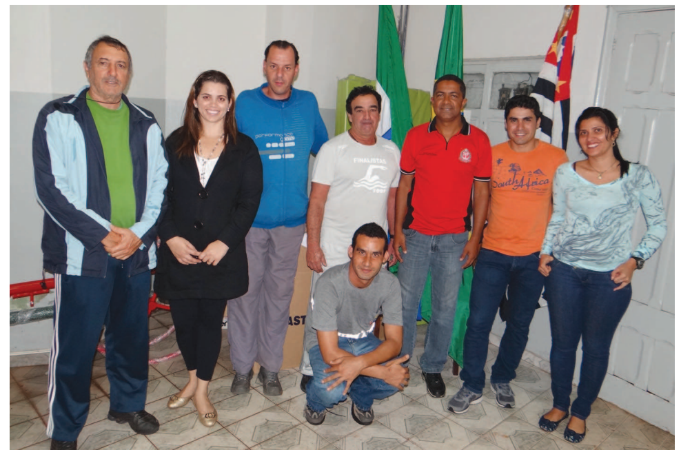
Comissão Organizadora do 56º Jogos Regionais

Através de uma fusão entre SEME/Avaré Mustangs e Palmeiras Locomotives para a disputa do Torneio Touchdown, o