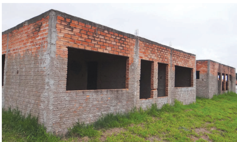
Posto do Vera Cruz já teve suas obras retomadas

Com 631,15 m 2 de área construída, o término da obra constará de cobertura e revestimento do prédio, instalação elétrica e hidráulica, acabamento em geral, estacionamento