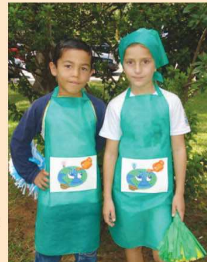
Alunos da Emeb Orlando Cortez