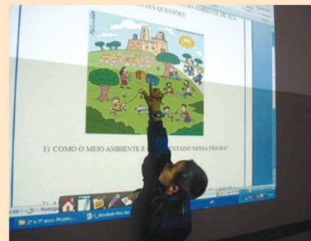
Aluno interagindo com a lousa digital

As escolas de Ensino Fundamental da rede municipal da Estância Turística de Avaré têm realizado com grande empenho o Projeto “Conscientizar para Preservar o Mundo”. Preocupada com a educação ambiental, a Secretaria Municipal de Educação propôs e acompanha em todas as escolas o projeto, desenvolvido com o objetivo de trazer informações, compartilhar ideias, pesquisar e refletir sobre nossas ações, contribuindo para a formação de cidadãos conscientes de suas responsabilidades com o meio ambiente e capazes de desenvolver atitudes de proteção e melhoria em relação a ele.