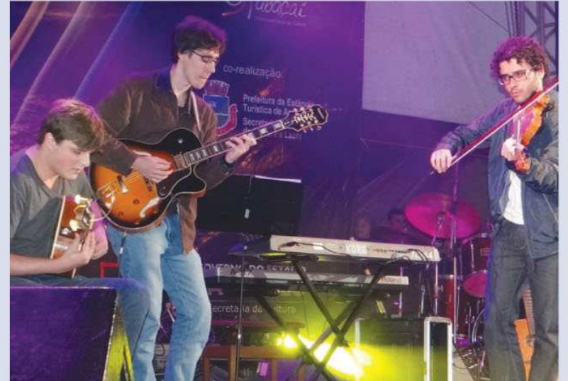
O violinista da música Cai e Quica levou o prêmio de melhor instrumentista