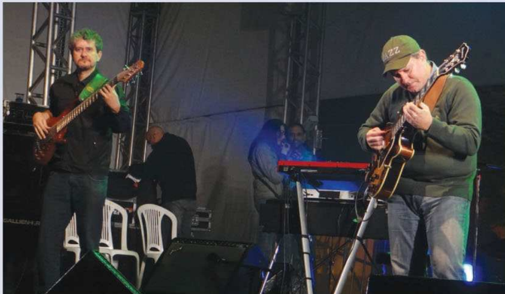
Melhor Instrumental para Céu de BH