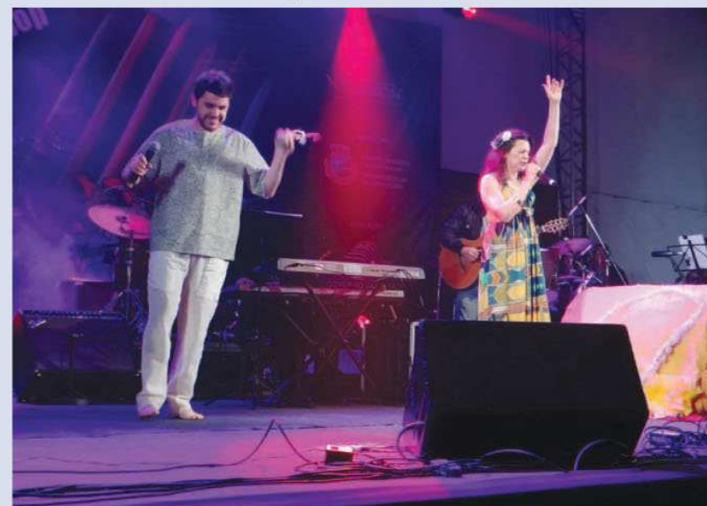
Melhor Arranjo para Boi Canário