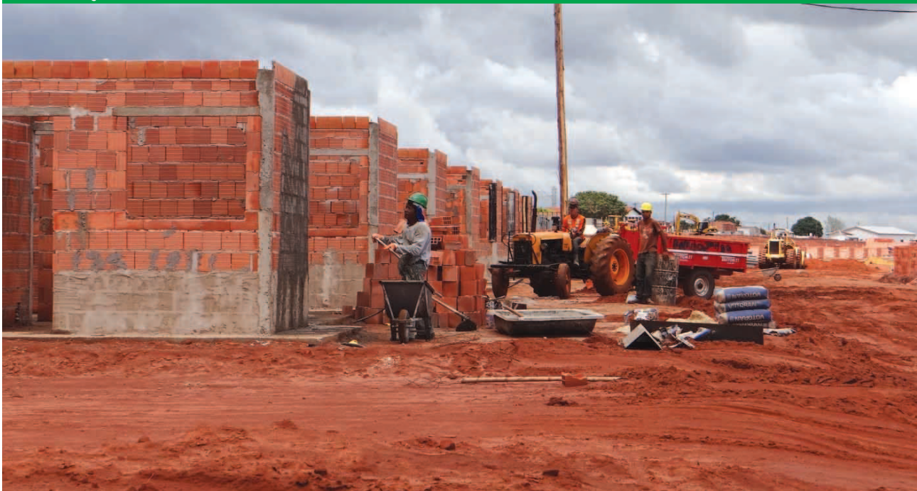
Casas estão sendo construídas ao lado do Bairro Jardim Presidencial