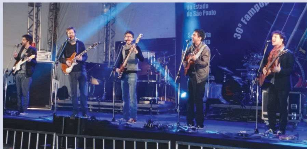
5 a Seco