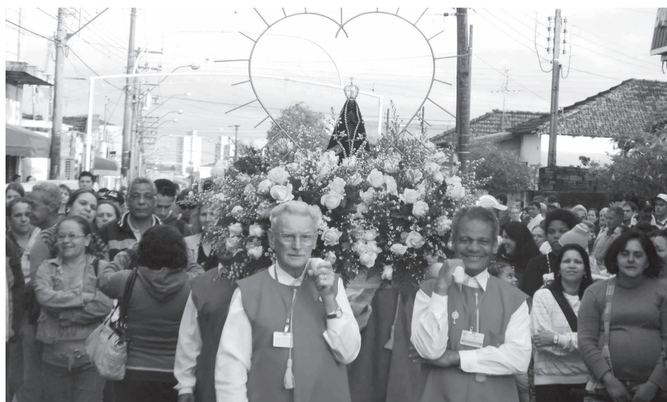
Saída da Procissão

Uma novidade desse ano foi a encenação da Via Sa-