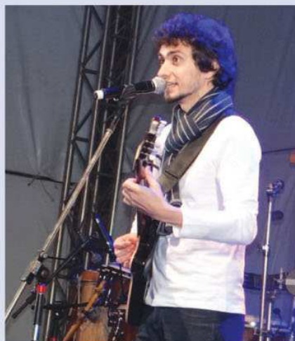
Prêmio de Melhor Letra para Nome a Pessoa