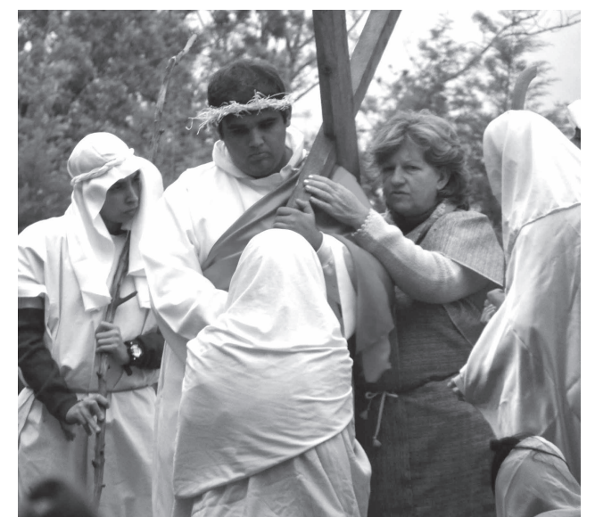
Encenação da Via Sacra

O ápice da procissão foi a celebração da Santa Missa já no Bairro Ponte Alta em frente à capela construí-