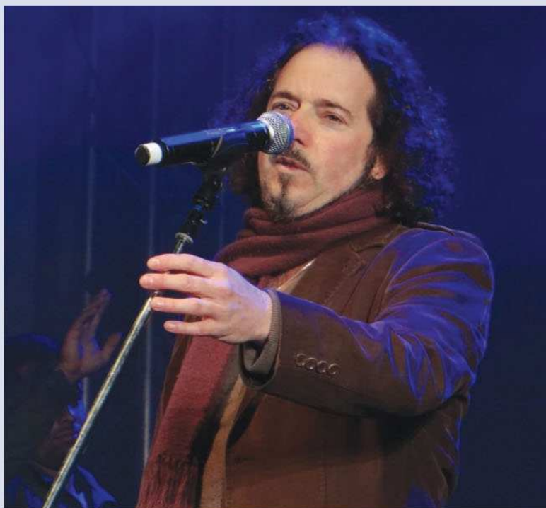
Primeiro Lugar para Flor do Lácio