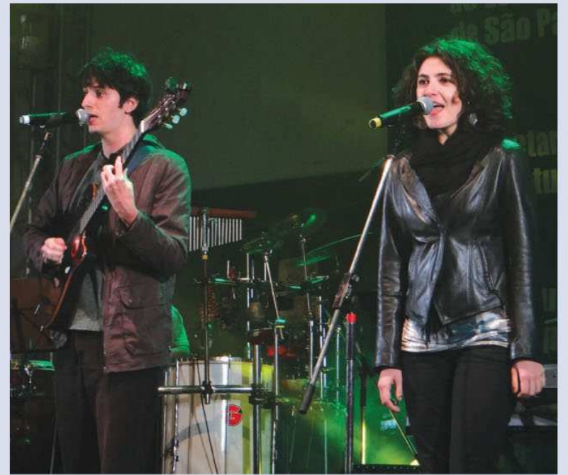
Aclamação Popular para Plano B