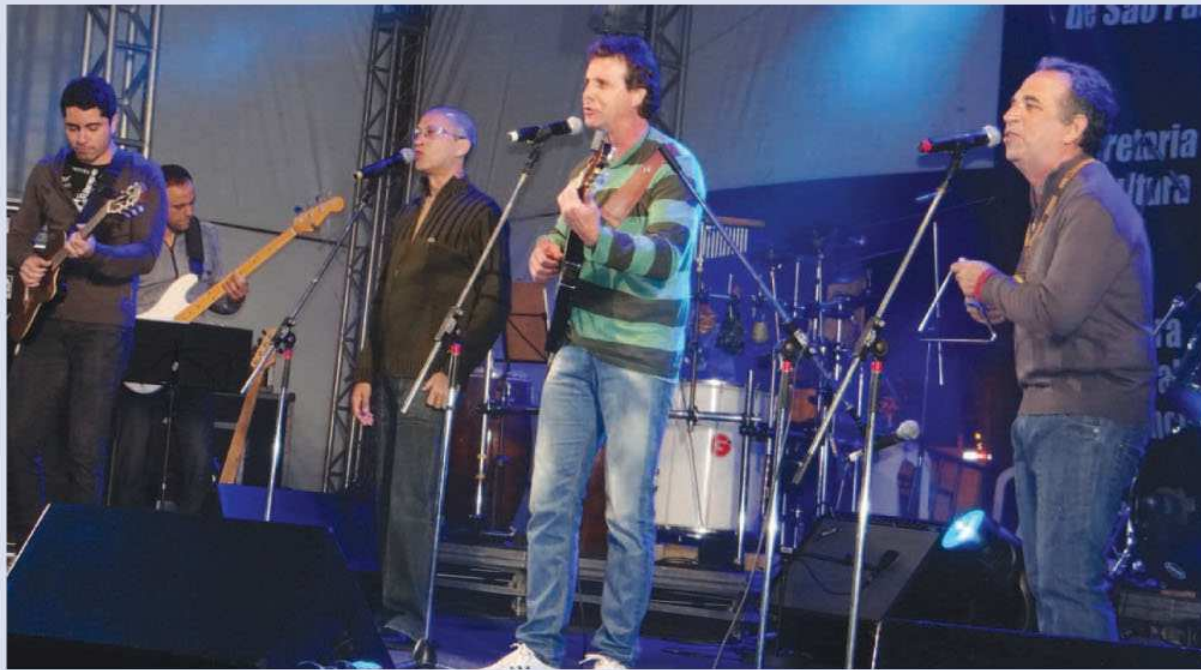
Terceiro Lugar para Pelos Cantos