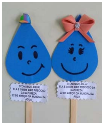
Arte do projeto

“A ideia foi treinar e demonstrar, ao público infantil, o quanto é relevante a formulação das perguntas e a manifestação de opiniões, diante de assuntos delicados. Além de incentivá-los a reconhecer suas próprias habilidades, produções, em seus múltiplos significados”, diz responsável.