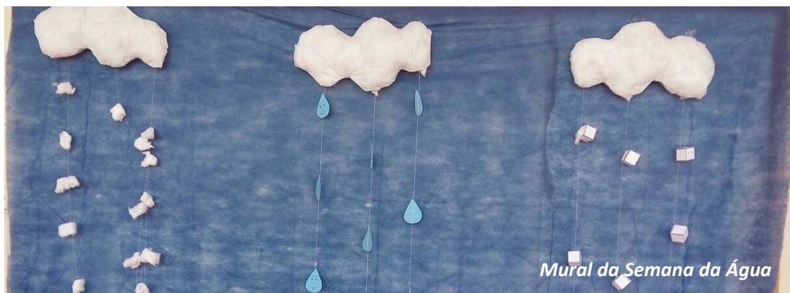
Mural da Semana da Água