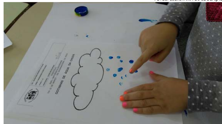
Gotinhas de água da chuva