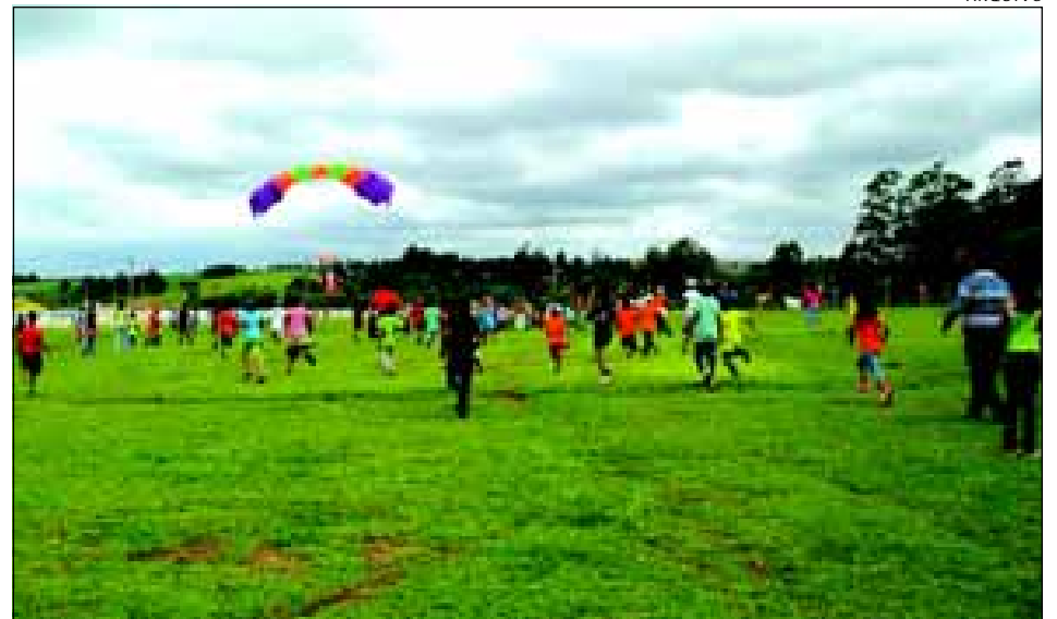
A chegada do Papai Noel de pára-quadras está prevista para às 10 horas da manhã.