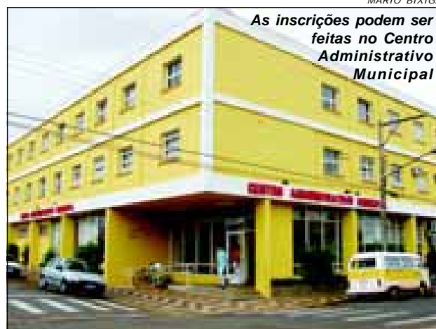
As inscrições podem ser feitas no Centro Administrativo Municipal

As inscrições para o concurso público da Prefeitura da Estância Turística de Avaré se encerram no próximo dia 27, onde estarão disponíveis 22 vagas para os cargos de: Auxiliar de Dentista (5 vagas), Auxiliar de Farmácia (5 vagas) e 12 para Professores de Educação Básica II, sendo 4 vagas para Educação Artística,