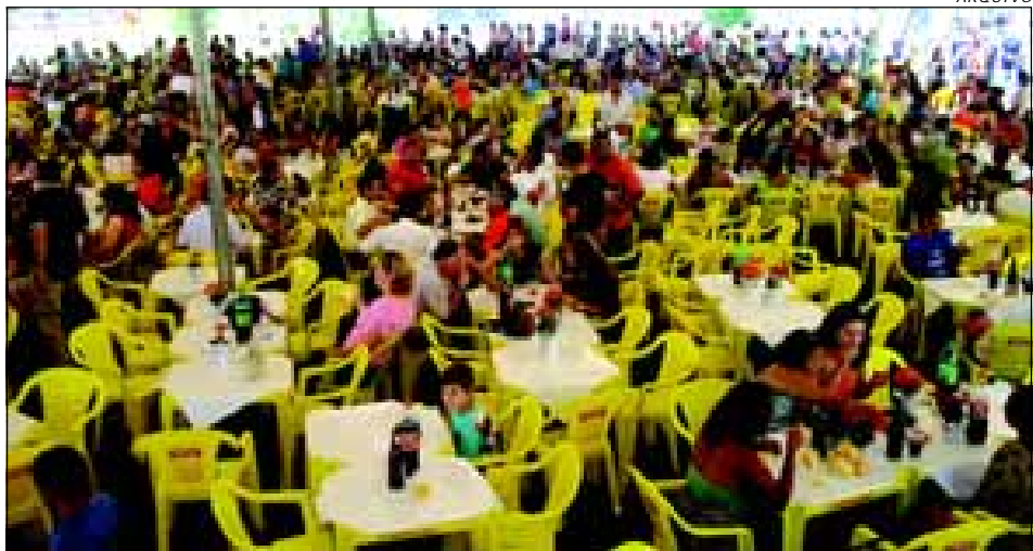
Todo ano a prefeitura realiza a festa de confraternização aos funcionários públicos

Os funcionários públicos da Prefeitura da Estância Turística de Avaré participaram de uma