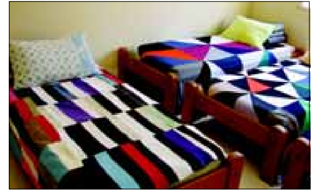
O objetivo é atender pessoas migrantes de passagem pela cidade para pernoite e alguns casos de Avaré, em situação de rua

em caso de reintegração familiar e social, encaminhamento em caso de internação através do Sistema Único de Saúde, encaminhamento para entidade de fornecimento de passagens, providências de medicamentos via farmácia da rede pública e privada, entre outros.