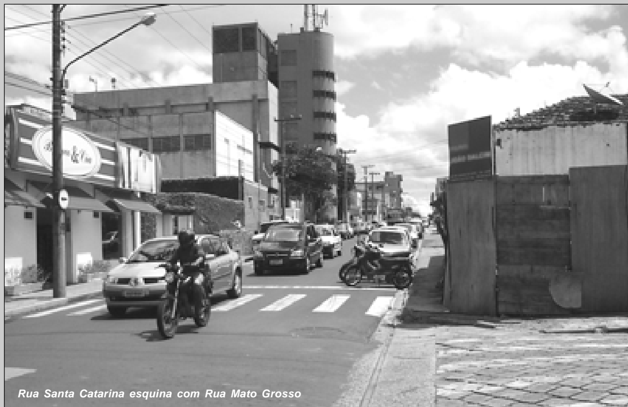
Rua Santa Catarina esquina com Rua Mato Grosso

SECRETARIA MUNICIPAL DOS TRANSPORTES E SISTEMA VIÁRIO DEMUTRAN - DEPARTAMENTO MUNICIPAL DE TRÂNSITO