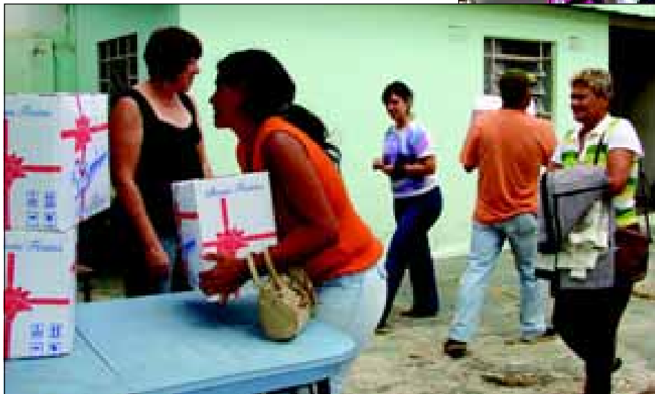
Foram distribuídas 3000 cestas de natal a famílias carentes cadastradas junto ao Fundo Social