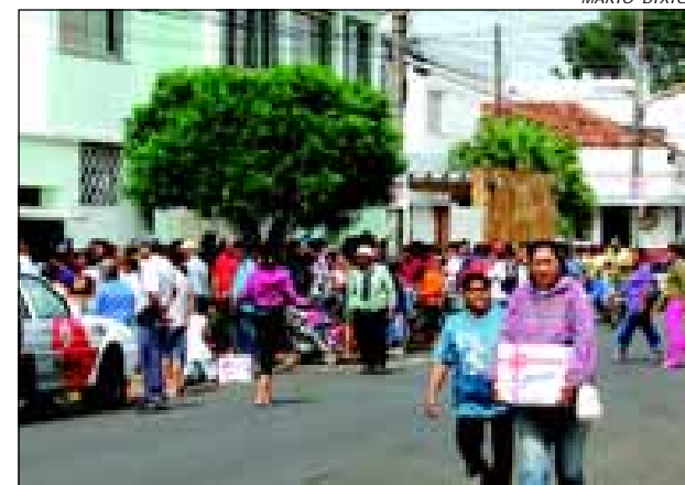
A Secretaria do Bem Estar Social entregou 3000 cestas de natal a famílias carentes cadastradas

A Prefeitura da Estância Turística de Avaré através da Secretaria Municipal do Bem Estar Social entregou durante