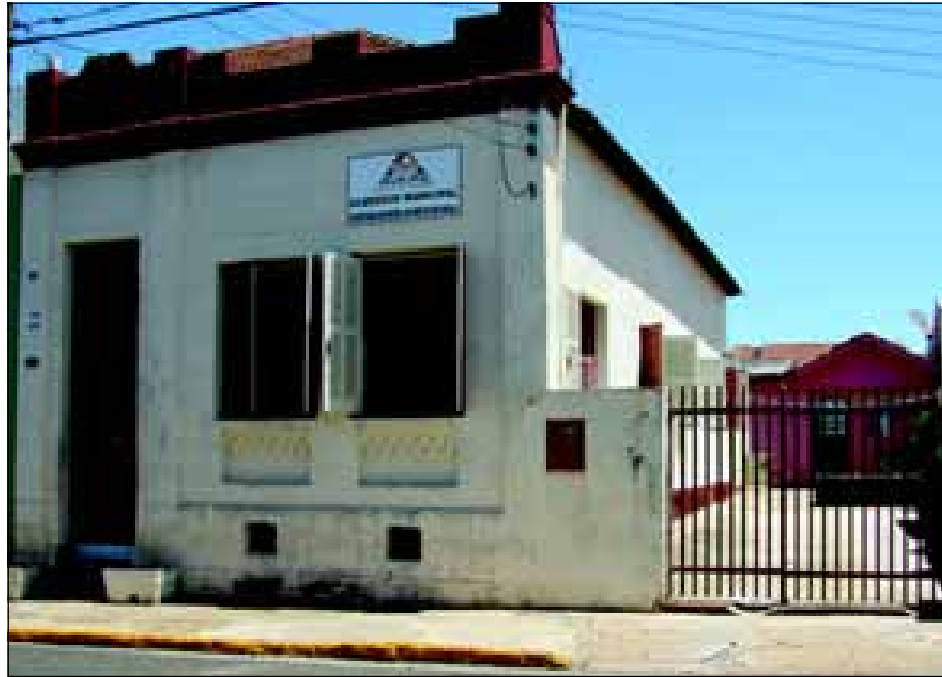
O Albergue Municipal está localizado a Rua Voluntários de Avaré, nº 1190

Os serviços prestados pelo Albergue Municipal obedecem ao seu regimento interno e são constituídos por ronda noturna, realizando triagem e acolhimento seguido de material e condi-