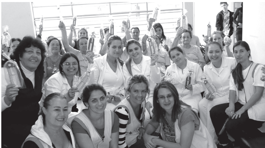
Comemoração realizada com a comunidade atendida pela USF II – Dr. Fernando Hirata no bairro Duílio Gambini

A Secretaria de Saúde parabeniza todas as enfermeiras pelo empenho e dedicação no atendimento à população. Em comemoração ao mês das Mães e à Semana da Enfermagem, ocorreram diversas atividades em unidades de saúde e também um seminário informativo às profissionais da enfermagem no antigo CAC.