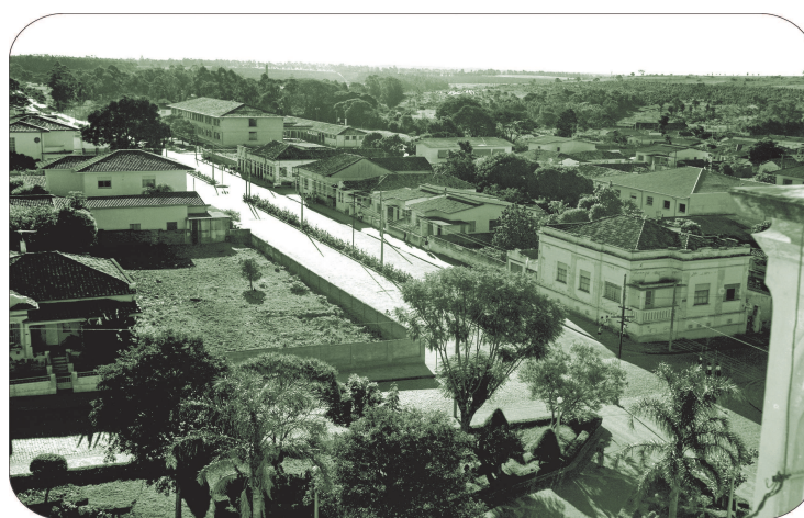
Panorâmica do trecho inicial da avenida, 1965