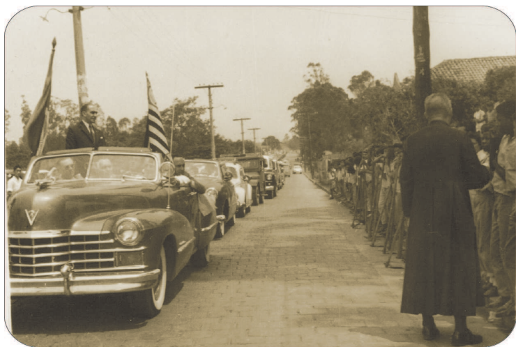
Governador Carvalho Pinto desfila de carro aberto pela Avenida Floriano Peixoto, 1961