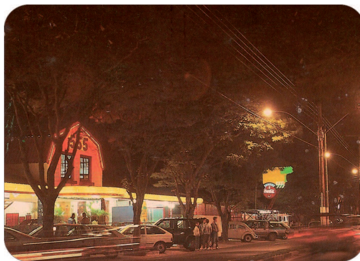
Aspecto noturno da avenida, 1995.