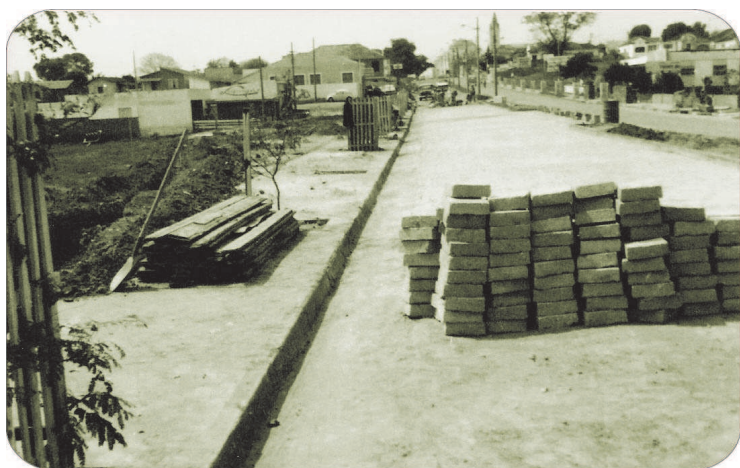
Avenida Paulo Novaes em obras, 1972

Respeitada liderança da União Democrática Nacional (UDN), Novaes elegeu-se vereador e presidiu a Câmara por três vezes, entre as décadas de 1940 e 1960. No mesmo período governou Avaré em duas gestões marcadas pela austeridade. Remodelou o paisagismo urbano, construiu a Concha Acústica, apoiou a realização da Emapa e criou a Faculdade de Ciências e Letras. Faleceu em 15 de janeiro de 1970.