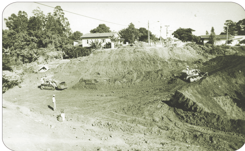
A Avenida Paulo Novaes, em obras, vista pelo mesmo ângulo em 1972 e na atualidade.

O mesmo historiador atribuiu a Edmundo Trench, intendente entre os anos de 1905 e 1911, a solução do problema: “Com sua visão de administrador, ele abriu, não uma rua, mas uma larga via pública”, então denominada de Avenida Floriano Peixoto,