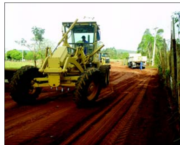
Trecho corresponde a parte da estrada até a Capela de Nossa Senhora Aparecida

Além da carreata também foram realizadas palestras nas escolas, com a participação de técnicos do Departamento Municipal de Trânsito e Polícia Militar. Foram mostrados vídeos e distribuído cartilhas para os alunos.