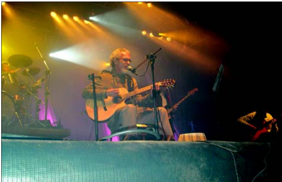
Show de Renato Teixeira