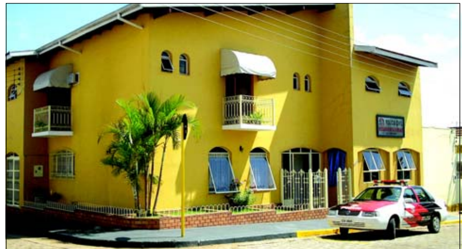
As novas instalações estão na Rua Mato Grosso, esq. com a Rua Sérgio Bernardino

ré tem feito um trabalho importantíssimo dando todo auxílio a mulher que sofre qualquer tipo de violência, seja ela física ou moral. Em média são registrados cerca de 120 ocorrências por mês. Além de ocorrência contra a mulher, a delegacia também atende casos de violência contra crianças e adolescentes.