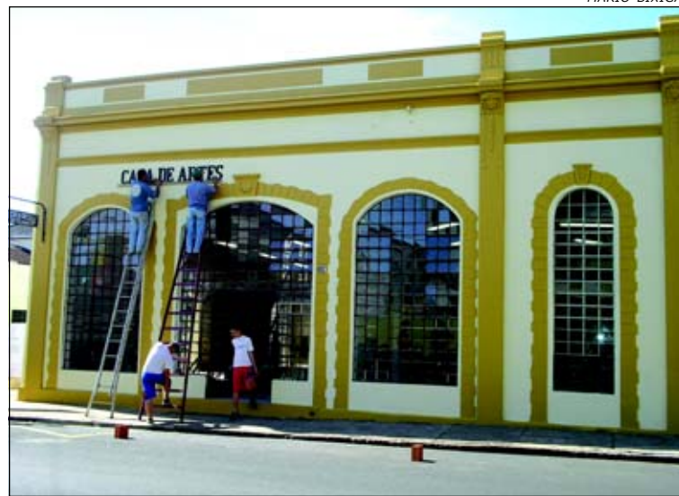
Casa de Arte e Artesanato contou com uma ampla reforma da parte elétrica

A inauguração acontece na sexta-feira (dia 29/09) às 17 horas do Teatro Municipal e às 17h30 da Casa da Agricultura.