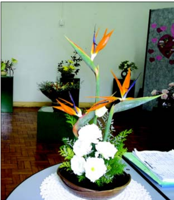
Exposição vai até o dia 2 de outubro