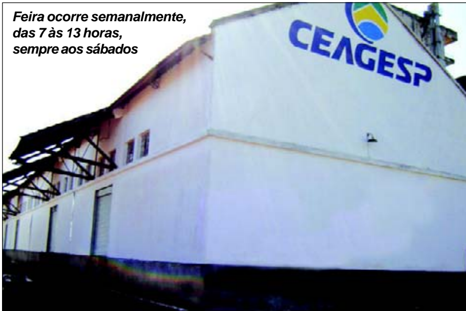
Feira ocorre semanalmente, das 7 às 13 horas, sempre aos sábados

São comercializados produtos hortifrutí, incluindo orgânicos, artesanato, flores, derivados do mel, enfim, todos os produtos oriundos da ativi-