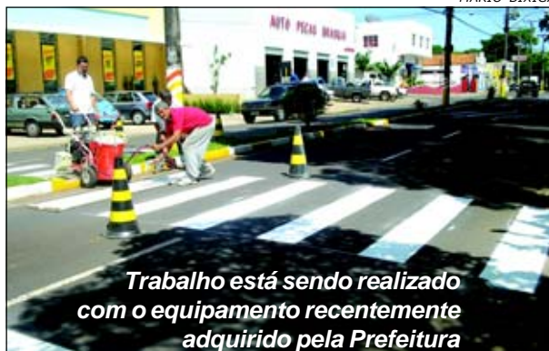
Trabalho está sendo realizado com o equipamento recentemente adquirido pela Prefeitura

equipamento próprio para a realização de tal trabalho, a Prefeitura, através do Departamento Municipal de Trânsito, está realizando a pintura das faixas de pedestres. Além disso o trabalho também está sendo realizado com a pintura das guias nos cruzamentos.