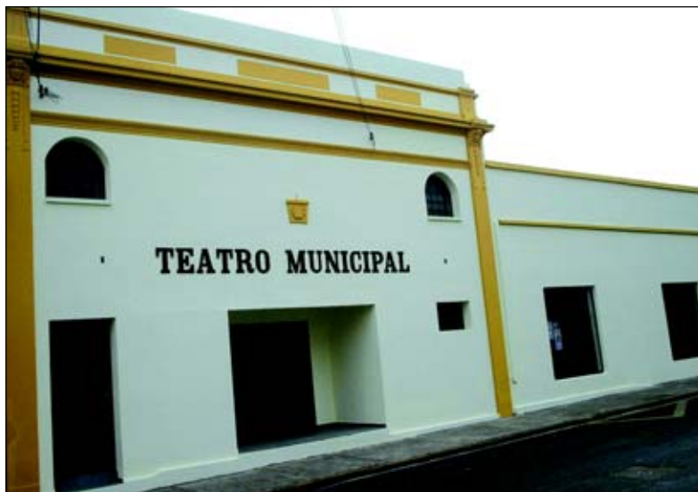
Teatro Municipal recebeu nova pintura e reforma dos camarins

A primeira fase do trabalho foi a colocação de piso. Na segunda etapa a Prefeitura providen-