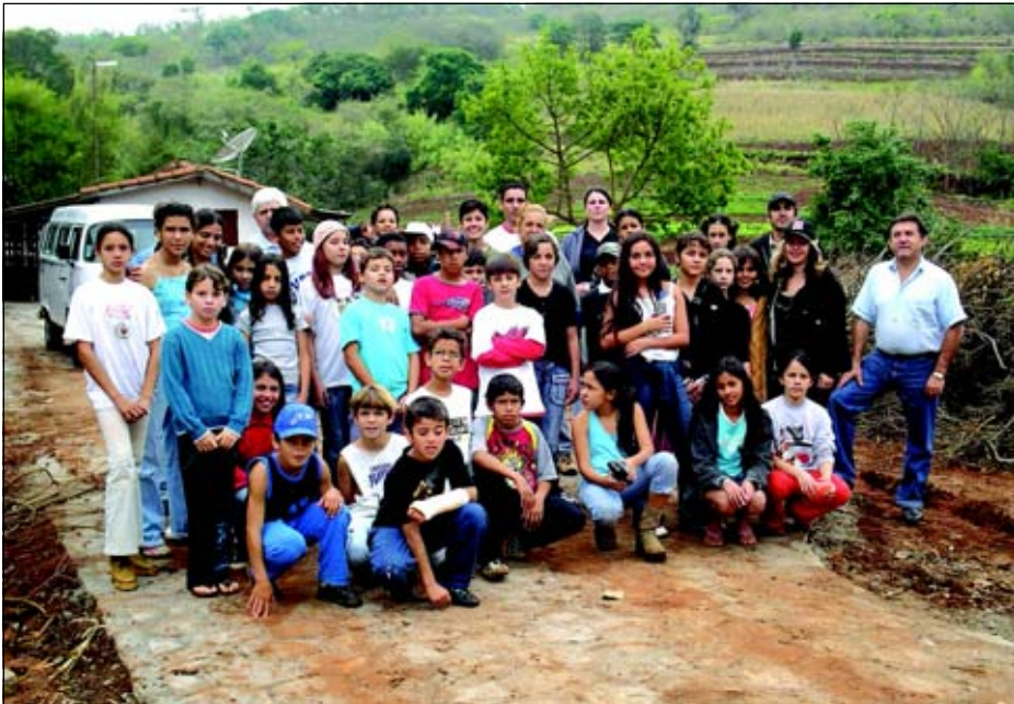
Participaram do passeio alunos da 4ª série da escola Professora Celina Duarte Bruno