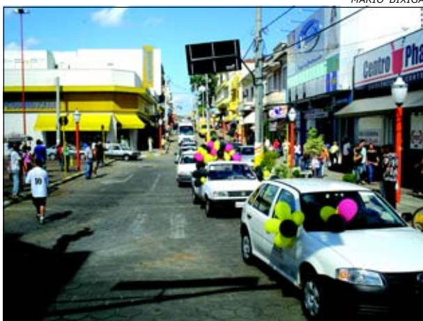
Carreata teve como objetivo chamar a atenção da população

Na última quinta-feira (dia 21/09) uma carreata pelas principais ruas da cidade, marcou a semana do trânsito. O objetivo é chamar a atenção da população sobre a importância de se ter cuidados no trânsito. Participaram da carreata veículos da Prefeitura, auto-escolas da cidade e motociclistas. O evento contou com o apoio da Polícia Militar.