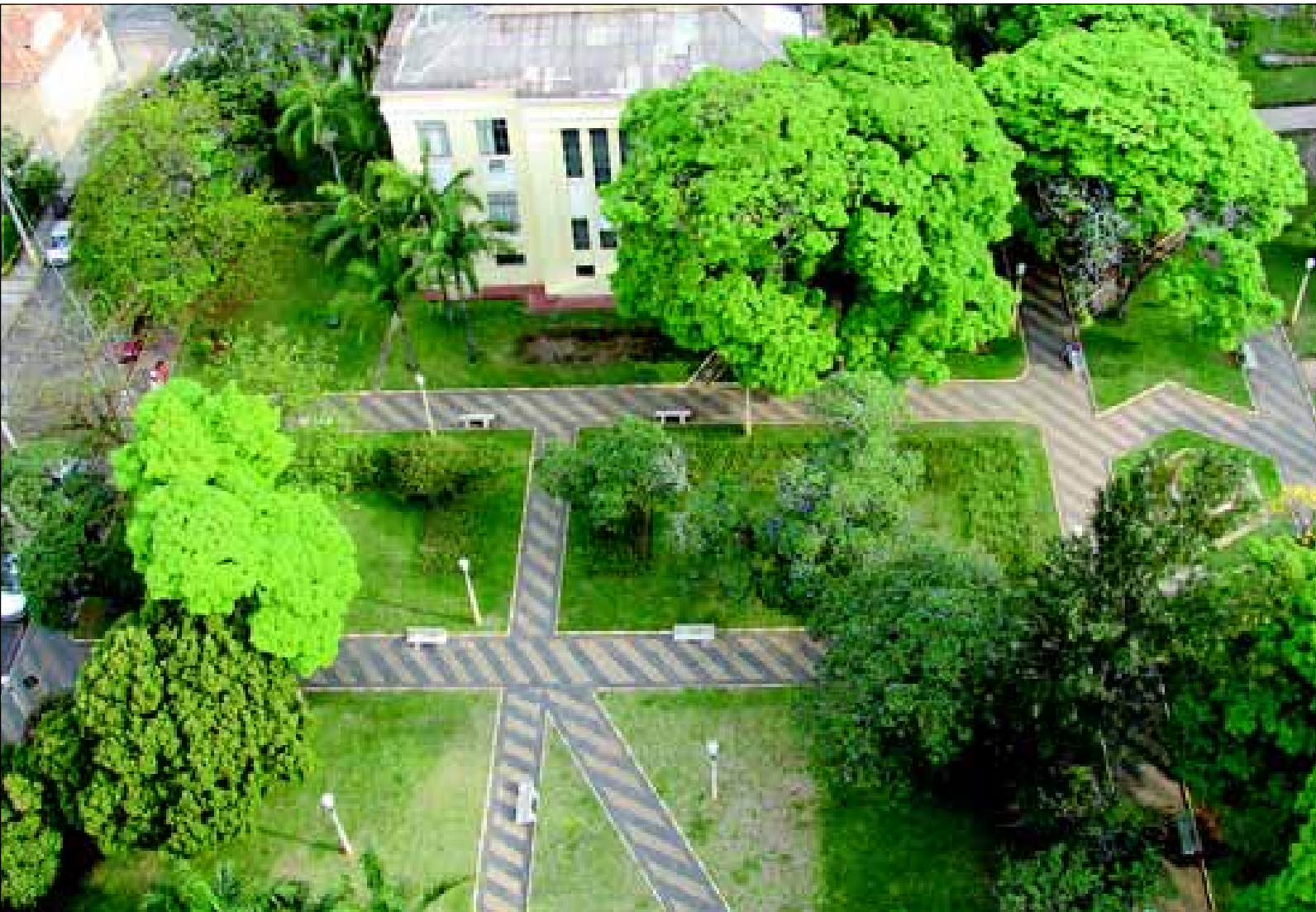
Praça Juca Novaes onde se localiza o Paço Municipal

Tradicionalmente conhecida como “Cidade de Jardim”, a Estância Turística de Avaré possui em sua área urbana, inúmeros espaços públicos urbanizados, compostos por áreas verdes, jardins, árvores de diversas qualidades, que oferecem a população, locais de lazer, descanso e pela sua beleza, na maioria das vezes integrada a prédios ou monumentos históricos, proporcionam inúmeros cartões postais de rara beleza.