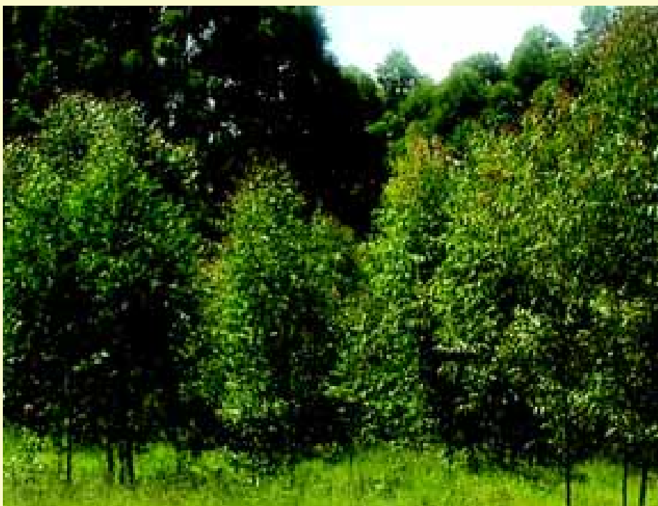
Plantação de Eucalipto