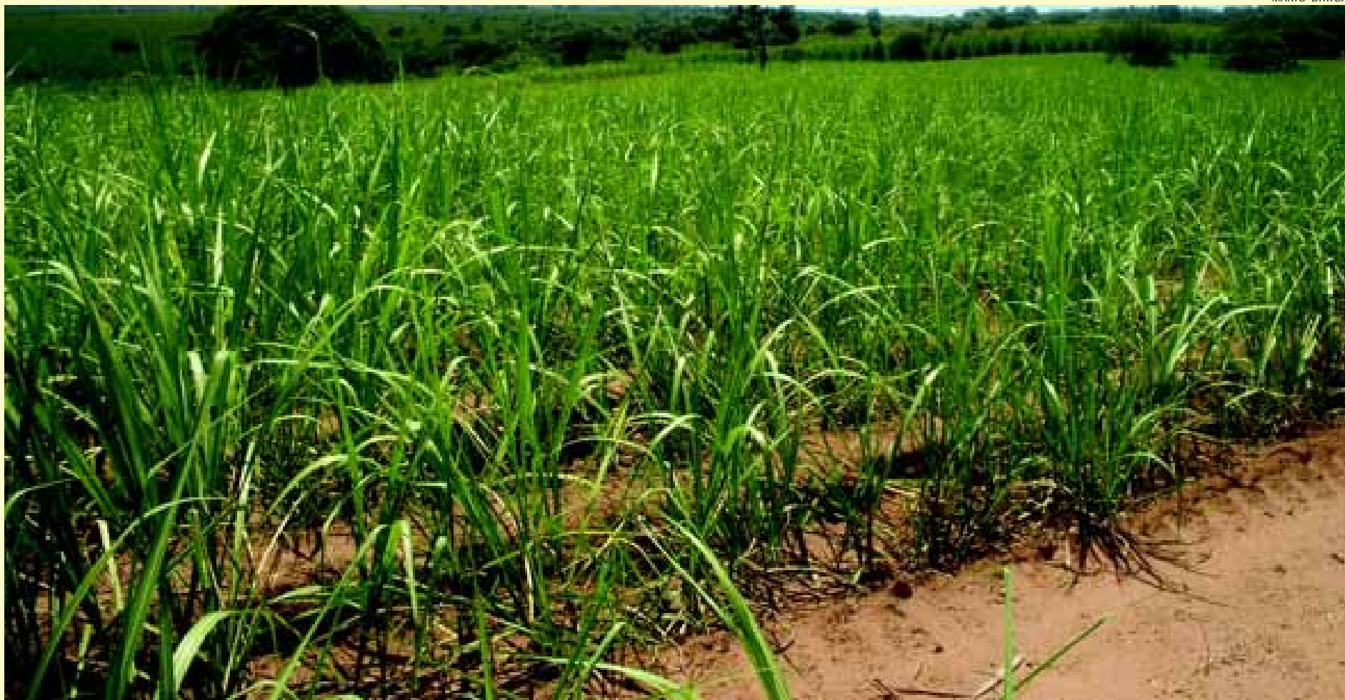
Plantação de cana-de-açúcar