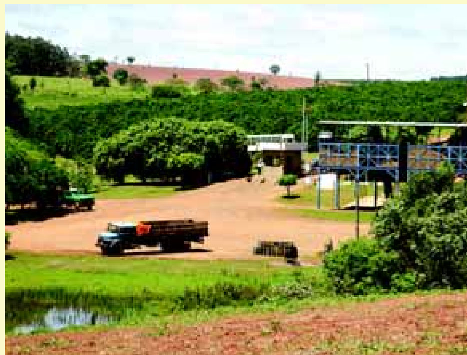
Plantação de Laranja

O Estado de São Paulo, vem se destacando dentro do contexto nacional nos investimentos dire-