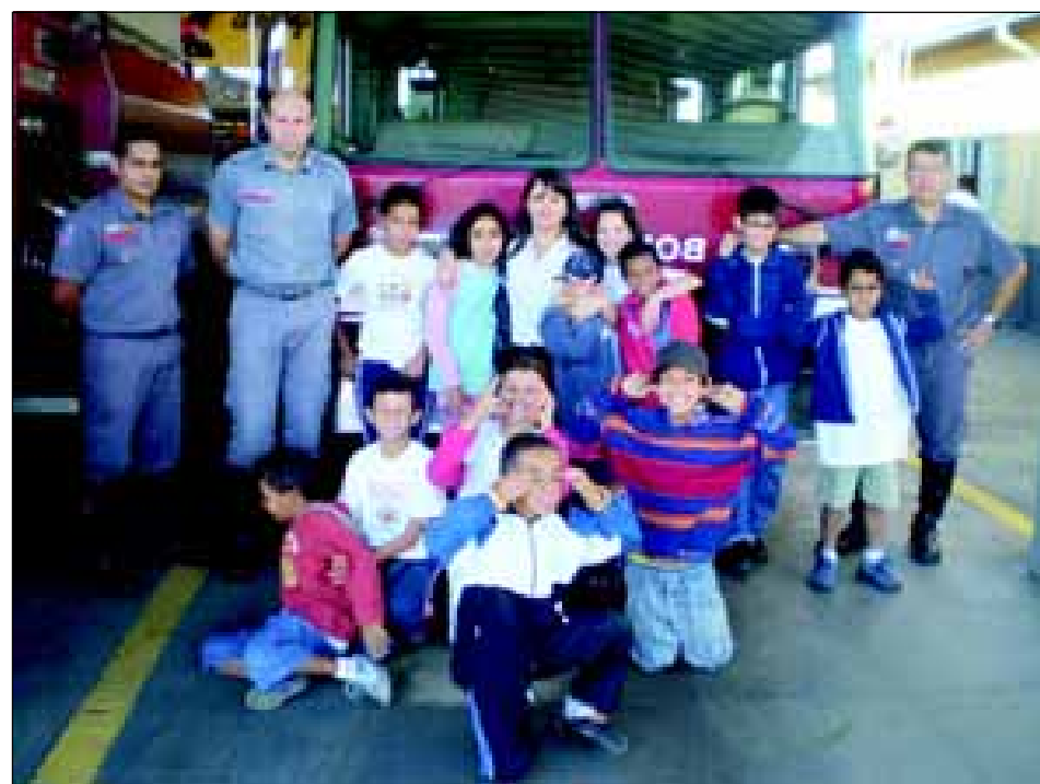
Os alunos do Nocaíja visitaram o Quartel do Corpo de Bombeiros onde assistiram palestra educativa

Dando continuidade ao Programa de Educação Ambiental do primeiro semestre no NOCAIJA – Núcleo de Orientação e Capacitação à Infância e Juventude de Avaré, neste mês, os alunos do período da manhã