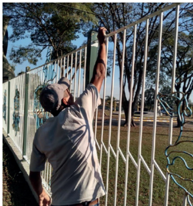
Pintura das grades do Parque de Exposições

Por sua vez, a Secretaria de Serviços recupera as instalações dos dois portais de boas vindas à cidade, os quais se localizam em pontos estratégicos. Um está instalado na Rodovia SP 255, próximo da área urbana e o outro no início da Avenida Paulo Novaes, junto ao trevo de acesso à região central. Nova pintura e substituição de lâmpadas estão sendo providenciadas pelas equipes.