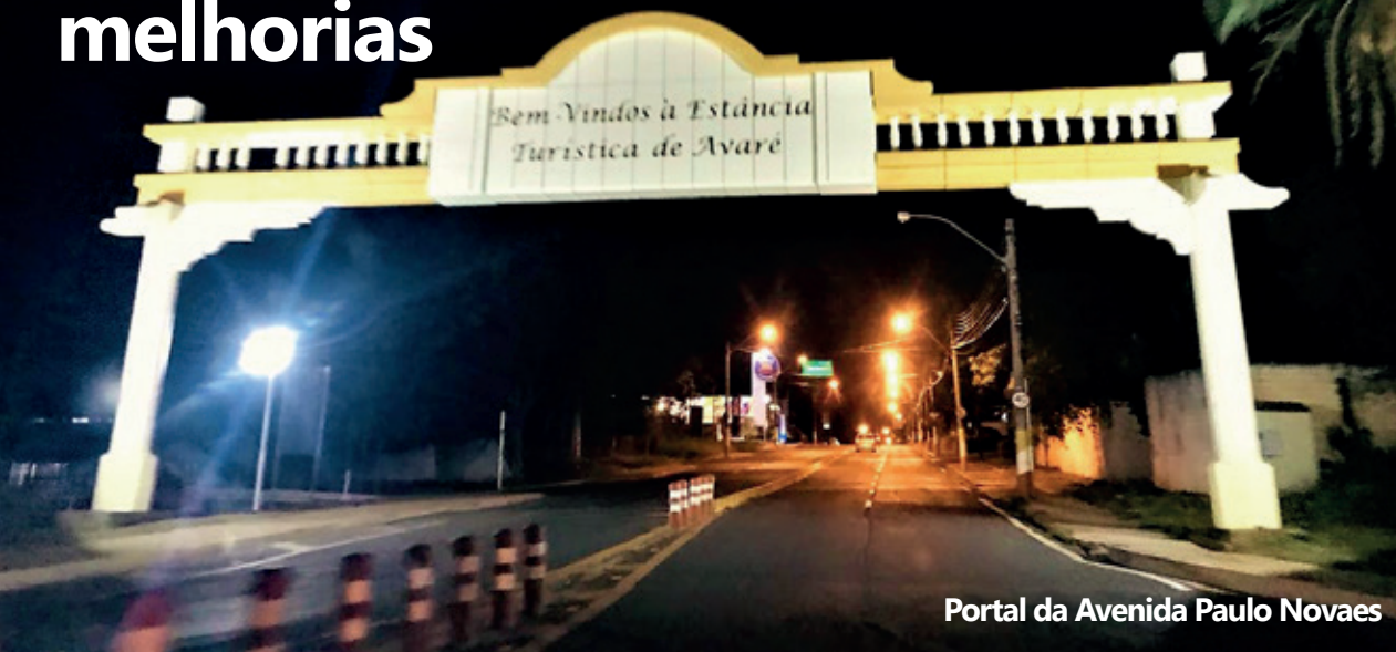
Portal da Avenida Paulo Novaes