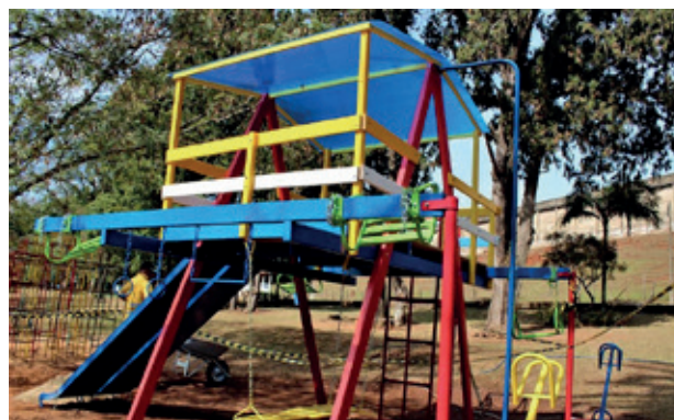
Instalação de Parque infantil no Horto