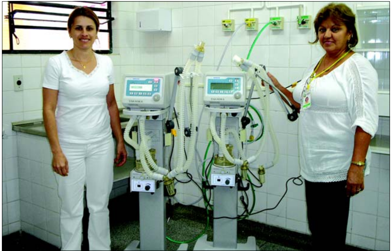
Ventilador Pulmonar foi entregue no Pronto Socorro

A entrega destes aparelhos mostra a preocupação do Governo Municipal em bem atender o setor de saúde do município.