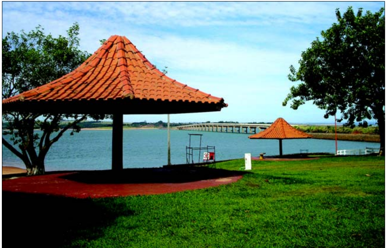
Melhorias nos pontos turísticos é uma das preocupações da Prefeitura

das vias internas do Camping Municipal. O projeto faz parte de uma parceria entre a Prefeitura da Estância Turística de Avaré e o Governo Federal. Desta forma, todas as vias internas do Camping Municipal, que não possuem tal melhoria, receberão a pavimentação. Página 7.