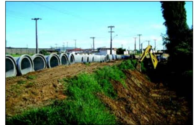
Tubulação fará a captação das águas pluviais

A Prefeitura da Estância Turística de Avaré iniciou os trabalhos para a implantação de tubulação na Avenida Cunha Bueno. O local estava enfrentando sérios problemas com o acúmulo de água. Toda chuva uma grande quantidade de água acumu-