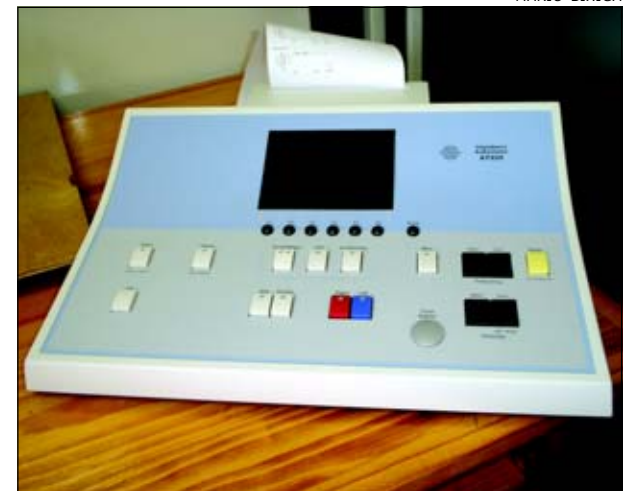
Aparelho possibilitará a realização de uma série de exames

O convênio será benéfico para várias pessoas, pois atualmente muitos têm que se deslocar a outras cidades para a realização do exame.