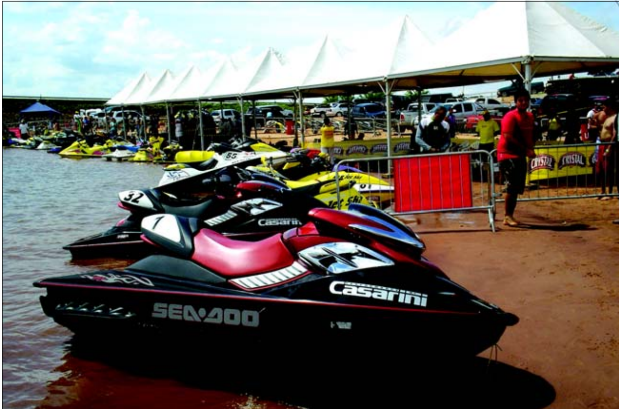
Evento contou com grande infra-estrutura

De acordo com os organizadores, a expectativa é de que no próximo ano Avaré possa voltar a sediar a etapa final do Brasil Open de Jet Ski, isso pela estrutura fornecida pela Prefeitura e pela boa aceitação do público.