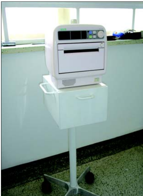
Cardiotacógrafo Portátil será utilizado na maternidade da Santa Casa