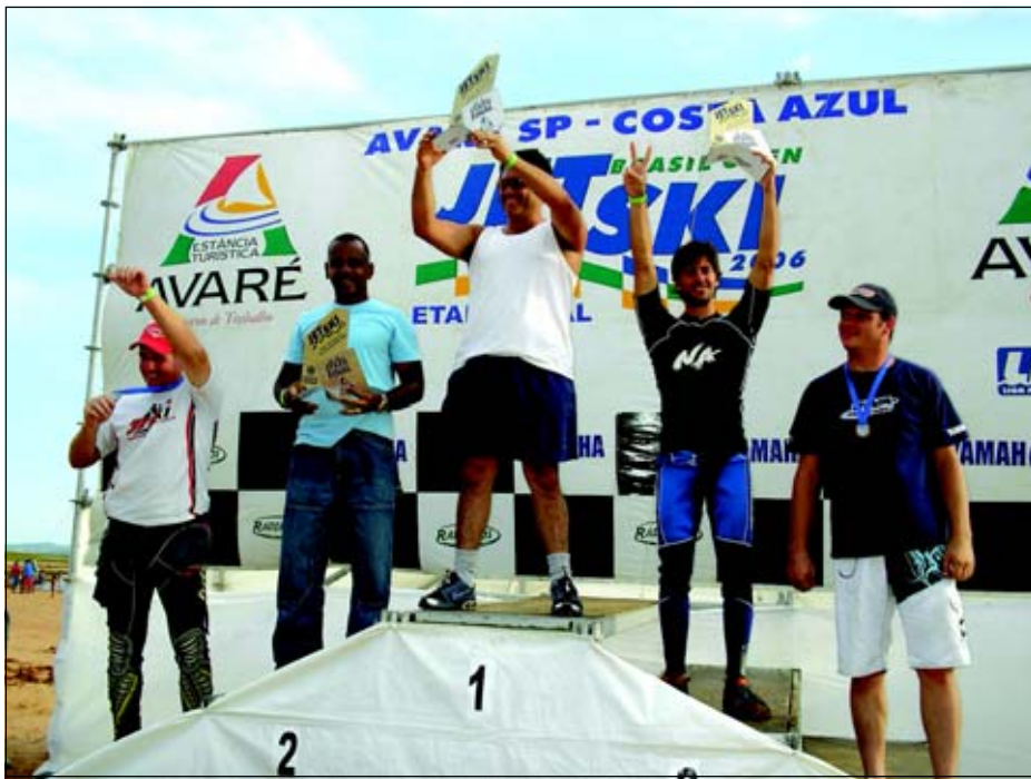
Pilotos de todo país participaram das provas