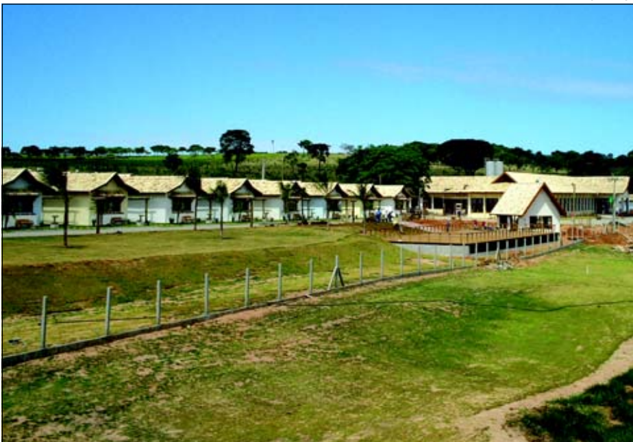
Colônia de férias trará mais turistas e empregos para Avaré