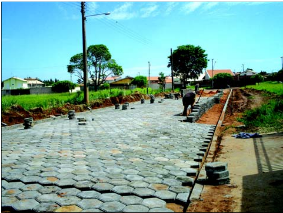
Rua Sérgio Gonçalves Chadad recebe pavimentação

A Prefeitura da Estância Turística de iniciou os trabalhos para pavimentação de trecho da Rua Sérgio Gonçalves Chadad, no Bairro Colina da Boa Vista.