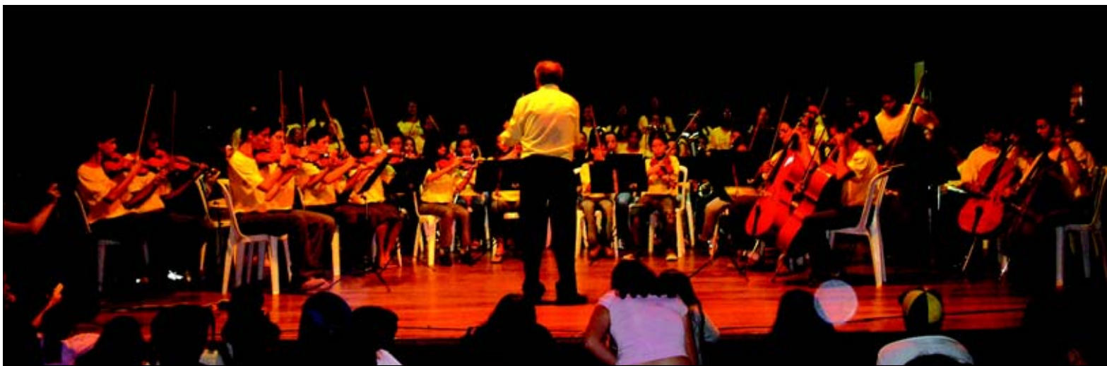
Apresentação aconteceu no Teatro Municipal

Na última quarta-feira (dia 8/11) os integrantes do Projeto Guri realizaram a primeira apresentação ao público. O evento aconte-