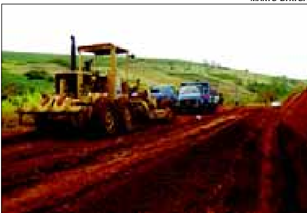
Obra está recuperando um trecho de 4.700 metros

Com objetivo de melhorar o escoamento das safras e dar mais qualidade de vida da comunidade que mora no bairro rural dos Rochas, a estrada vicinal AVR 040 está sendo readequada tecnicamente. A obra é executada através de convênio entre a Prefeitura da Estância Turística de Avaré, Banco Mundial, Governo do Estado de São Paulo, Secretaria de Estado de Agricultura e Abastecimento (SAA), EDR/CATI/Avaré por