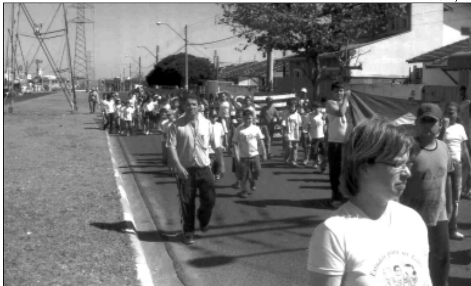
SECRETARIA DE EDUCAÇÃO

O desfile foi realizado pelas ruas do Bairro Vera Cruz e teve como objetivo enfatizar o valor patriótico e o dever cívico, comemorando o Dia da Independência do Brasil.