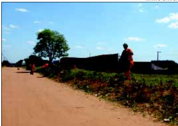
Trabalhadores chegaram a coletar mais de 5 toneladas de lixo em um único dia

A equipe de limpeza da Prefeitura da Estância Turística de Avaré está realizando periodicamente arrastão para a limpeza dos bairros da cidade. O trabalho é mais intensificado nos bairros onde não há calçamento e onde o número de terrenos baldio é grande.