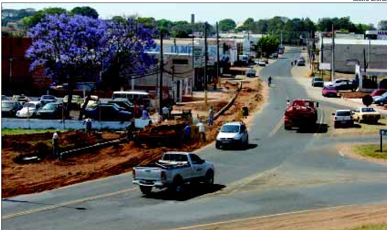
Obras estão sendo executadas no principal acesso da Zona Sul

A readequação também proporciona um novo aspecto urbanístico, proporcionando novos investimentos no local que também é um importante centro comercial ativo e dinâmico.