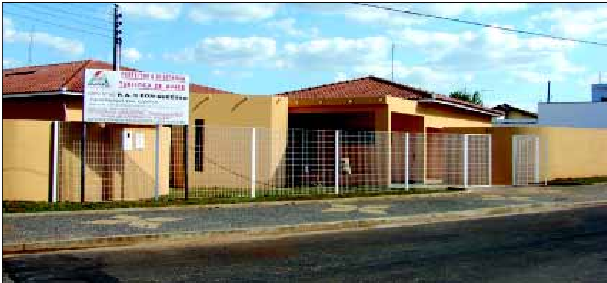
PAS atenderá população do Bonsucesso e bairros adjacentes

No último dia 14 de setembro, véspera do aniversário de 146 anos de Avaré, a Prefeitura fez a entrega do prédio do Posto de Atendimento de Saúde (PAS) do Bairro Bonsucesso. Depois de muito tempo paralisada, a Prefeitura retomou a obra e ago-