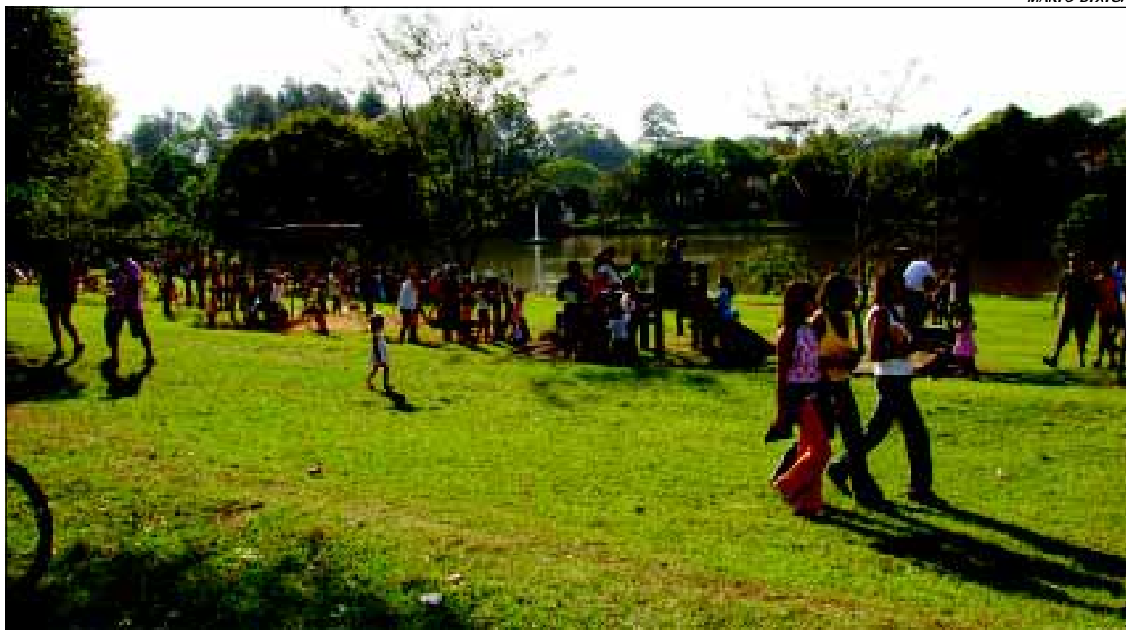
Evento será realizado no Horto Florestal

O evento conta ainda com o apoio do Horto Florestal.