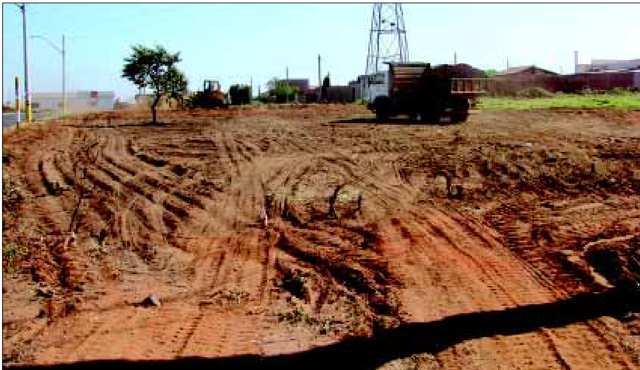
Obra trará mais melhorias para o bairro

A Prefeitura vem investindo bastante no Bairro Jardim Santa Mônica, onde está construindo uma escola e em 2005 executou o asfaltamento da Rua Maria Joaquina Fonseca Pereira.