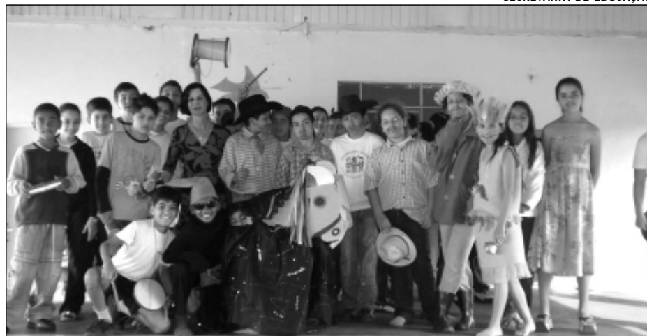
SECRETARIA DE EDUCAÇÃO

Foram realizadas diversas atividades, além de apresentação de mesa com pratos típicos, exposições de