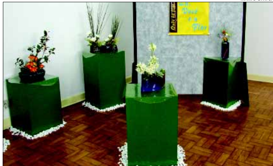
Exposição vai até o dia 29 de setembro

A palavra Ikebana é a união de dois ideogramas: IKE = dar vida, BANA = flor. É a