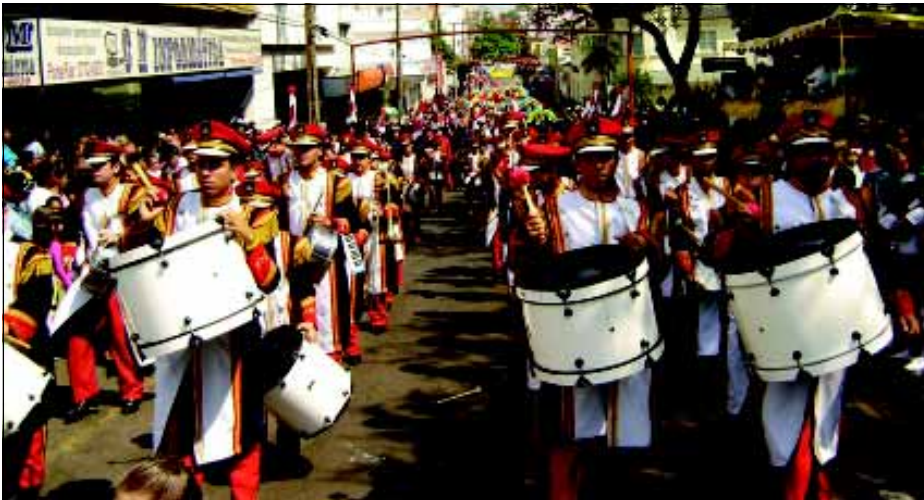
Evento faz parte das comemorações dos 146 anos de Avaré

Nos dias 15 e 16 de setembro Avaré estará sediando a final do Campeonato Estadual de Fanfarras e Bandas. O evento faz parte das comemorações dos 146