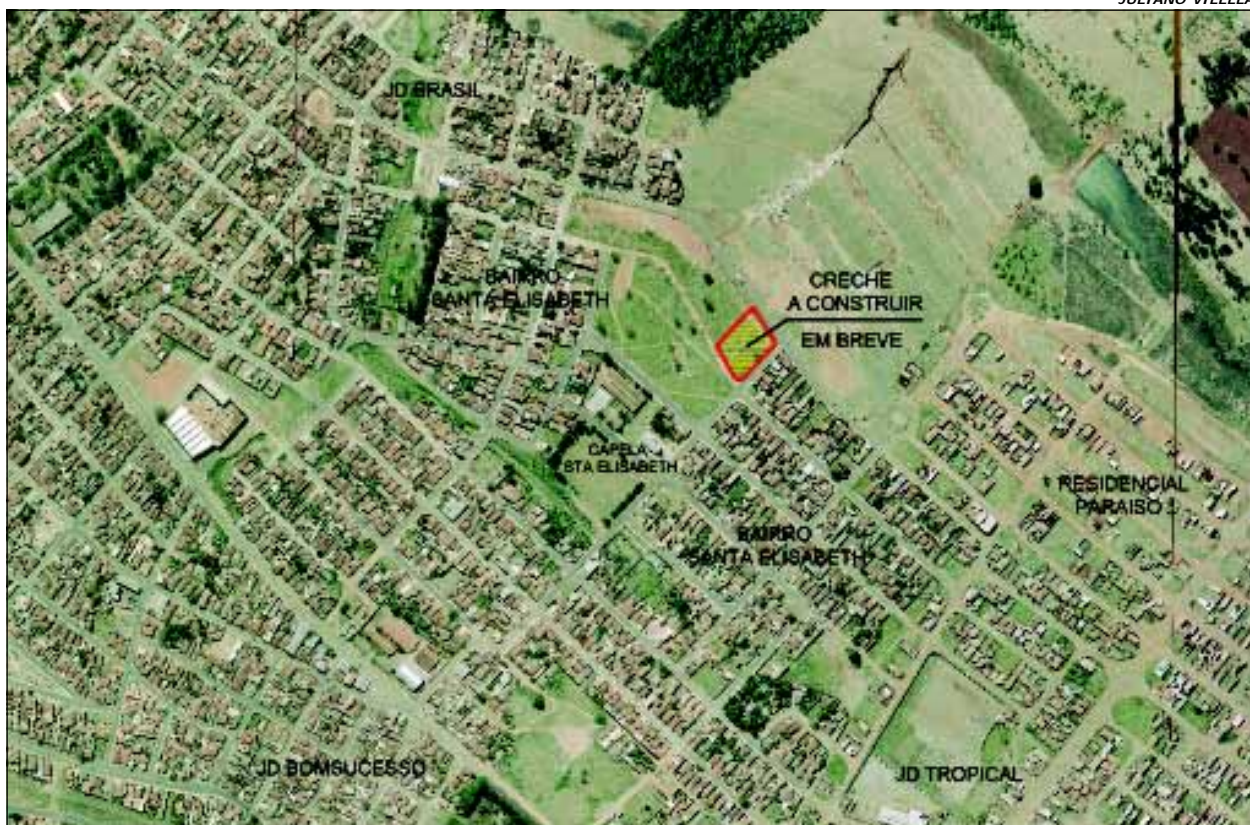
Creche beneficiará os bairros Santa Elizabeth, Paraíso, Tropical e Jardim Brasil

Mesmo acabando de entregar uma creche no Bairro Plimec, a Prefeitura da Estância Turística de Avaré já está se empenhando para a construção de outra no Bairro