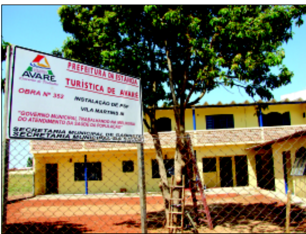
Novo PSF funciona na Rua Nicola Pizza

Avaré recebeu mais uma unidade do Programa Saúde da Família (PSF). No último dia 14 de setembro, a Prefeitura da Estância Turística de Avaré inaugurou a unidade do PSF na Vila Martins. Essa é a quinta unidade do programa que também atenderá moradores dos bairros Plimec e Bonsucesso II.