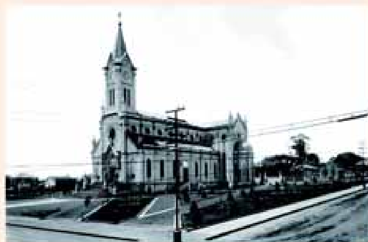
Igreja matriz de Avaré em foto de 1936