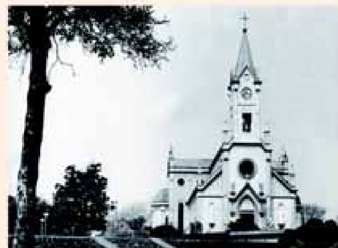
O atual santuário em registro fotográfico de 1969