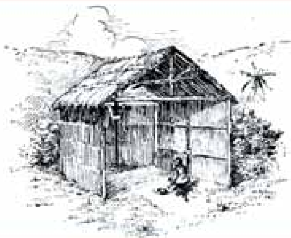
Santa Cruz, coberta de taquara (1862), bico de pena de Augusto Esteves

em Portugal, de onde veio e foi largamente difundida em terras mineiras.