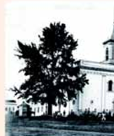
Primeira igreja matriz de Avaré