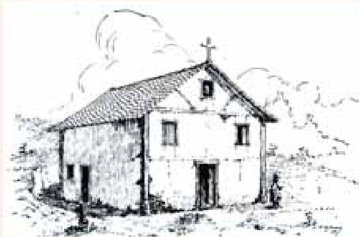
Rio Novo - Capela do Major (1864)