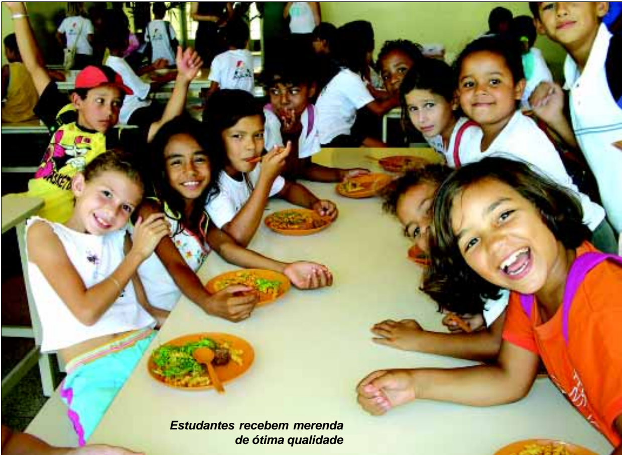
Estudantes recebem merenda de ótima qualidade

Hoje a Prefeitura da Estância Turística de Avaré atende 19 mil alunos em toda a rede pública de ensino com a merenda escolar de excelente qualidade. Além dos 8 mil alunos que estudam na rede municipal no ensino infantil, fundamental e ensino de jovens e adultos, a Prefeitura de Avaré atende ainda 11 mil estudantes da rede pública estadual.