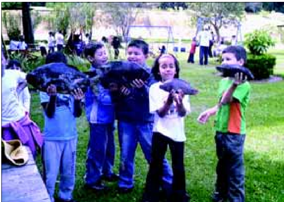
Crianças tiveram contato de perto com os animais

Os alunos das 1ª Séries da Escola Municipal José Rebouças de Carvalho participaram do Projeto “Pescador Encantado”. No encerramento deste projeto as crianças realizaram