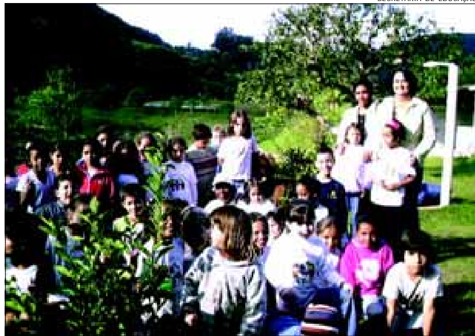
Visita faz parte do Projeto “Pescador Encantado”

e escrita de maneira dinâmica e contextualizada. Além do passeio ao Pesqueiro as crianças ainda tiveram trabalho dentro da sala de aula, onde foram desenvolvidas várias atividades com