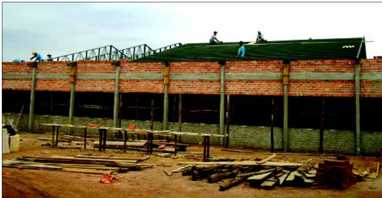
Escola contará com toda estrutura necessária

Continuam os trabalhos para a construção de nova escola municipal no Bairro Santa Mônica. A obra, executada pela Prefeitura da Estância Turística de