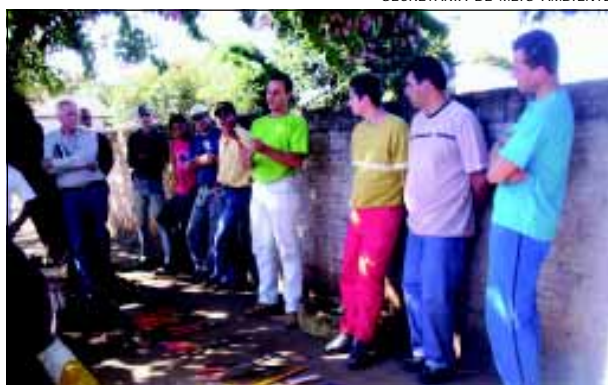
Curso habilita profissionais para executar o serviço

A Prefeitura da Estância Turística de Avaré realizou no último dia 25 de maio o curso de poda em árvores. O curso foi dirigido a todo profissional que trabalhe com poda de árvores em locais públicos, como funcionários da Prefeitura, CPFL, Bombeiros e profissionais liberais. No total participaram 45 pessoas, sendo 15 delas, funcionários da Prefeitura que trabalham na área.