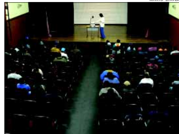
Funcionários receberam orientações sobre diversos assuntos

O Departamento de Recursos Humanos da Prefeitura da Estância Turística de Avaré, realizou no último dia 31 de maio, uma reunião com os funcionários municipais admitidos no período de julho de 2006 a março de 2007.