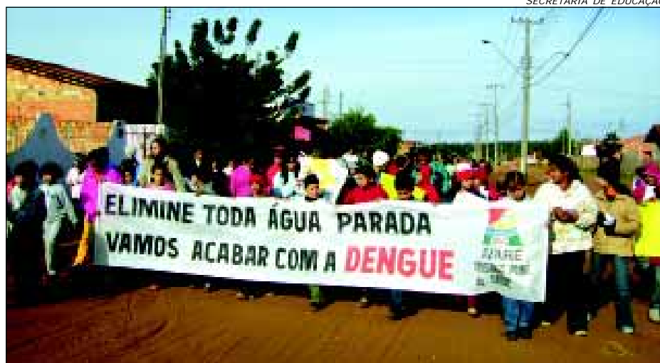
Passeata foi realizada por alunos da Escola Carlos Papa