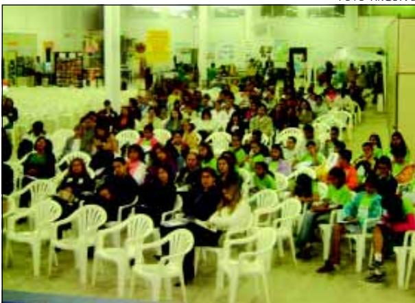
Na primeira edição do Fórum participaram diversas entidades

No próximo dia 12 de junho será realizado em Avaré o II Fórum de Educação Ambiental e Integração Regional. O evento acontecerá durante todo o dia, a partir das 9 horas da manhã, no