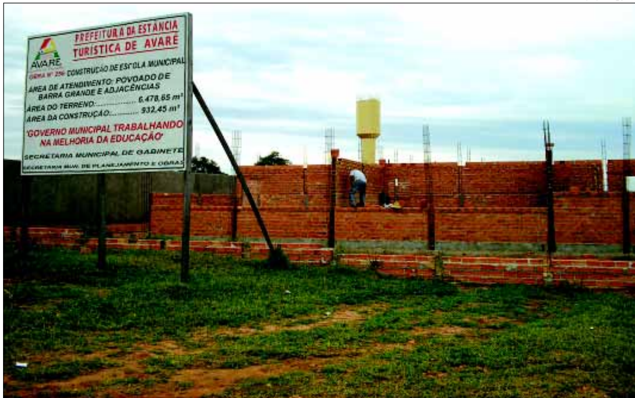
Escola beneficiará crianças do Povoado de Barra Grande

O curso é necessário, pois através de decreto, a poda de qualquer árvore em local público precisa ser feita por profissional capacitado. O curso capacita o profissional para a tarefa.