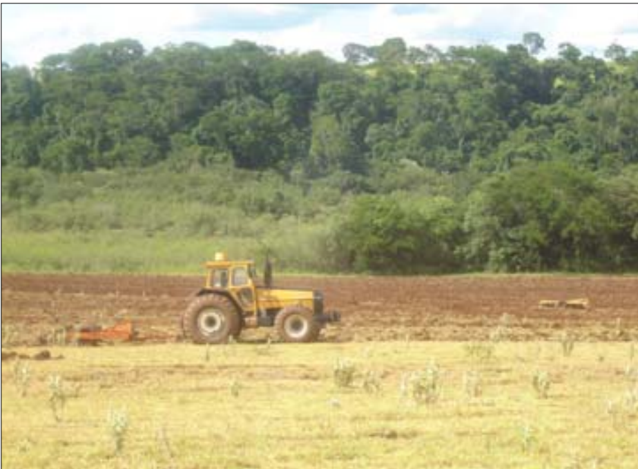
Solo sendo preparado para o plantio da cana

Além da geração de empregos, o orçamento