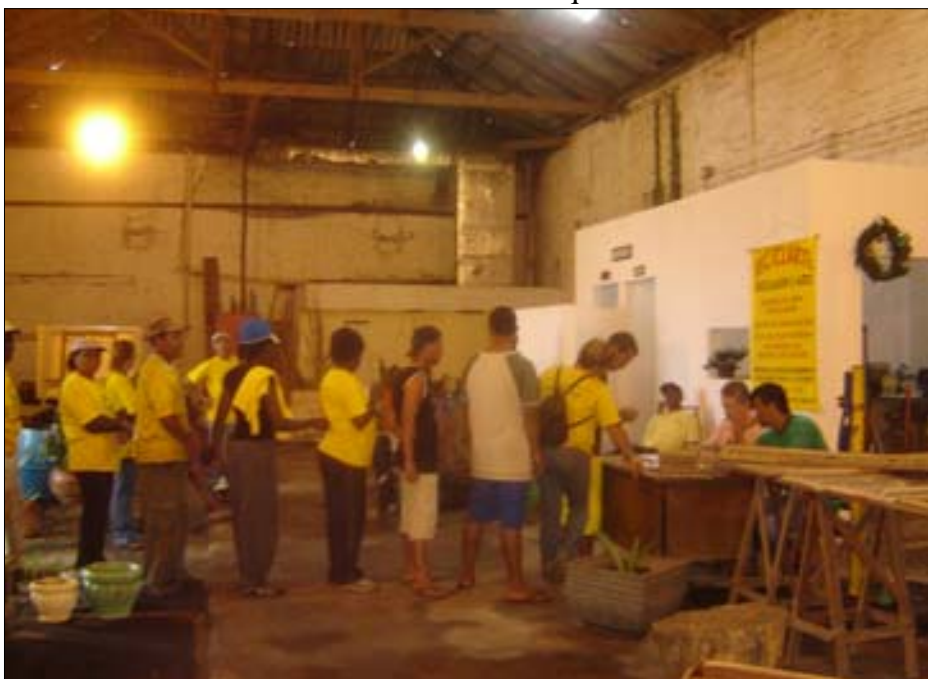
Pagamento da primeira parcela foi efetuado na última quinta-feira

todos separem o material reciclável e depositem em frente sua casa nos dias em que os coletores estiverem passando. É muito simples colaborar. Basta colocar uma caixa e toda vez em que for jogar fora papel, vidro, plástico, etc, basta colocar nesta caixa. É um lixo que não junta moscas, não tem mau cheiro e não faz mal a saúde. Basta um simples gesto que estará colaborando, não só com a geração de renda para essas famílias, mas também estará ajudando a melhorar o meio ambiente.