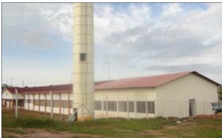
A Escola que já conta com oito salas de aula,