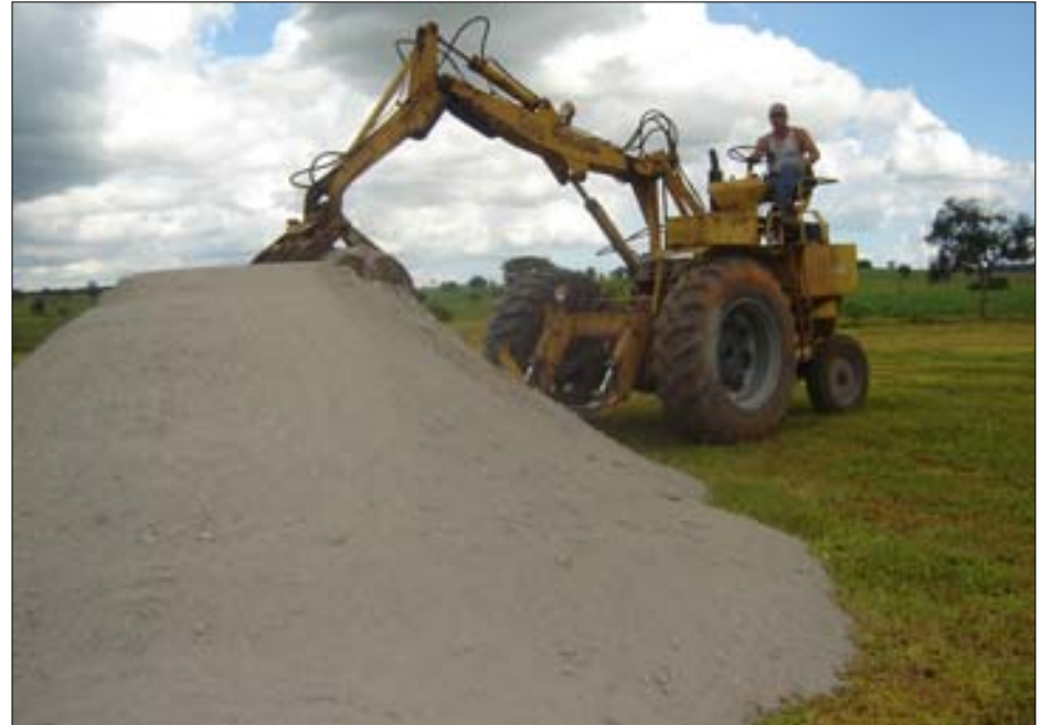
Além da geração de empregos, o orçamento do município deverá crescer mais de 30%

do município deverá crescer mais de 30% só com o ICMS arrecadado. Além disto, outras empresas do segmento de cana de açúcar deverão vir para Avaré.