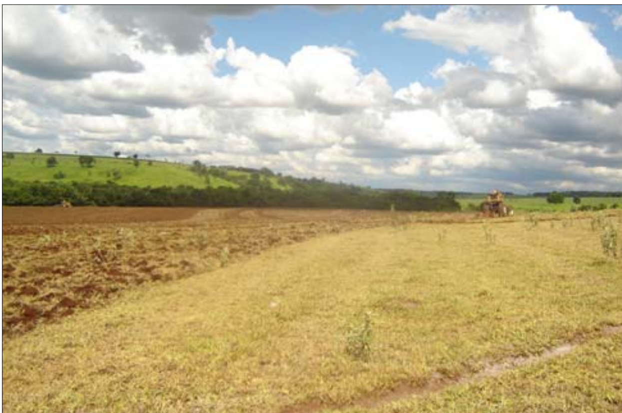
Local que será utilizado para o plantio da cana-de-açúcar

A usina de álcool e açúcar pertencente a família Furlan, que deverá se instalar em breve em Avaré, deverá gerar mais de 2 mil empregos diretos e indiretos.