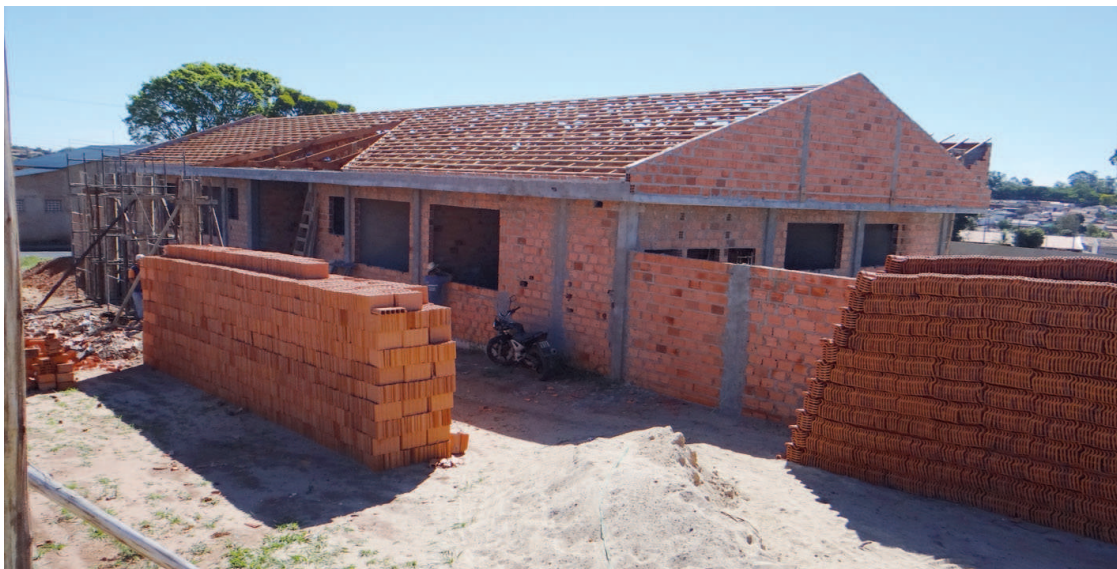
UBS em construção do Bairro Santa Elizabeth

Investimento em novos prédios vão melhorar a infraestrutura de atendimento à população