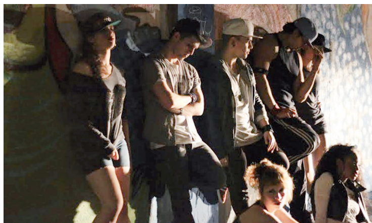
Cia de Dança TF Style