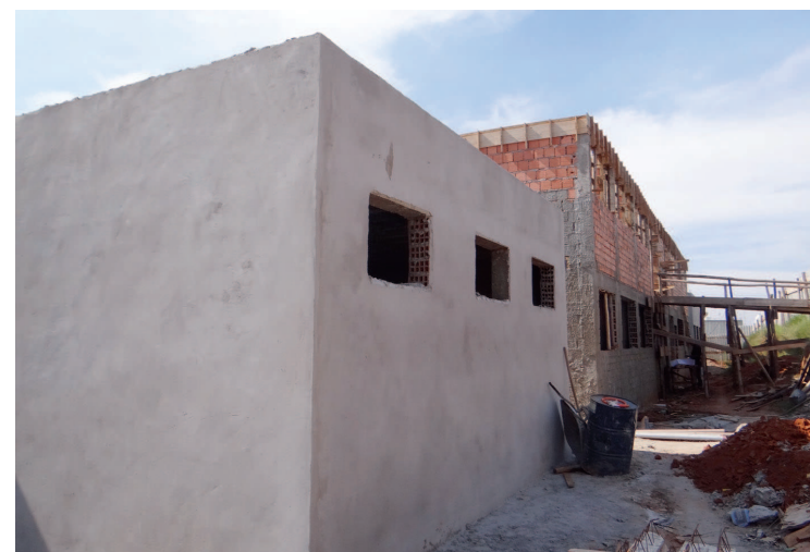
Futura Unidade de Pronto Atendimento (UPA)

Os novos prédios, pacientes e profissionais da saúde serão beneficiados com espaços apropriados para consultas. O mais importante é que a Prefeitura deixará de alugar imóveis para prover a assistência de saúde nos bairros. Assim o município oferecerá atendimento em prédios padronizados pelo Programa Saúde da Família, do