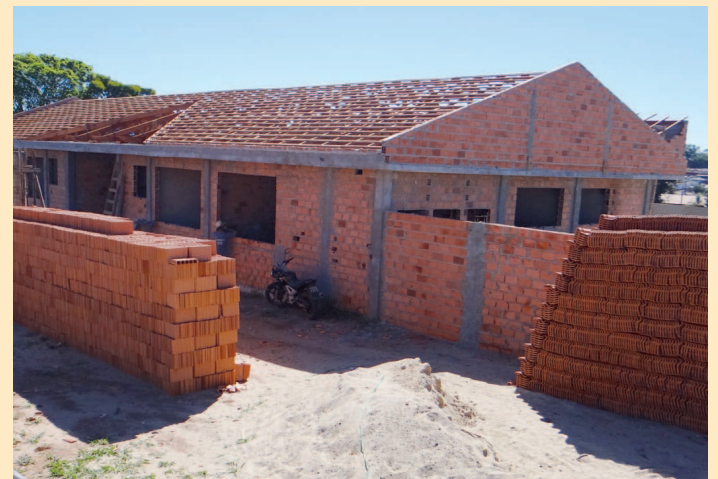
Posto em construção do Bairro Santa Elizabeth