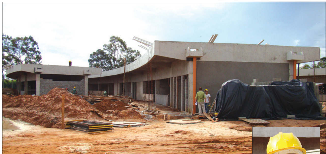
Construção da Escola do SESI