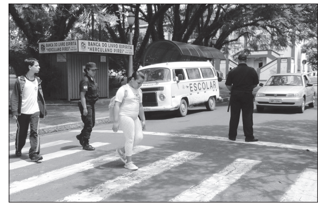
Laboratório realizado em frente a EMEB Maneco Dionisio