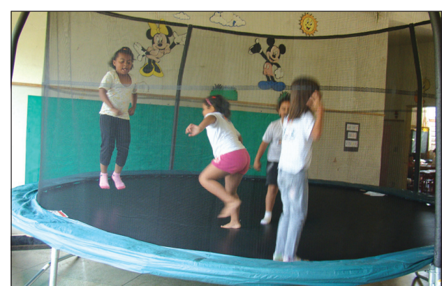
Pula-Pula instalado na EMEB Zainy Zequi