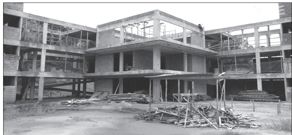
Obras do Hotel em construção

No mês de abril, mais precisamente no dia 2, a Estância Turística de Avaré ganhará uma nova atração que será responsável por aumentar o número de turistas na cidade. Nesta sexta-feira, será inaugurado o Hotel Fazenda da APCEF