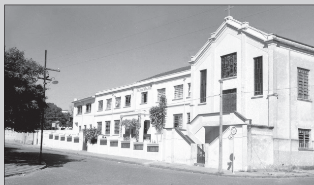
A fachada da escola em imagem de 1960

a superiora, já idosa. As outras religiosas, para a meditação, sentavam-se na parte do genuflexório que servia para se ajoelharem. Em tudo, imperava a pobreza!”