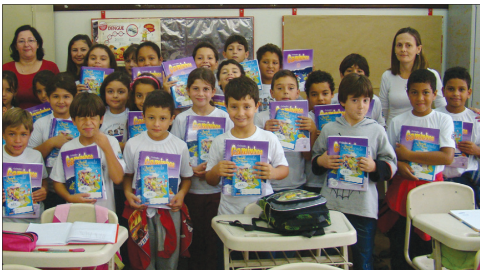
Alunos recebem apostilas e agendas

Com o intuito de superar o índice de 2010, acima da média nacio-