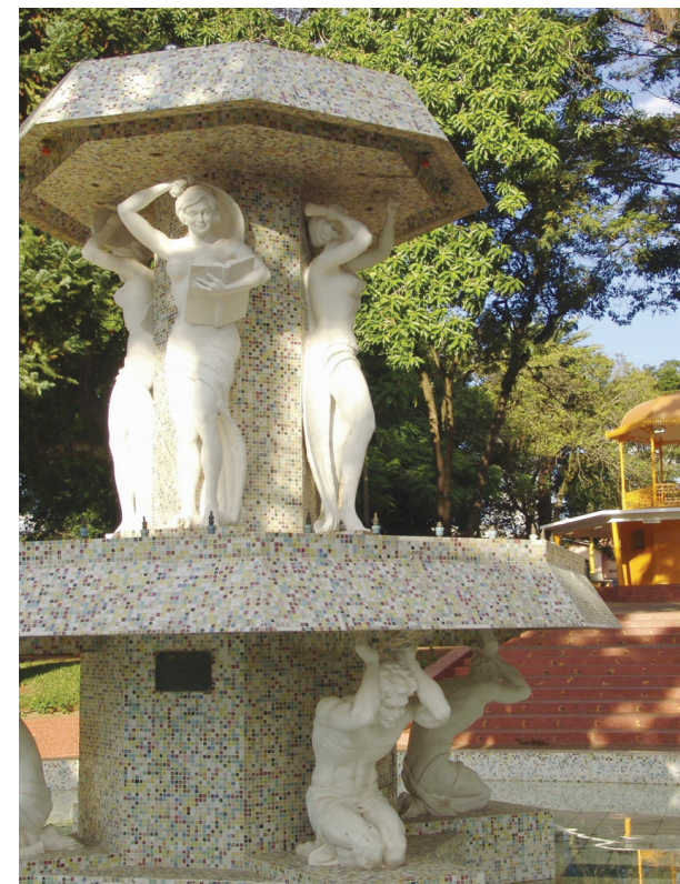
Fonte das Artes

Hoje, a partir das 19h00, no Cineclube Avaré (CAC), será exibido um documentário sobre este grande artista, que viveu grande parte de sua vida em Avaré e é responsável pela maioria das obras espalhadas na cidade, como Monumento ao Desbra-