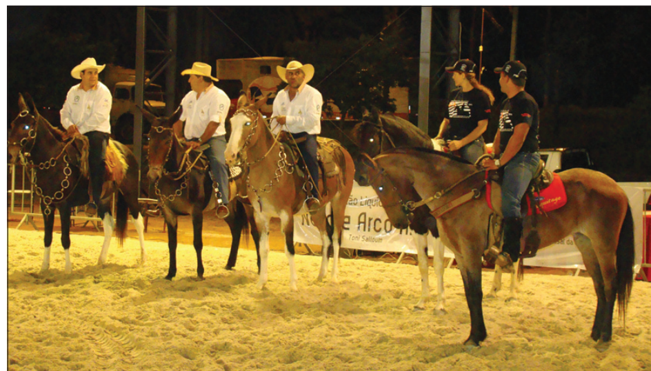
Companhia dos Muladeiros de Avaré e Mangalarga Marchador

O 1º Turno ocorre até o dia 20 de março, com os julgamentos das raças Nelore, Angus, Santa Gertrudes, cavalos Bretão e Mangalarga Marchador, que puderam ser apreciadas no noite de terça-feira por todos os presentes