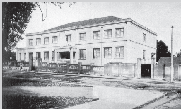
O prédio do Colégio ainda inacabado, 1940

E prossegue: “Na minicapela, cabiam, com muito favor, o altar e quatro genuflexórios individuais. Cadeiras não havia, a não ser para