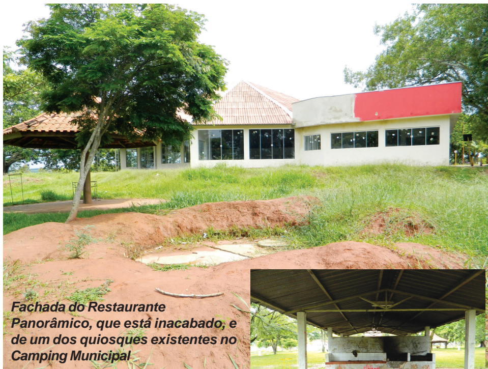
Fachada do Restaurante Panorâmico, que está inacabado, e de um dos quiosques existentes no Camping Municipal

A Secretaria de Turismo está reorganizando o setor e vai concluir obras inacabadas para melhorar a imagem do Camping. Desta forma o principal