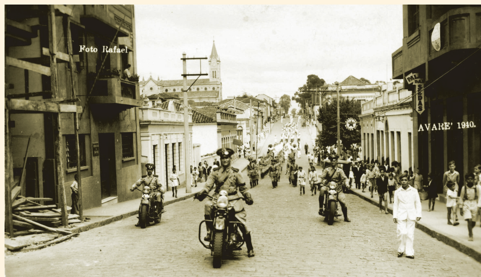
Desfile motorizado do TG 85 na comemoração do Estado Novo, 10 de novembro de 1940.

Embrião do atual TG, a Linha de Tiro 85 funcionou como uma sociedade com fins militares até 1944.