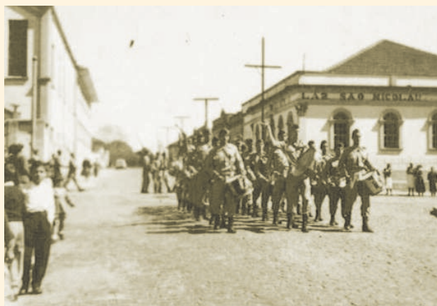
A fanfara do TG nº 7 desfilando pela Rua Pernambuco, 1956.

A palavra Tiro, de origem latina, é empregada curiosamente, conforme a etimologia, para descrever novato, jovem soldado e recruta.