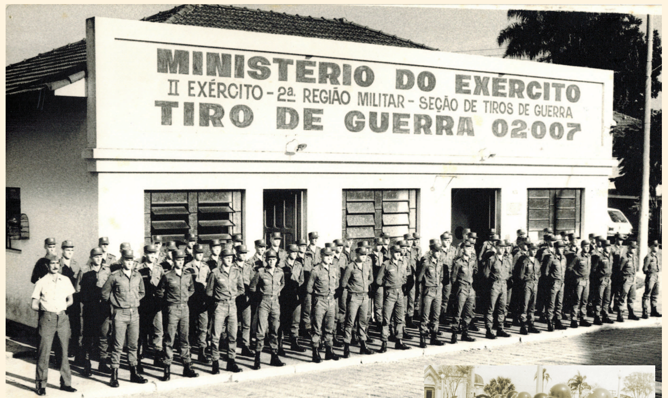
Atiradores em frente à sede do TG, 1979; e em frente da Matriz, 1969.

Ao longo desse período, de maneira disciplinada, os jovens aprendem noções de saúde, ação comunitária, defesa civil e meio ambiente. Costumeira é a ajuda dada pelo TG em campanhas anuais, como a do Agasalho.