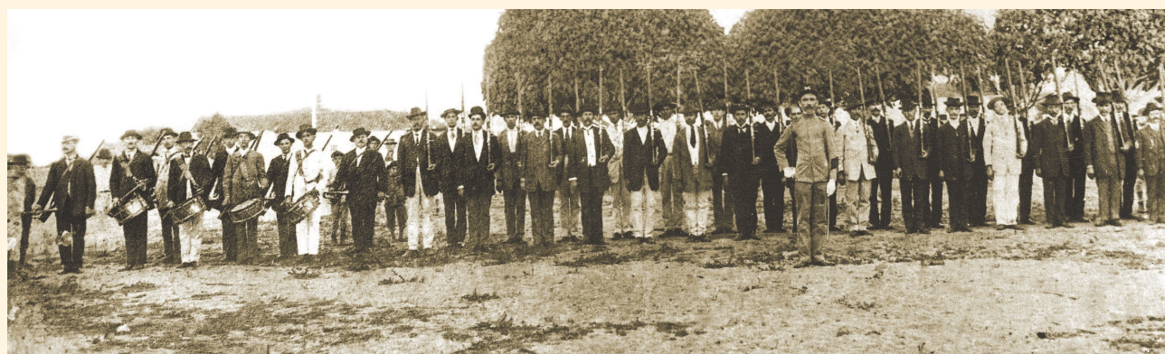
Grupo de voluntários hermistas e de sócios da Linha de Tiro em 1910.

mais de seis décadas de atividades, o Tiro de Guerra de Avaré é um dos duzentos distribuídos hoje por quase todo o território nacional.