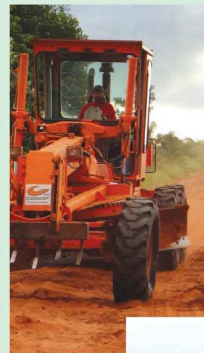
Programa Melhor Caminho beneficiará a zona rural