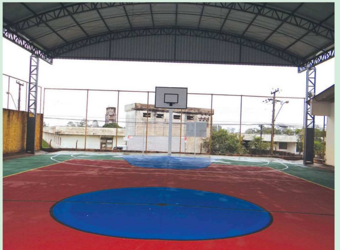
Quadra esportiva da EMEB Dondoca recebeu cobertura metálica