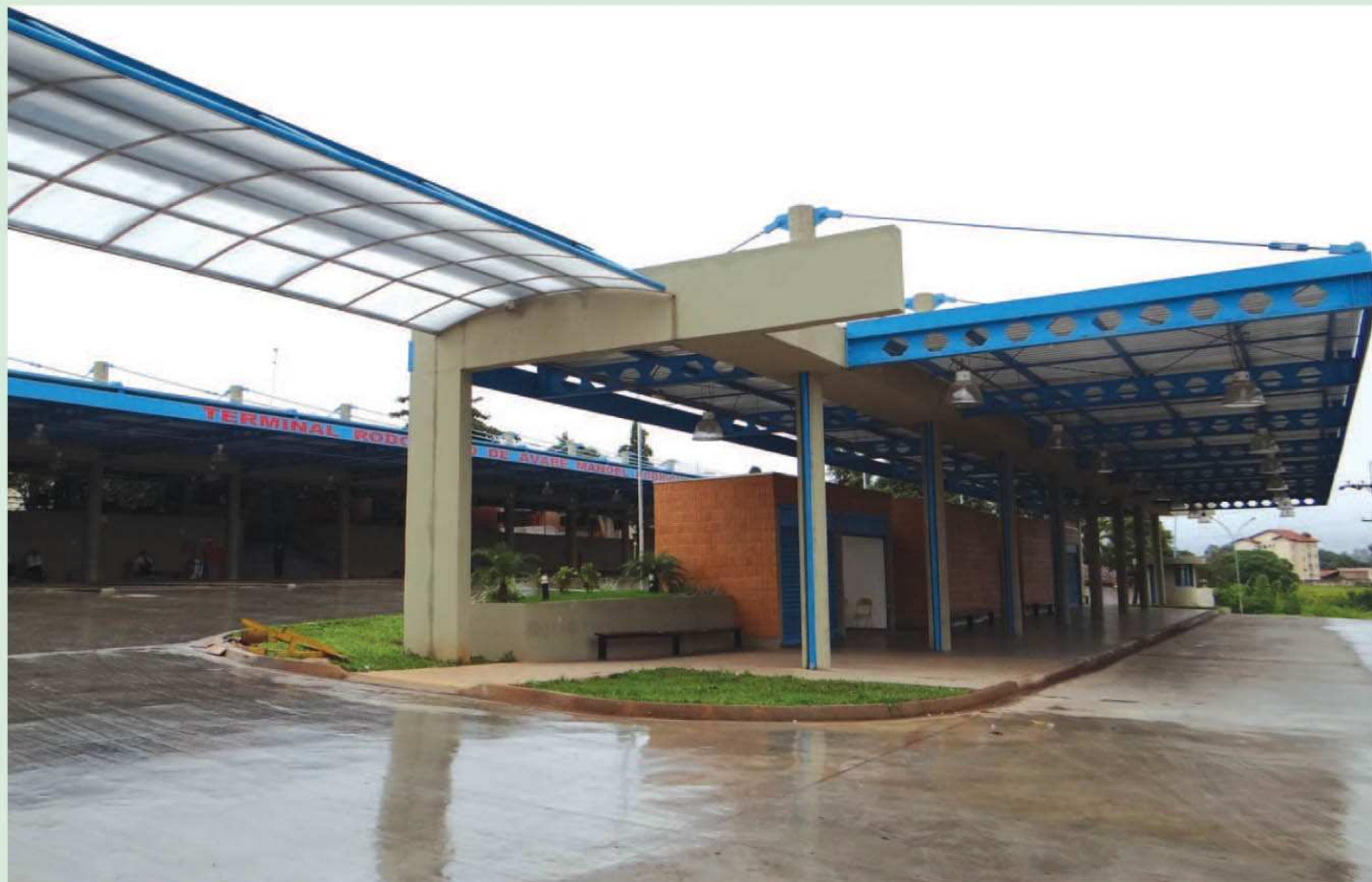
Rodoviária agora terá Terminal Urbano Integrado