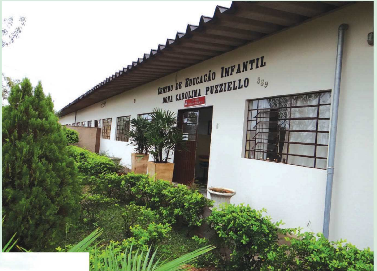
Ampliação da Creche Carolina Puzziello já foi concluída