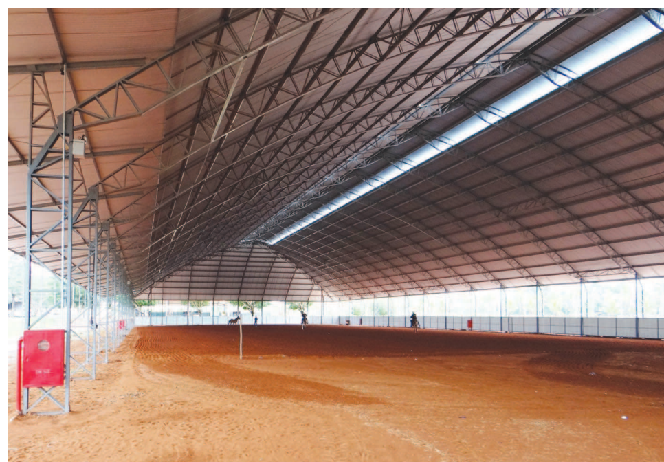
Segunda pista coberta do Parque de Exposições

Serão distribuídos nas 18 modalidades, mais de R$ 800 mil em prêmios e 900 troféus. Além das provas, ocorrerão nove leilões da raça, entre eles o Oficial ABQM, que deverão arrecadar aproximadamente R$ 14 milhões com a venda de cerca de 400 animais.