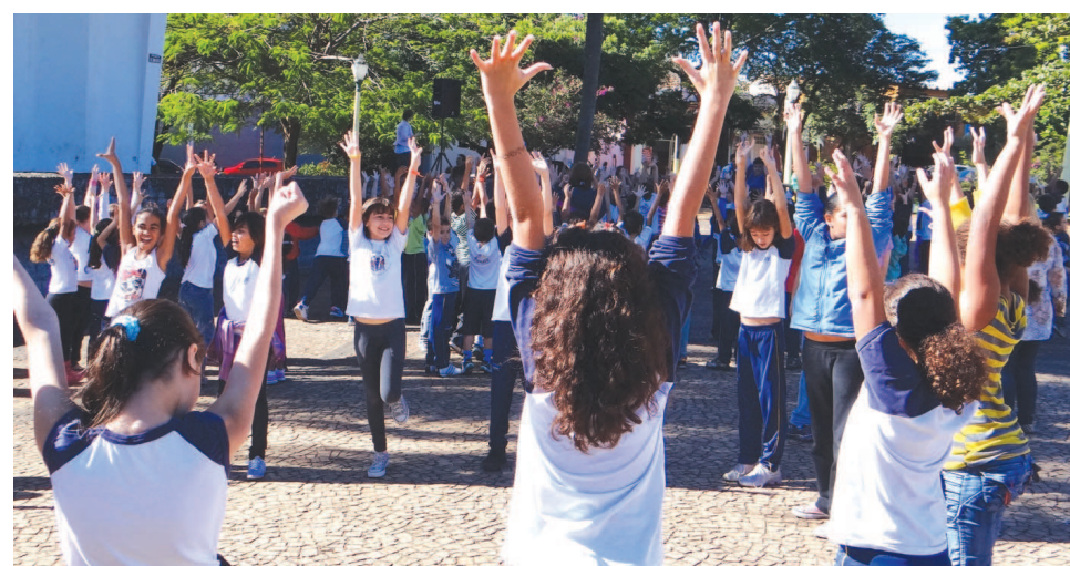
Alunos das escolas municipais participaram do Dia do Desafio

O setor da Educação mobilizou todos os alunos da Rede Municipal de Ensino. Os funcionários da Câmara também participaram do Dia do