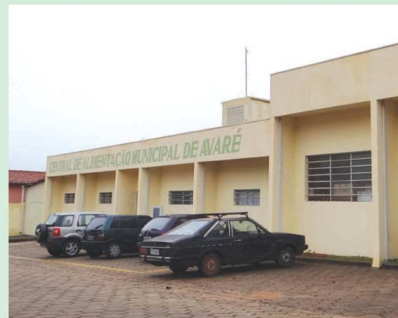
Cozinha Piloto passou por reformas e ade

É a Prefeitura Municipal da Estância Turística de Avaré, investindo em infraestrutura para melhor atender sua população.