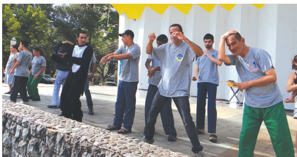
Assistidos da APAE também estiveram na Concha Acústica praticando exercícios

Com a participação de 50.69% contra 1.52% do total de cidadãos participantes, Avaré venceu da cidade de San Julián, na Bolívia, no Dia do Desafio, que aconteceu no último dia 30 de maio, onde