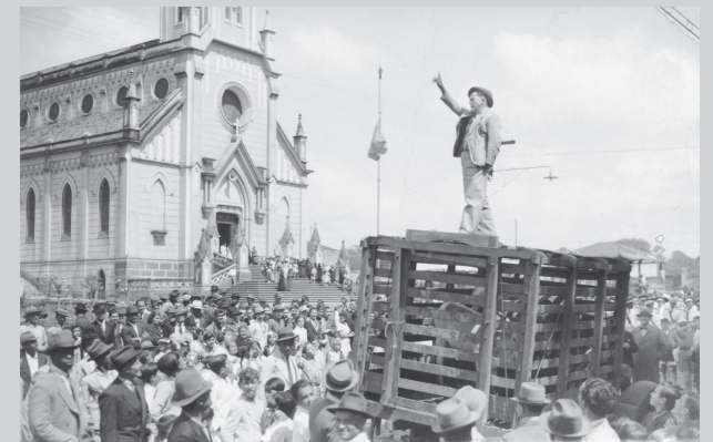
Leilão de gado movimentava a festa no Largo da Matriz, 1935.

Terminada a missa, o pároco saía pelo largo poeirento e enfeitado com coqueiros e bandeirolas coloridas para distribuir roscas preparadas pelas