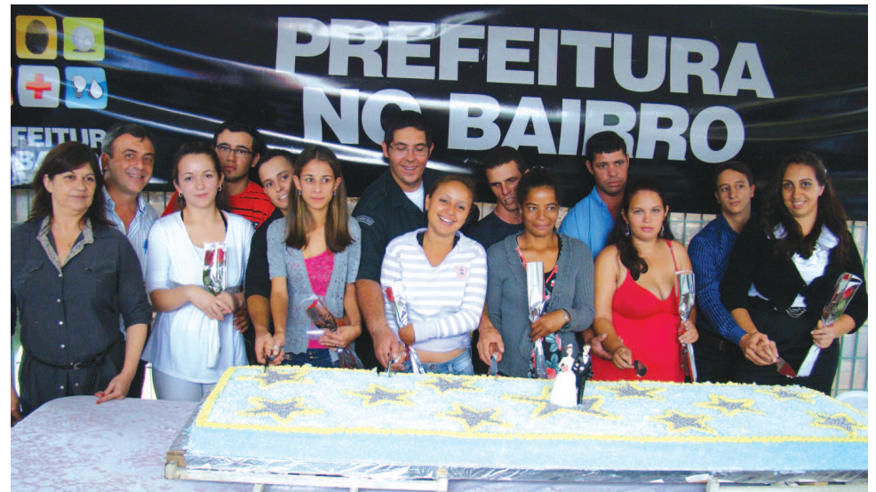
Em 30 edições, o Projeto Prefeitura no Bairro já realizou diversos casamentos comunitários

Os servidores municipais vão permanecer à disposição dos moradores para acolher suas reivindicações. A Secretaria da Saúde, por exemplo, disponibilizará atendimento médico durante o período sem necessi-