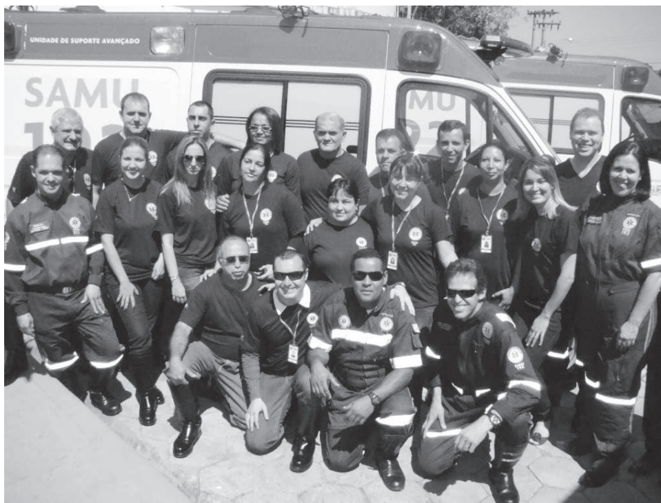
Equipe de Avaré do SAMU Regional Vale do Jurumirim

As inscrições deverão se feitas pessoalmente na sede do SAMU Avaré, situada na Rua Lázaro Amaral Leite n.º 394, de segunda a sexta-feira das 09:00 às 11:00 e das