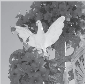
Pomba branca, símbolo bíblico do Divino Espírito Santo.