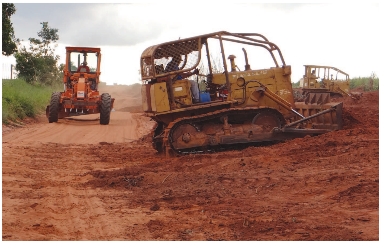
Máquinas trabalham na Estrada da Escaramuça

Tem como objetivos a readequação das plataformas das estradas rurais de terra, para a implantação de sistema de drenagem eficiente; dotar os pontos de deságue da estrada, de estruturas que evitem a ocorrência de erosão nas propriedades, como terraços ou bacias de captação, favorecendo a infiltração das águas pluviais e a recarga do lençol freático; melhorar as condições de suporte e rolamento das pistas das estradas rurais.