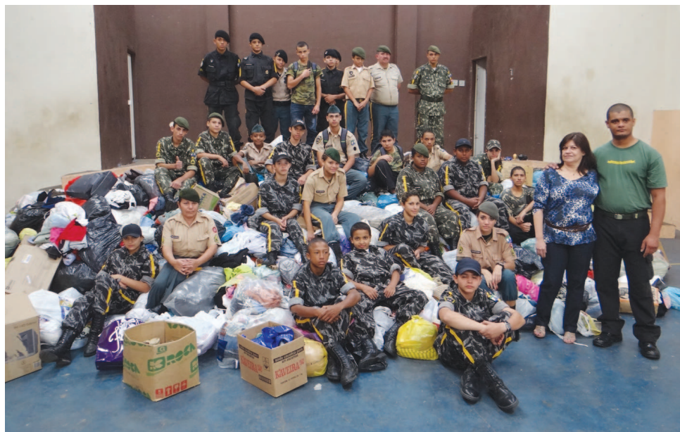
A Academia Militar de Defesa Pessoal da Estância Turística de Avaré é uma grande parceira nas campanhas realizadas no município