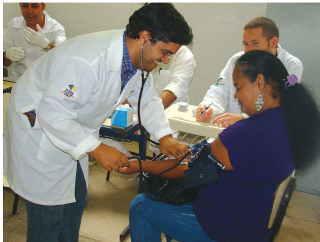
O Projeto oferece serviços como testes de glicemia e aferições de pressão arterial

Até às 17 horas, os diversos setores do Governo Municipal estará atendendo às necessidades do bairro por