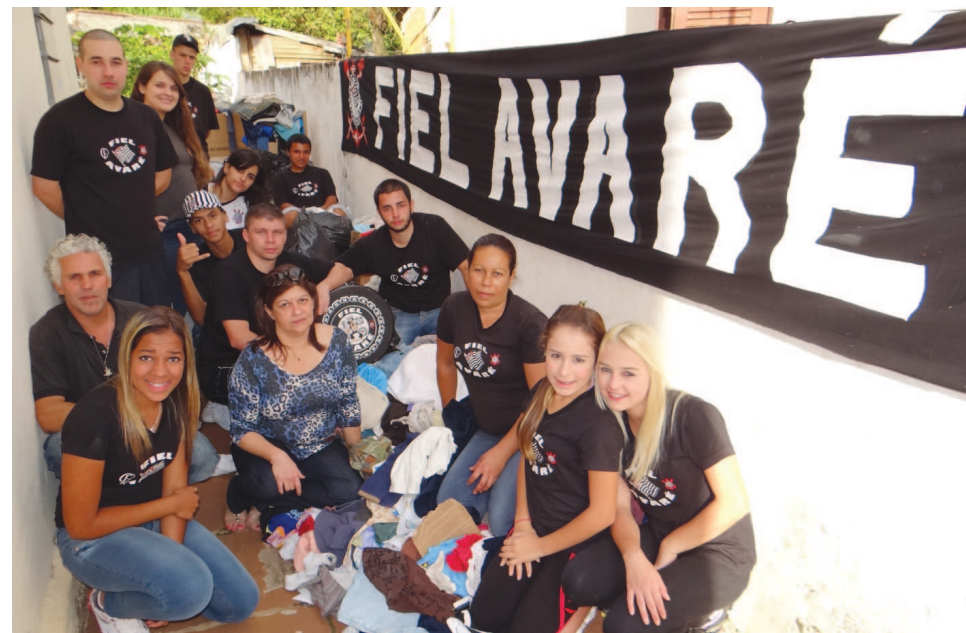
Fiel Avaré marca presença na Campanha do Agasalho 2012

No último sábado, 18, Avaré organizou um mutirão para arrecadação de agasalhos para a campanha 2012. A ação organizada pelo Fundo Social de Solidariedade de Avaré contou com a parceria da Sabesp, do Tiro de Guerra, da Academia