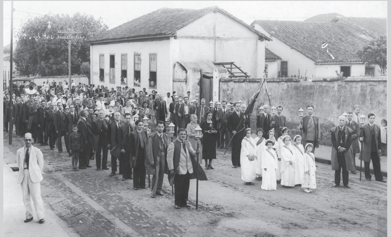
Procissão da Festa do Divino, tendo à frente a Irmandade do Santíssimo Sacramento, pela Rua Pernambuco, 1936

A parte profana dos festejos constava de leilões de prendas, levantamento do “pau de sebo”, no alto do qual eram colocados alguns mil réis, e do