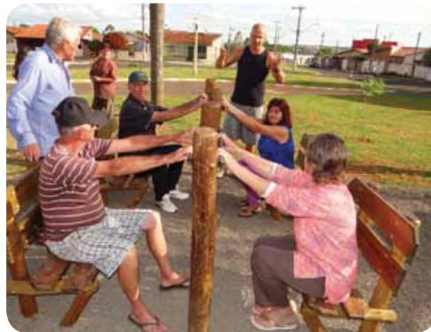
Idosos se exercitam na nova Praça do Idoso do Município

Os eventos tiveram início no sábado, 24, com a realização da 33ª edição do Projeto Prefeitura no Bairro. Na quarta-feira, 28, foi a vez do esporte festejar com a Final da Copa de Futsal dos Comerciantes e, na noite de ontem, foi a vez da Cultura Avaréense festejar a realização do Festival Literário de Avaré. Dentre as inaugurações realizadas estão as novas Instalações do Bolsa Família, o Telecentro do CSU e a Praça do Idoso do Bairro Vera Cruz.