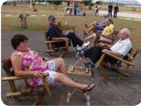
IDOSOS SE EXERCITAM NA NOVA ACADEMIA

-Escada - Aumenta a independência para atividades de vida diária e facilita o deslocamento; Estação Ergometria - Melhora/mantém a flexibilidade e o movimento das articulações das pernas; Estação Placa Giratória - Melhora/mantém a flexibilidade e o movimento do punho e do antebraço e Estação Escada para Dedos - Melhora/mantém a mobilidade dos ombros e a extensão do braço.