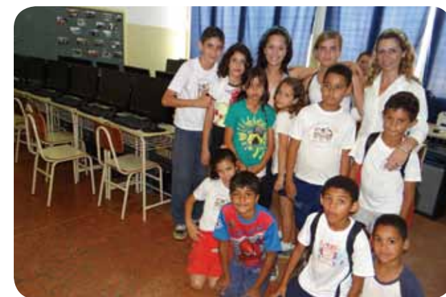
Telecentro do CSU garantirá inclusão digital da comunidade

O Centro Social Urbano "Dr. Públio Pimentel" funciona das 7h00 às 17h00 e atende crianças e adolescentes em dois períodos, manhã e tarde, oferecendo atividades extracurriculares, tais como: leitura, dança, música, ginástica, basquete, judô, futebol, futsal, defesa pessoal e informática.