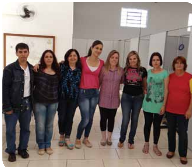
Equipe do Bolsa Família comemora a aquisição das novas instalações

mas e serviços: Carteira do Idoso Interestadual, isenção de taxa de concurso, tarifa social, telefone social, contribuição reduzida de INSS para donas de casa, o Programa Bolsa Família e o BPC – Benefício Prestação Continuada que garante um salário mínimo para idosos e deficientes. Vale-se ressaltar ainda que as instalações atendem diariamente 150 pessoas, totalizando 3.000 atendimentos ao mês e possui mais de 15 mil famílias inscritas.