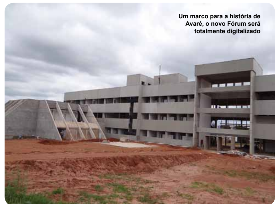
Um marco para a história de Avaré, o novo Fórum será totalmente digitalizado