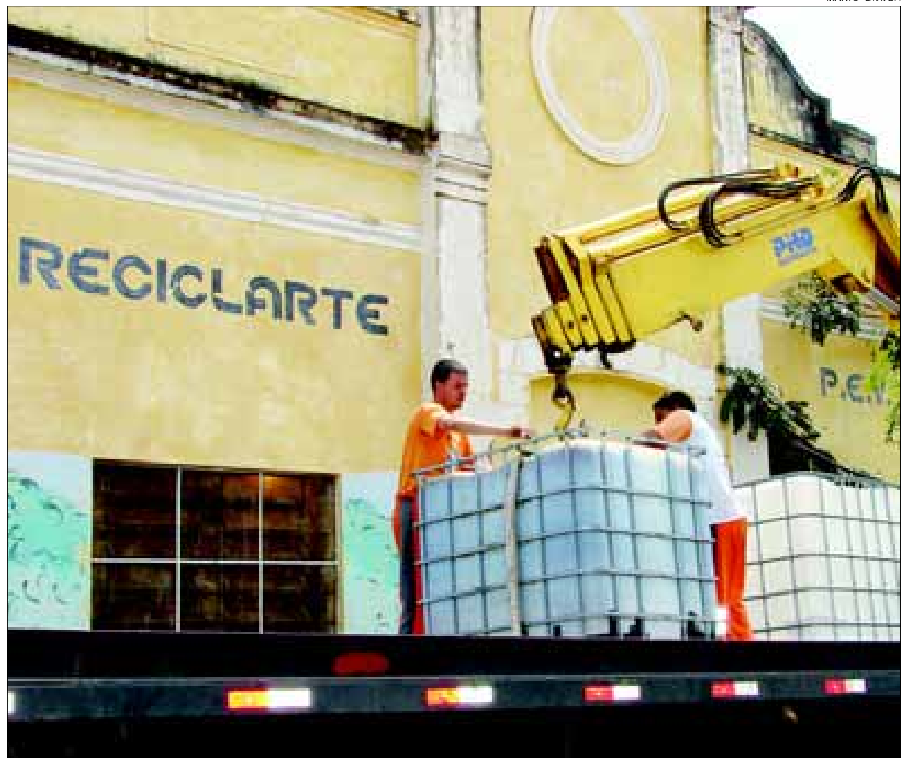
Os 1.000 litros de resíduo de óleo vegetal (de cozinha) coletados foram destinados para a produção de Biodiesel, destino ecologicamente correto

A coleta de resíduo de óleo de cozinha no município continua e conta com a participação de toda a população, para que possamos evitar que maior volume de resíduo de óleo comprometa a água saudável de nossas futuras gerações.