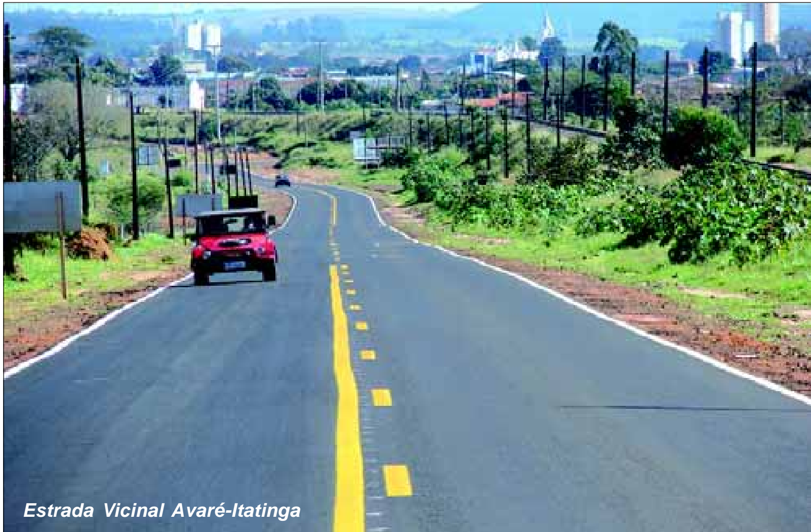
Estrada Vicinal Avaré-Itatinga

Isto se deve ao fato de que após receber a pavimentação, a mesma apresenta características de uma rodovia convencional, no entanto a obra é realizada sobre o traçado existente da estrada, muita vezes com curvas perigosas e áreas de pouca visibilidade e também com prováveis trânsito de bicicletas, pedestres e mesmo carroças adentrando a pista, motivo pelo qual a atenção deve ser redobrada por parte dos motoristas.