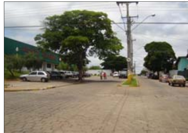
Avenida Pinheiro Machado

e pavimentação da Avenida Mário Covas (R$ 153.855,25).