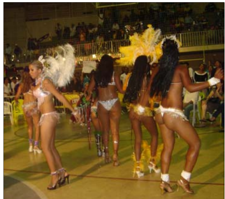
Participantes da eleição da rainha

No encerramento aconteceu o sensacional baile de pré-carnaval com a animação da Banda Latitude 7.