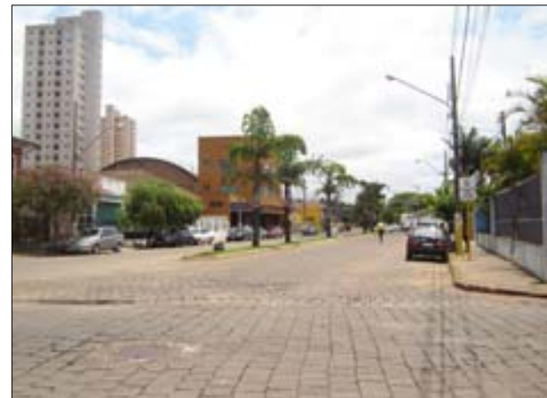
Avenida Major Rangel

Os valores referentes ao ano de 2006, que chegam a R$ 1.486.867,71, ainda não foram liberados, aguardando a aprovação dos projetos das obras. O valor deverá ser investido no recapamento asfáltico da Avenida Major Rangel (R$ 600.000,00), iluminação da Avenida Misael Eufrásio Leal (R$ 200.000,00) e urbanização e construção de praças (R$ 686.867,01).