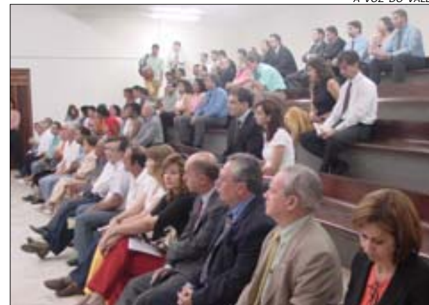
O encontro aconteceu no Salão do