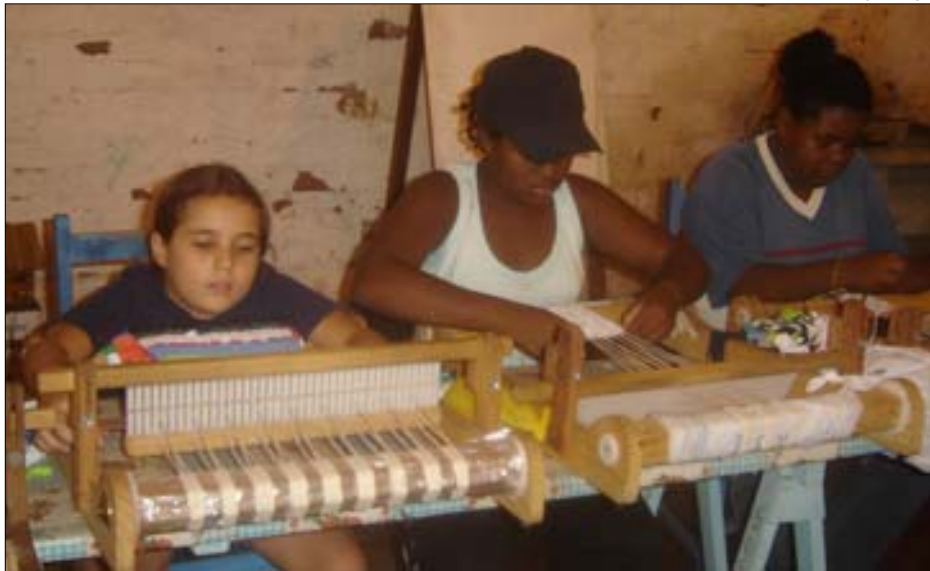
Crianças e adolescentes aprendem uma futura profissão com o