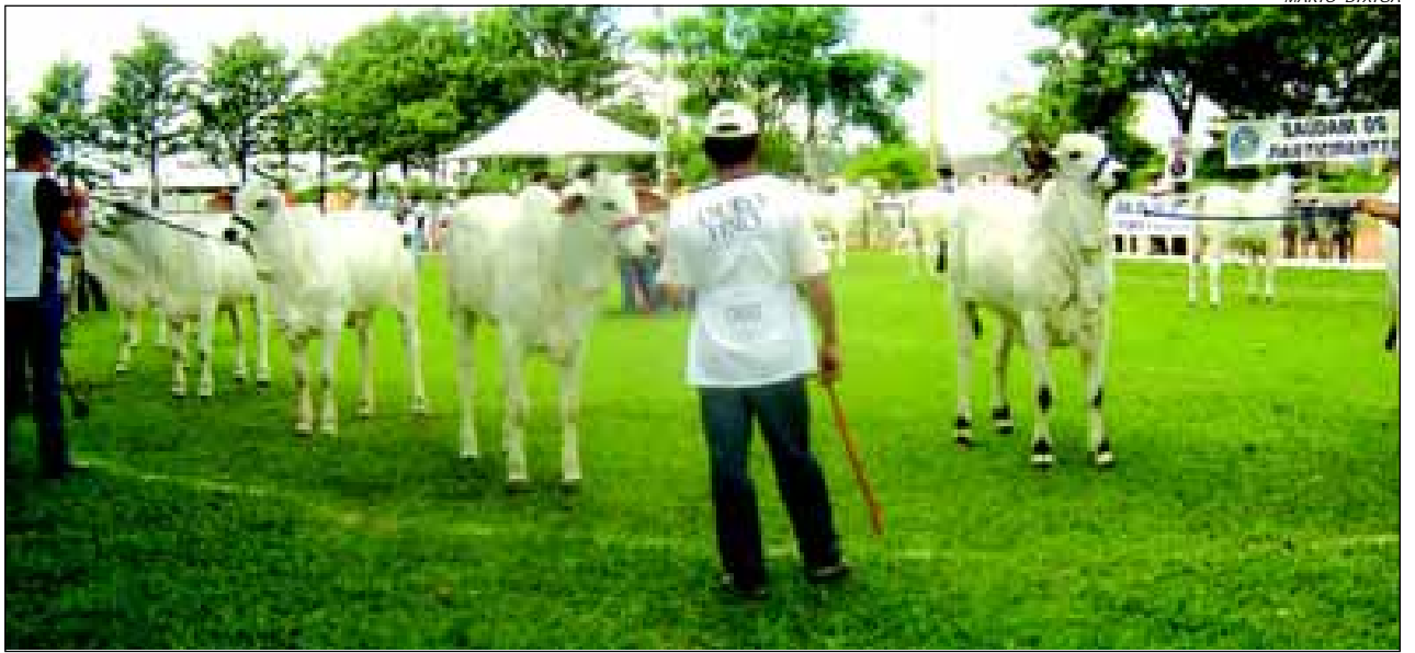
43ª Emapa deve superar número de animais em relação ao ano passado

Neste ano, no primeiro turno da exposição, acontecem quatro remates de Nelore: Tesouros do Nelore, Leilão Oficial AgHROzurita Avaré Hall 2008, Leilão Qualidade Nelore e Leilão Nova Geração. No segundo turno, dois remates serão dedicados a raça Brahman, o Leilão Marcas de Peso e o 4º Leilão Princesas do Brahman, um do Santa Gertrudis o 2º Leilão Brasileiro Santa Gertrudis Emapa, um remate de Simental, o Leilão Liquidação Simental da Agro e um leilão de Guzerá, o Leilão Virtual Prenhezes Zebu.