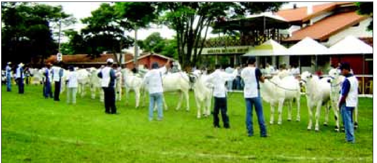
Evento será realizado de 18 de fevereiro a 3 de março