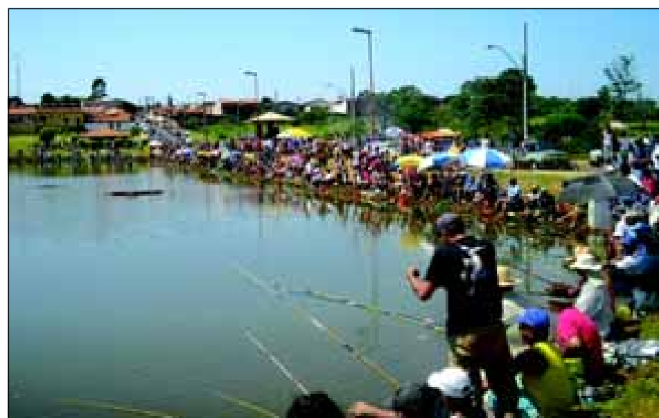
Haverá premiação em várias categorias