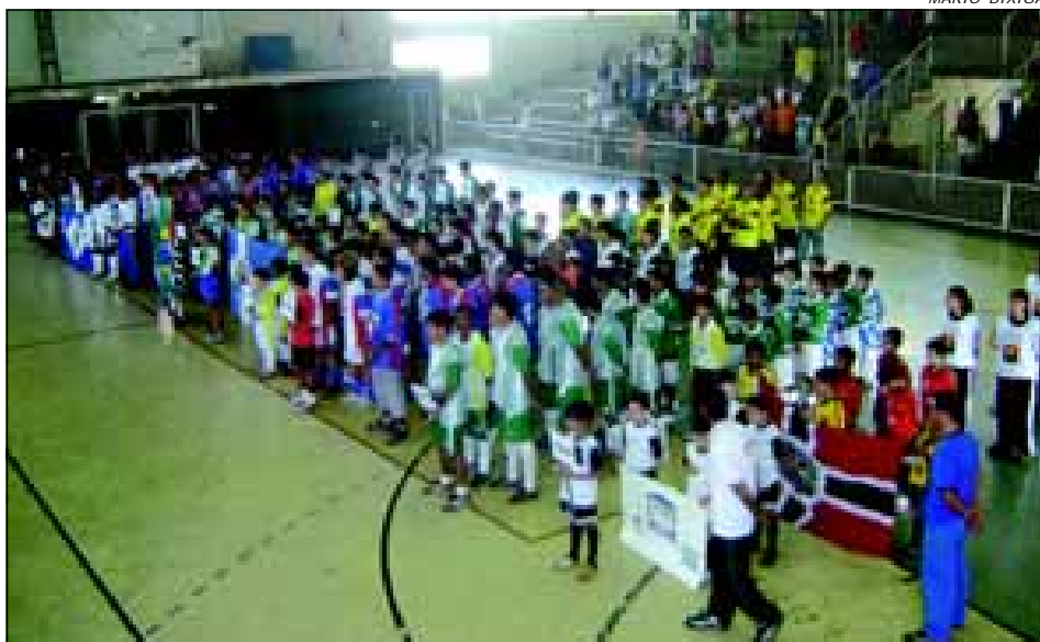
A Cerimônia de Abertura está marcada para o dia 2 de março

A Secretaria Municipal de Esportes (SEME) de Avaré já deu início a preparação para a realização Copa Revelação de Futsal, que já vem se tornando o principal evento da categoria na região.