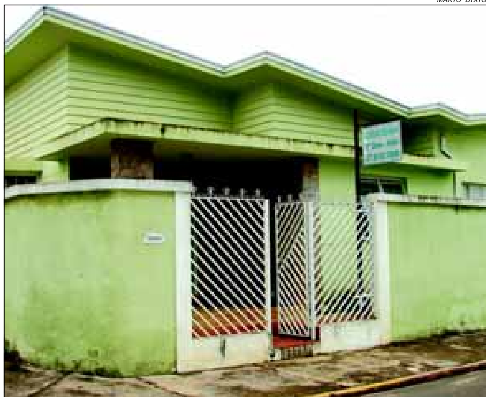
Cartório Eleitoral atende a Rua Pará, 1790

O alistamento eleitoral é obrigatório para todo brasileiro maior de 18 anos e com idade inferior a 70 anos. É facultado (não é obrigatório) para os analfabetos, os que completarem 16 anos até o dia da eleição (05/10/2008) e menores