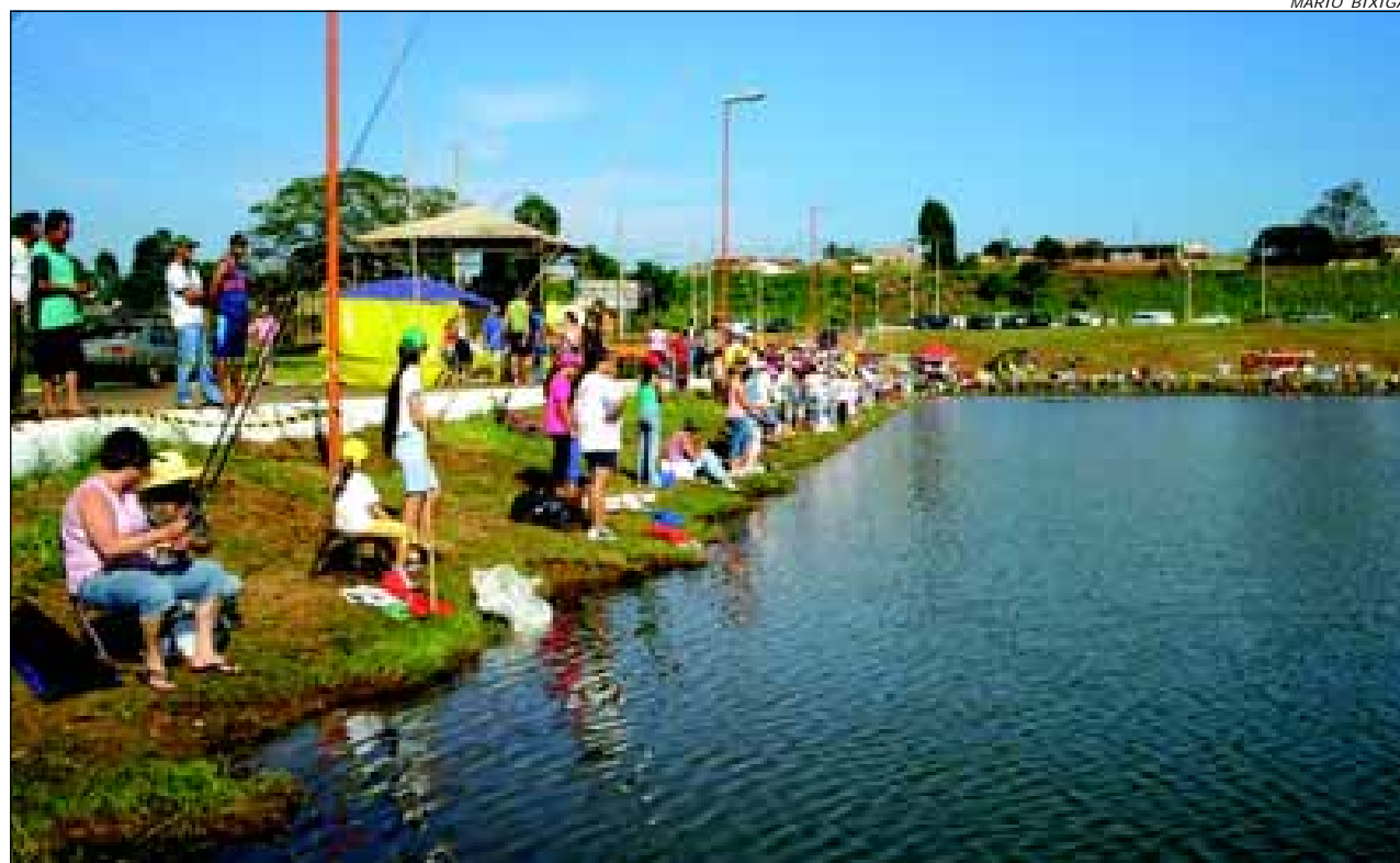
Evento terá um dia exclusivo só para mulheres

Não será permitida a utilização de mais de um anzol por vara e jogar tra-