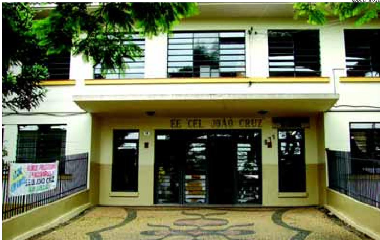
Sessões 095, 101, 108 e 112 serão na Escola Cel. João Cruz