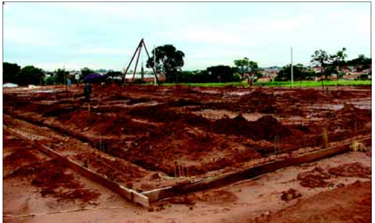
A obra beneficiará um grande número de alunos daquela região

O Procon de Avaré atende na Rua Mato Grosso, 1360. Maiores informações podem ser obtidas pelos telefones 3733 7010 ou 3733 7565.