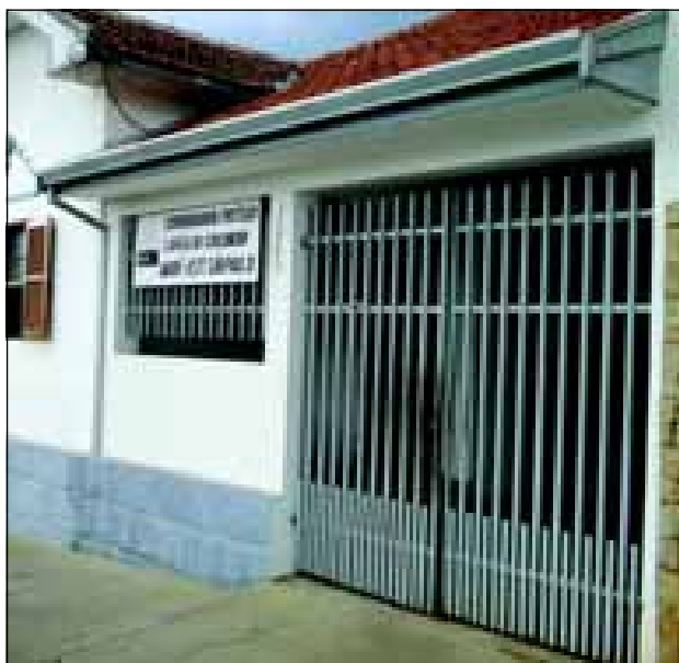
Procon atende na Rua Mato Grosso, 1360

Durante o ano de 2007, a agência do Procon de Avaré registrou um total de 25.387 consultas. A imensa maioria destas consultas foram resolvidas dentro do próprio Procon, com entendimento entre as partes somente através do diálogo via telefone. Em apenas 803 casos foi necessário a presença das partes para uma tentativa de entendimento. Dos 803 casos, apenas 292 precisaram ser definidos na justiça.