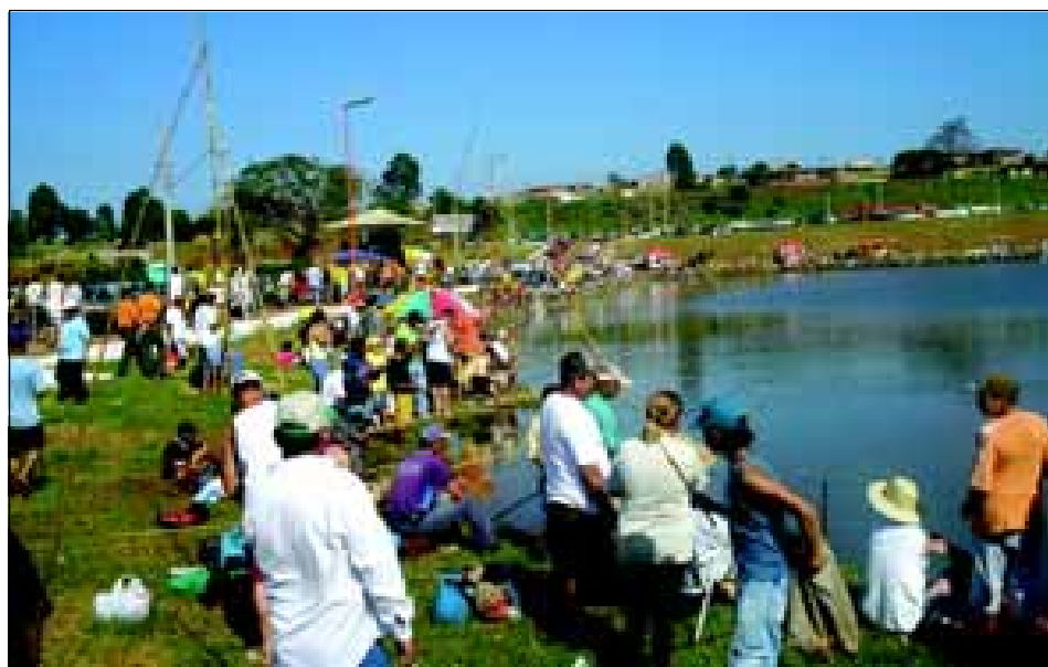
Serão sorteados diversos brindes para os participantes

onde cada pescador poderá ficar, será feito um sorteio antes do início.