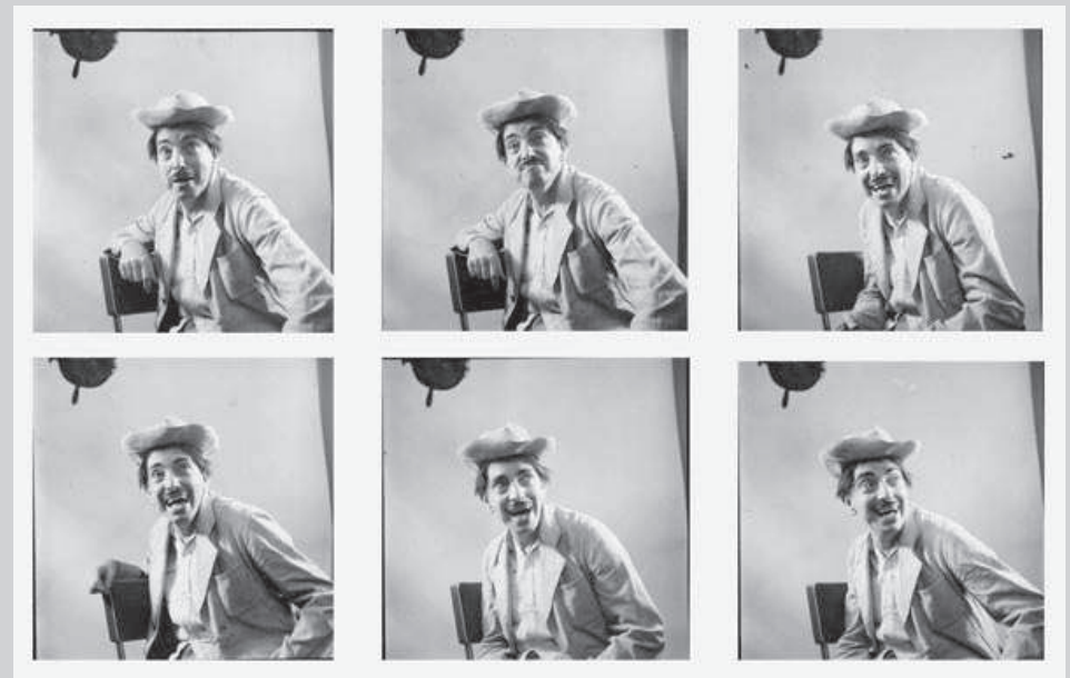
Sobre luzes e câmeras, os trejeitos do caipira.