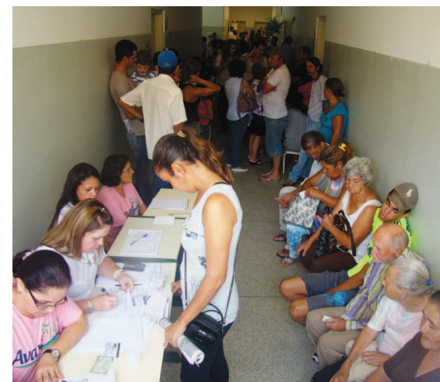
População aguardando atendimento médico durante a realização do Prefeitura no Bairro

Esta edição contou com duas novidades, sendo elas um estande da Câmara Municipal, que prestou in-