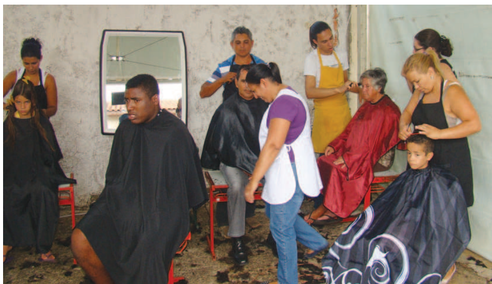
Realizados 105 cortes de cabelo

O projeto disponibilizou atendimento médico sem agendamento para as seguintes especialidades: pediatria, clínica geral e ginecologia, além da área odontológica, orientação jurídica; emissão de RGs, Carteira de Trabalho e 2ª via de Certidão Nascimento; Orientação Nutricional com os alunos da ETEC; Corte de cabelo; brincadeiras e atividades esportivas para as crianças; distribuição de pipoca e algodão doce; informação e orientação do direito do