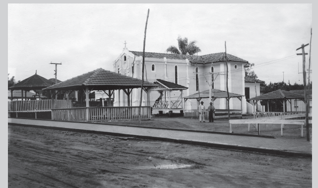
Mazzaropi fez espetáculos em favor da Capela de São Benedito, Rua Mato Grosso (1942).

membros da comissão de obras da igreja se manifestaram nestes termos: “Agradecemos o fidalgo gesto do Mazzaropi que assim demonstra o seu alto espírito estar impregnado do mais sadio sentimento religioso. Pedimos a São Benedito que cumule a ele e a seu elenco das mais esplêndidas bênçãos do céu”.