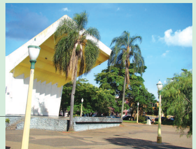
Concha Acústica, local da encenação

Em sua sétima edição a “Encenação da Paixão de Cristo”, um dos grandes eventos anuais da Secretaria Municipal de Cultura e Lazer de Avaré, acontecerá em edição especial na Concha Acústica, na noite de 6 de abril, feriado religioso. Página 40.