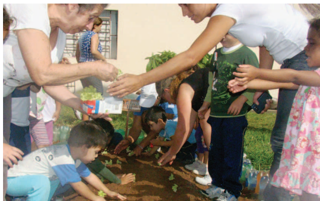
Alunos do CEI Jandira Pereira durante o plantio de hortaliças

Durante o plantio, estiveram presentes além da equipe escolar, pais de alunos, representantes do Poder Executivo, da Secretaria Municipal da Educação e do Poder Legislativo. Foram plantadas mu-