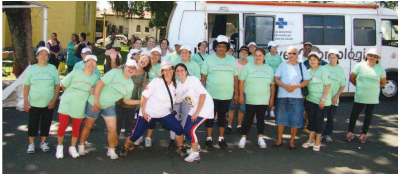
Grupo de Caminhada dos Postos de Saúde de Avaré

Pelo segundo ano consecutivo, a comunidade de Avaré terá a “Corrida e Caminhada Ecológica pela Preservação da Água” – um evento gratuito que reúne atividades esportivas, culturais e de educação ambiental. Patrocinado pela Duke Energy, com parceria da prefeitura municipal e organização da Liga RMC Esportes, o evento ocorrerá dia 15 de abril, das 8h às 12h30.