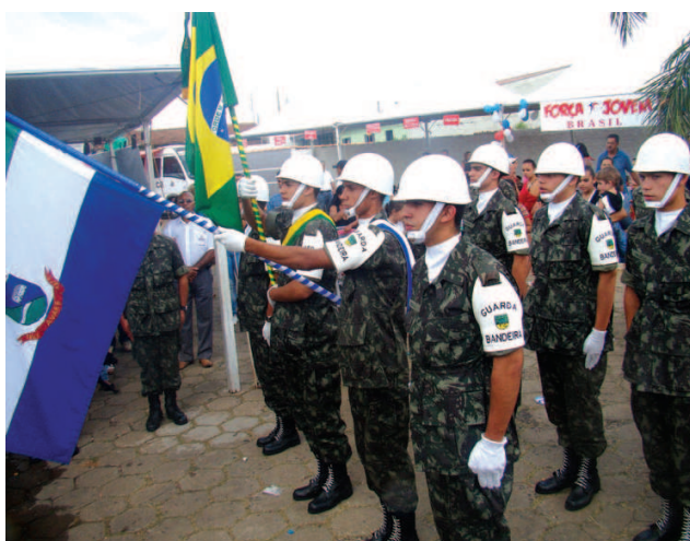
Tiro de Guerra participou do evento