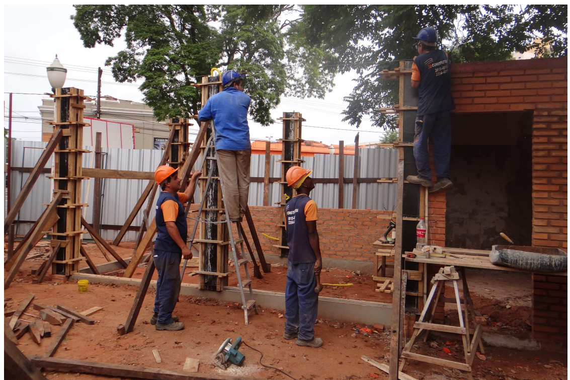
Revitalização do "Lanchódromo" têm mão de obra da cidade