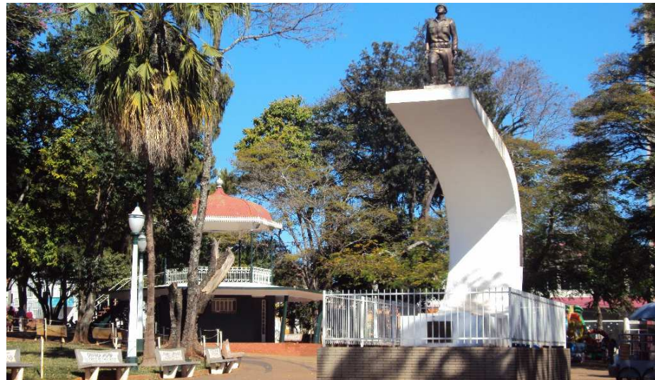
A praça vista pelo mesmo ângulo em 1941 e na atualidade.

Romântica, política e artística. No decorrer da sua história a principal praça comercial de Avaré permeou essas três fases. E quem hoje atravessa o Largo São João nem imagina que era para haver uma igreja no lugar em que está o coreto.