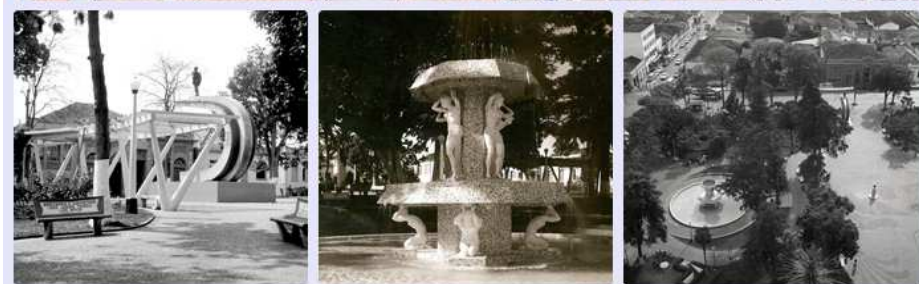
Em cima, o Largo São João em imagens de 1906, 1914 e 1940.