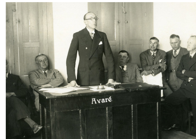
Reunido com assessores, no gabinete, 1939