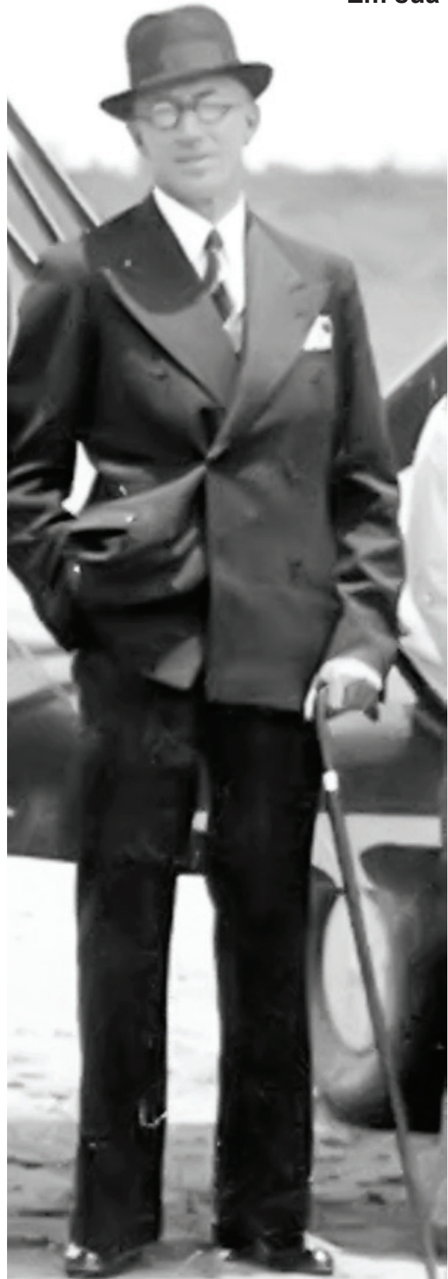
De terno, chapéu e bengala, 1940

Em sua gestão Avaré obteve avanços no saneamento e na aviação civil