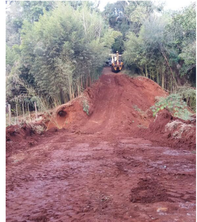
Andrade e Silva antes e depois