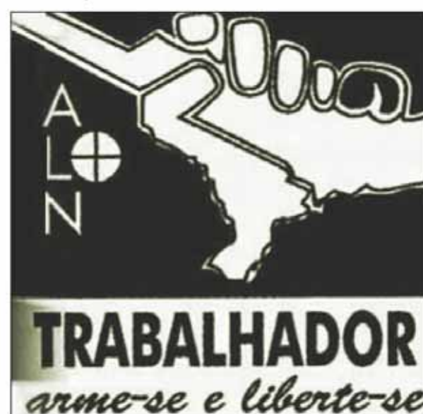
Cartaz da Ação Libertadora Nacional (ALN)