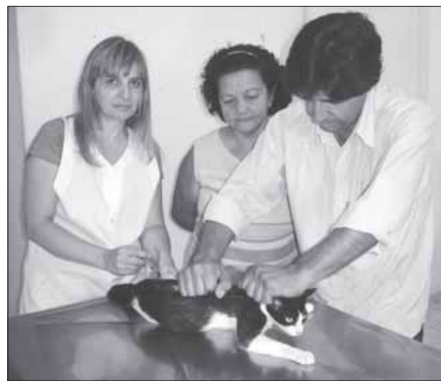
Castração de animais em Avaré supera expectativas

Além deste serviço fundamental, a população conta com atendimento