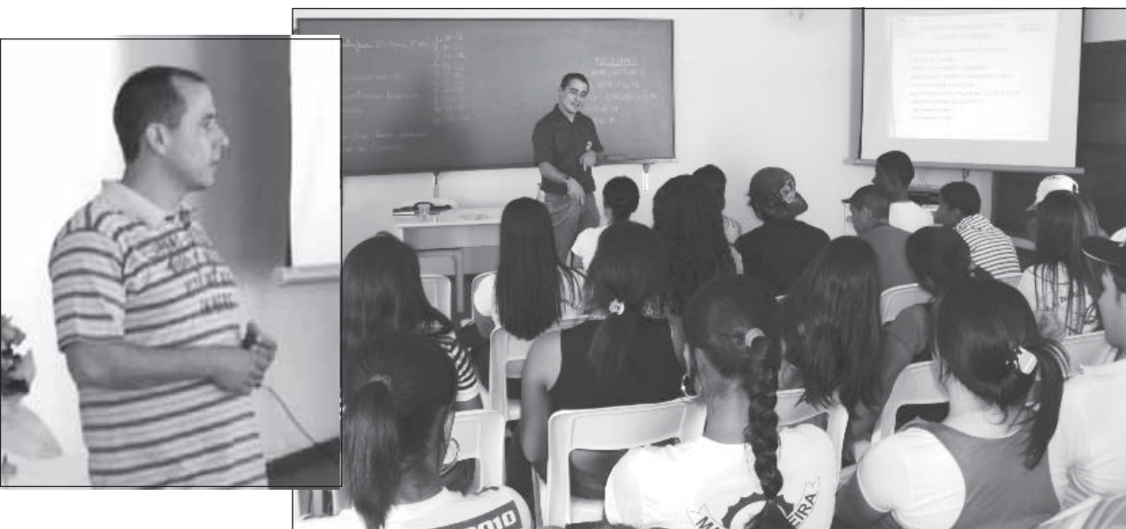
Palestras sobre Mercado de Trabalho foram realizadas pelo Programa Ação Jovem

Seguindo o eixo Trabalho e Empreendedorismo, o Programa Estadual de Transferência de Renda – Ação Jovem, vem realizando palestras referente ao tema.