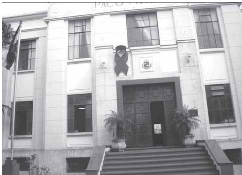
O laço, símbolo da Luta Contra a Aids, ficou exposto na fachada do Paço

A Secretaria Municipal de Saúde realizou de 16 de novembro a 1º de dezembro a Campanha “Fique Sabendo”, que teve como finalidade conscientizar a população no que diz respeito ao teste de HIV (vírus da AIDS). Foram realizados tes-