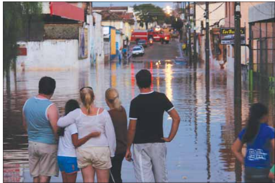
Enchentes preocupam os avaréenses ao longo de vários anos

O Governo Municipal desenvolveu um amplo projeto de engenharia para por fim ao problema histórico das enchentes. No final de novembro, em Brasília, foi entregue toda a documentação na subchefia da Casa Civil, para incluir a obra na segunda etapa do PAC (Plano de Aceleração do Crescimento), do Governo Federal.