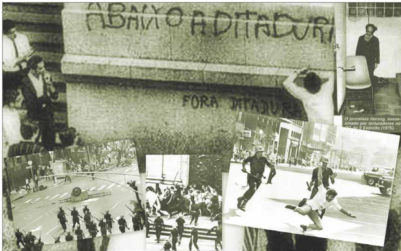
Cenas que marcaram a história da repressão política no Brasil, no final dos anos 60 até meados dos 70

Em 1970, o médico avareense vai para Cuba como integrante do Grupo dos 28. Hospedaram-se numa casa cedida por Fidel Castro. Pela manhã, ele e seus companheiros faziam exercícios físicos e à tarde estudavam. Visitavam a cidade, frequentavam a praia, sempre pensando na volta ao Brasil. Criaram lá o Movimento de Libertação Popular (Molipo), resultado dos questio-