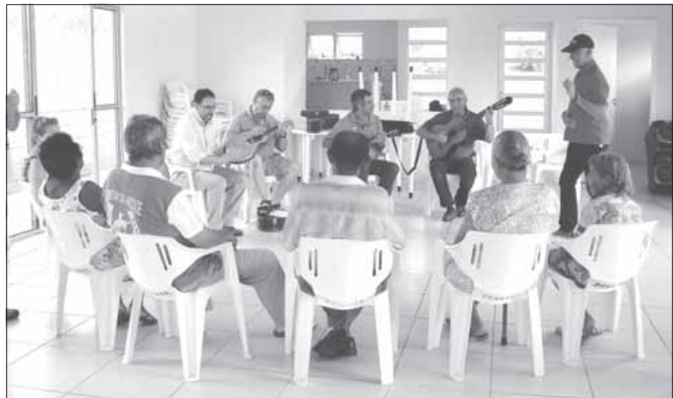
Grupo musical de chorinho animou os moradores da Vila Dignidade

Os moradores da Vila Dignidade, condomínio residencial de idosos, viveram momentos de muita emoção com a realização do Projeto “Choro na Vila”, que levou aos mesmos um pouco do gênero musical chorinho, considerado a primeira música popular urbana típica do Brasil.