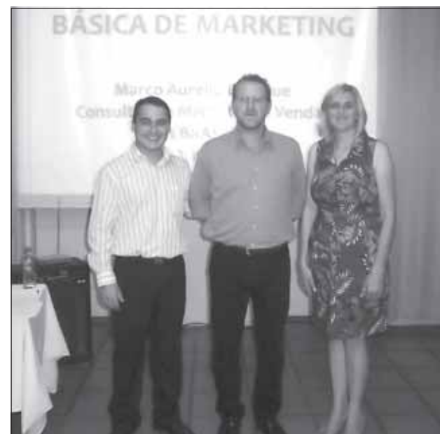
ETEC e SEBRAE: parceria de sucesso