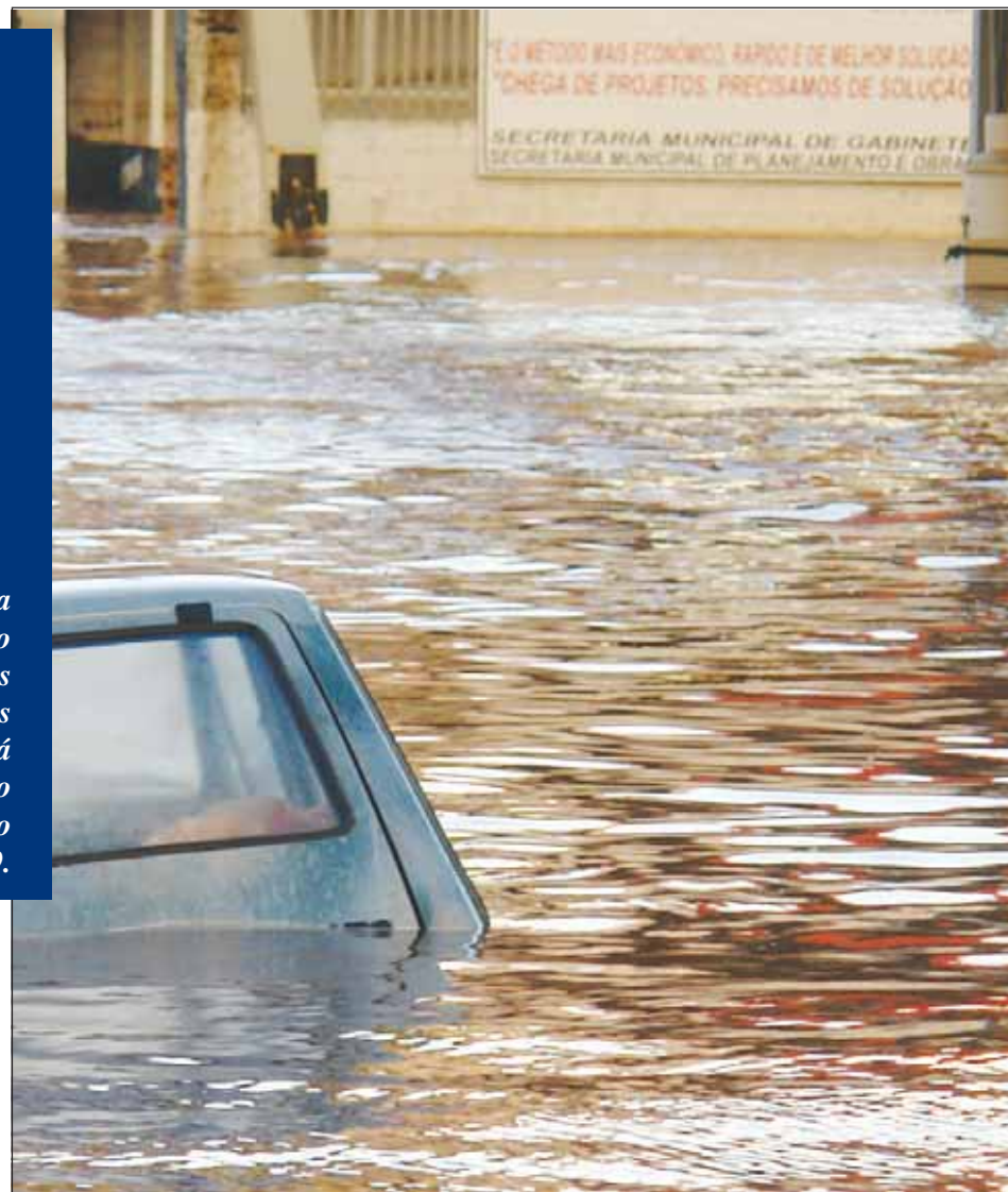
Problema das enchentes terá fim com a obra de drenagem

Um amplo projeto de engenharia foi entregue na Casa Civil da Presidência da República com o objetivo de incluir a obra no orçamento do PAC (Programa de Aceleração do Crescimento). Há décadas as enchentes vem causando transtornos às nossas famílias danificando residências e vias públicas, derrubando árvores e facilitando a expansão de erosões. Avaré já figura na lista das cidades pré-selecionadas para o PAC e esse antigo sonho dos avareenses poderá se tornar realidade com a aprovação do projeto pelo Governo Federal. Página 9.