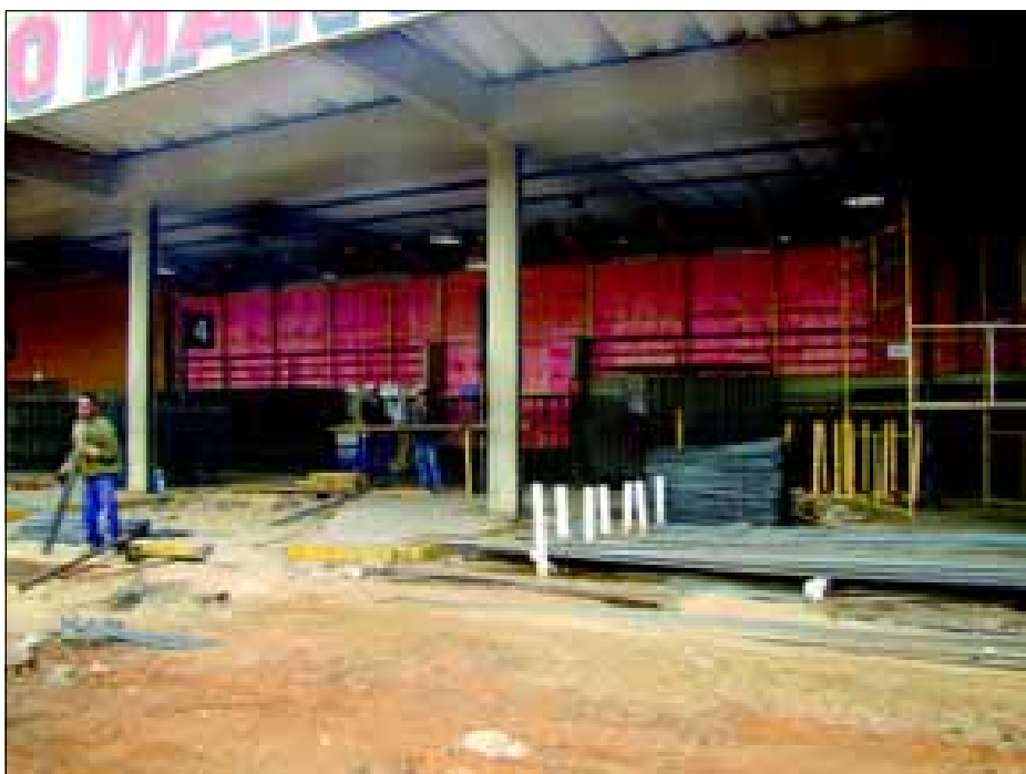
Obras de ampliação do Terminal Rodoviário