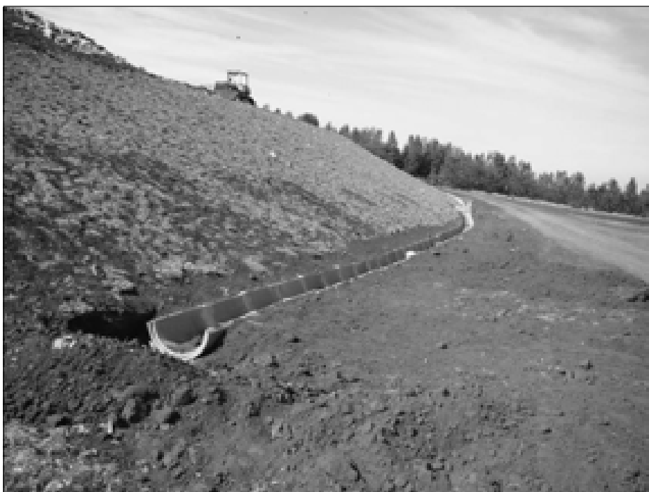
Implantação de canaleta para escoamento de água pluvial

cia, uma nova vala para aterro do lixo foi aberta, faltando apenas a implantação da manta impermeabilizante, o acesso ao aterro foi cascalhado, entre outras melhorias visíveis. Todas as exigências para o bom funcionamento do aterro estão sendo cumpridas