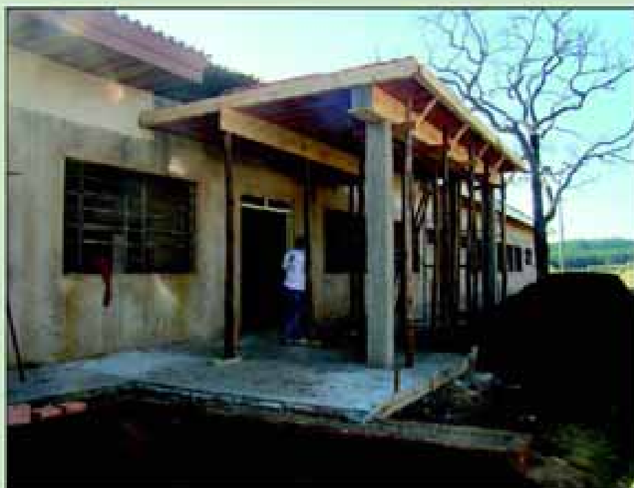
Obras da futura Creche Dona Malu