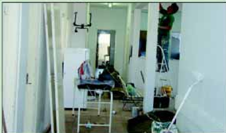
Reforma do Posto de Saúde do Bairro Alto