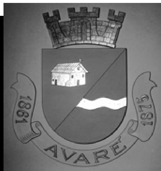
Desenho original do brasão de Avaré

Para o leitor entender melhor o caso, vamos contar um pouco da história da adoção de cada um dos três símbolos avareenses e em quais contextos os mesmos foram oficializados.