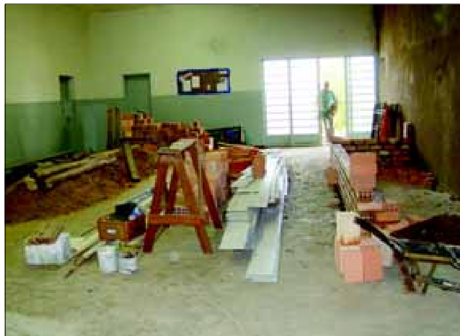
Reforma do antigo Centro Comunitário Bandeirantes

Das diversas obras que estão em andamento na cidade, destacamos quatro nesta edição. Uma delas é a reforma do antigo Centro Comunitário Bandeirantes, onde será instalado o CRAS 2, no valor de R$ 116.998,48.