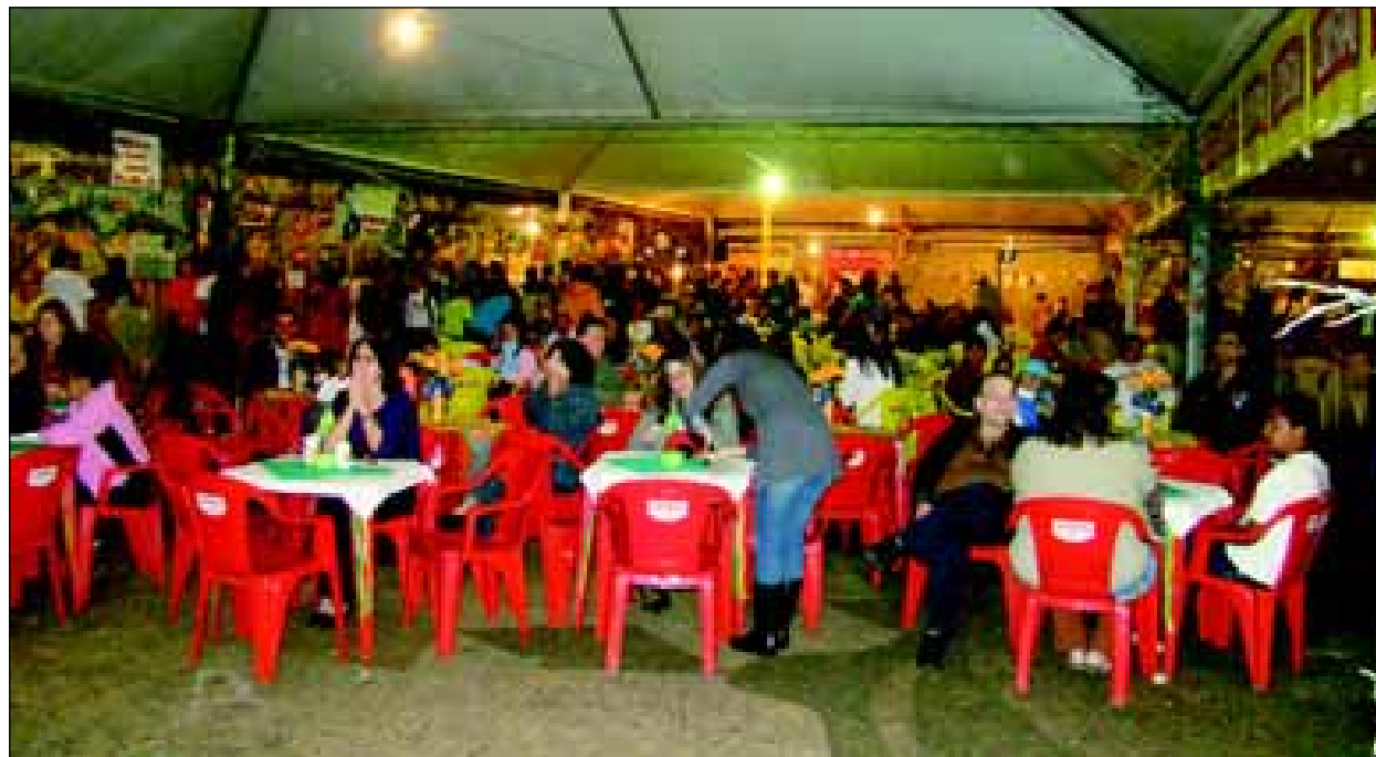
Público presente no primeiro dia do evento

As escolas municipais, creches e entidades assistenciais participaram do arraiá, comercializando