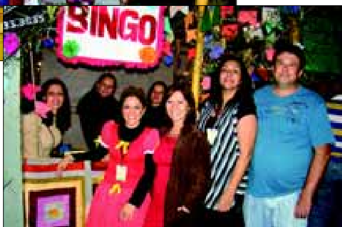
Barraca da Secretaria Municipal de Cultura e Lazer