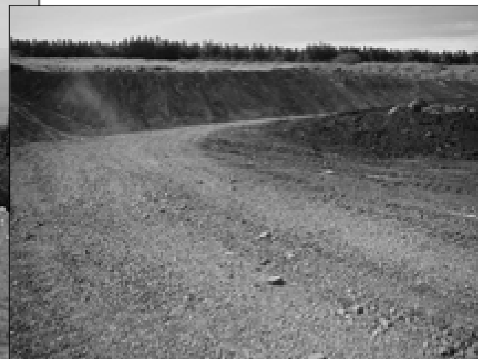
Estrada de acesso está cascalhada