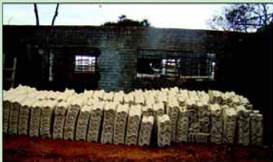
Obra da Creche do Bairro Camargo