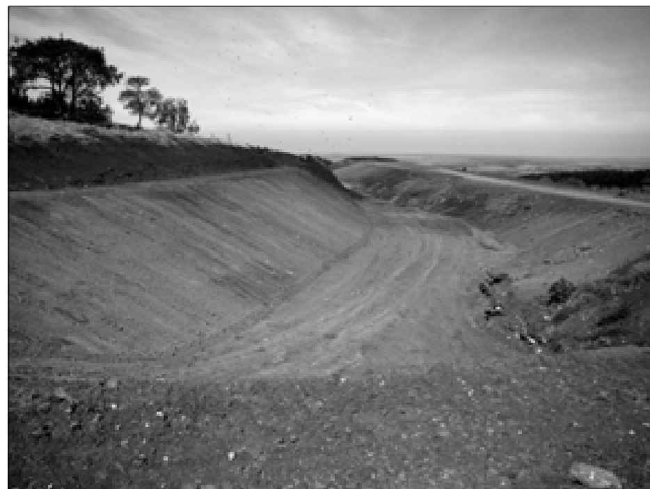
Abertura de nova vala para aterro do lixo