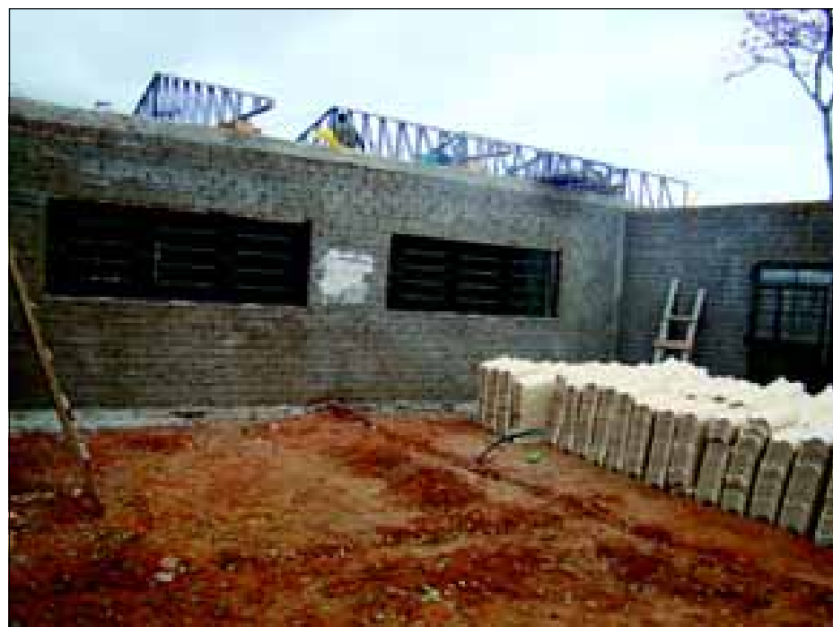
Creche do Bairro Camargo