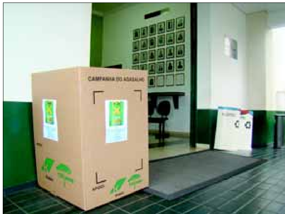
Caixas coletoras no Paço e Câmara Municipal

Hoje, centenas de voluntários, formado por funcionários municipais como Fundo Social, Cozinha Piloto, Garagem Municipal, Ouvidoria, Secretaria da Comunicação e Guarda Municipal, em