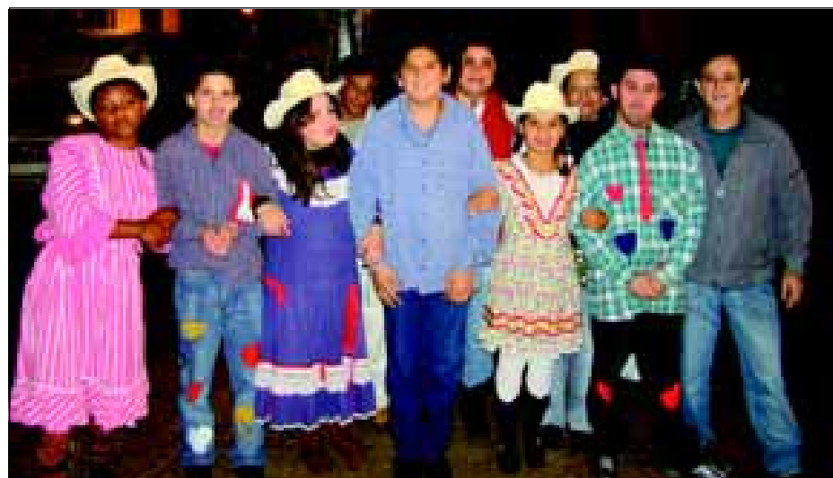
Quadrilha da APAE