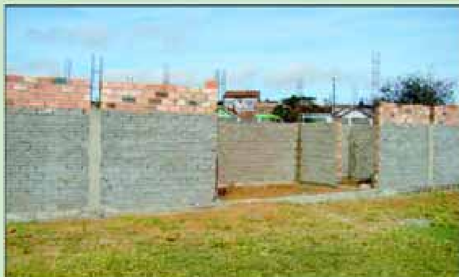
Construção dos vestiários e quiosque da piscina do CSU