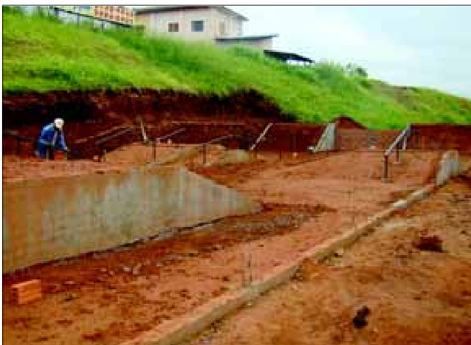
Pista de Skate