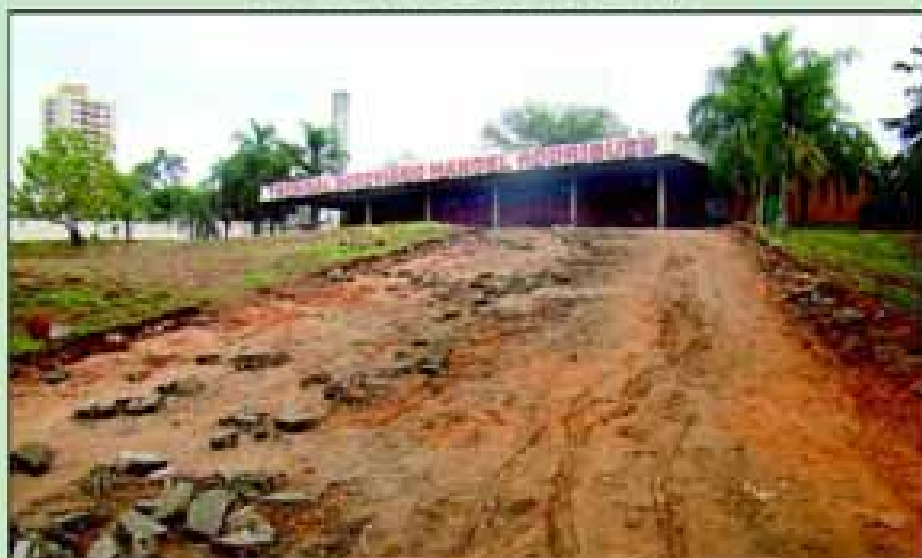
Ampliação do Terminal Rodoviário