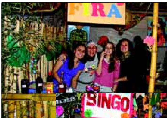
Barraca da Faculdades Integradas Regionais de Avaré