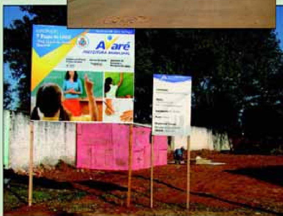
Início das obras da escola Lúcia Guazzelli