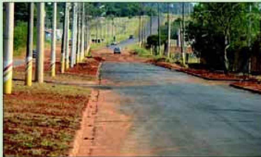
Asfalto da Avenida Donguinha Mercadante