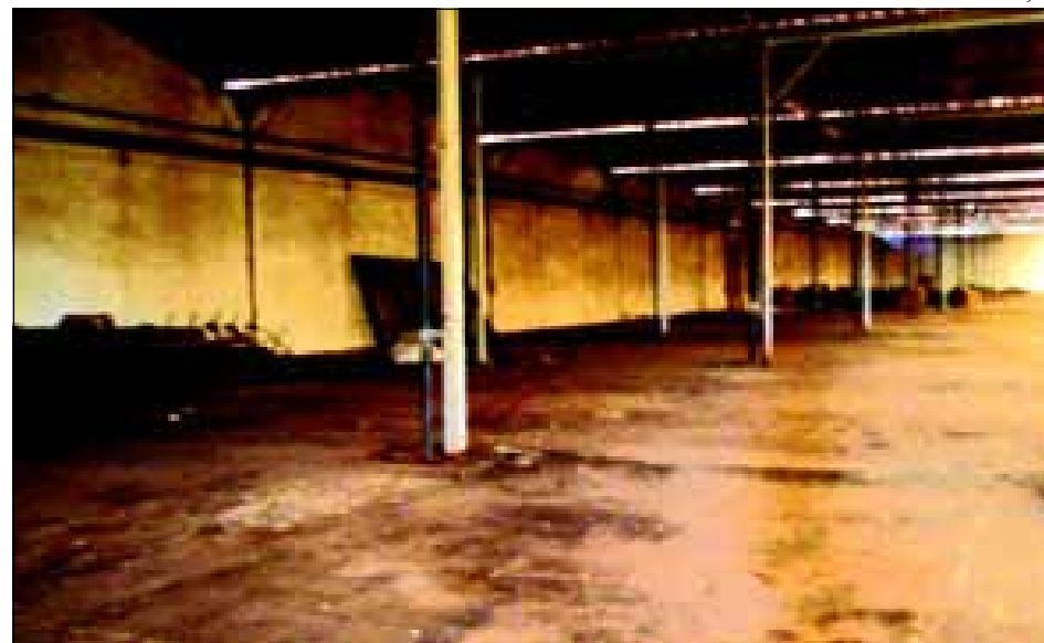
O Posto de recebimento e armazenamento de pneus inservíveis já está em pleno funcionamento no Galpão do antigo IBC

A Vigilância Sanitária de Avaré (VISA) está cooperando com a Secretaria de Meio Ambiente, oficializando as