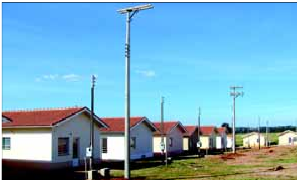
A CPFL juntamente com a Prefeitura estão concluindo as instalações de postes de energia

A Secretaria de Habitação informa ainda que o bairro será asfaltado antes ou logo após o sorteio das unidades.