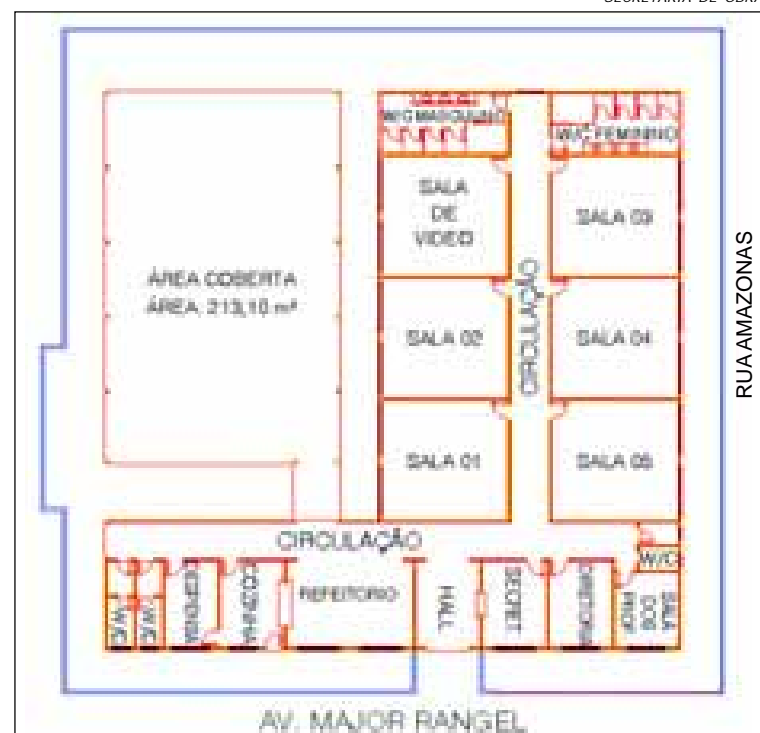
Anteprojeto do novo prédio da escola Professora Licinia Guazzelli