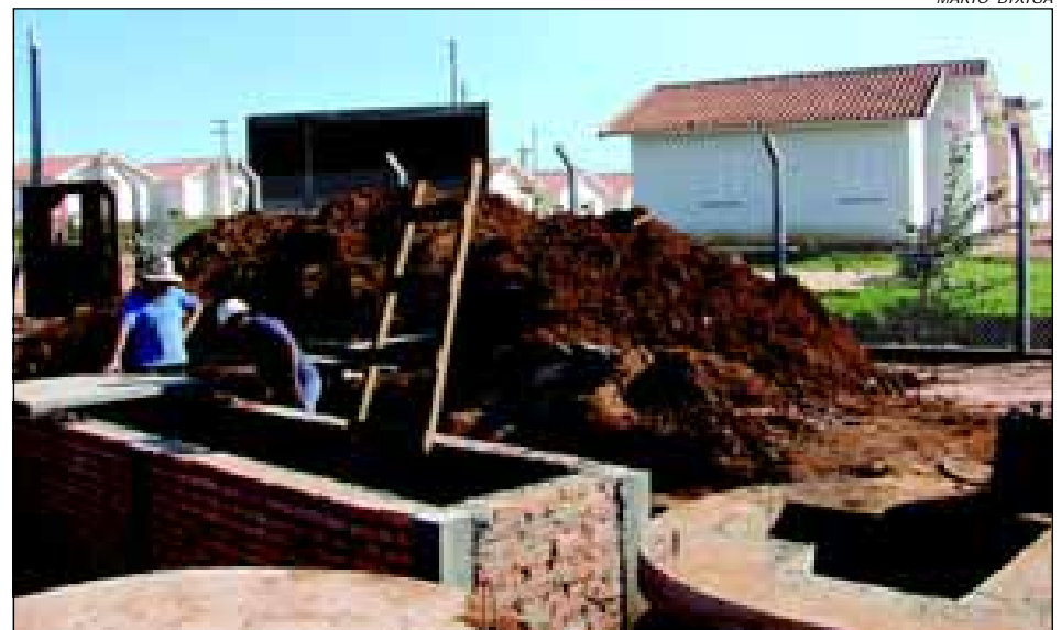
A Estação Elevatória de Esgoto está em fase final de sua obra