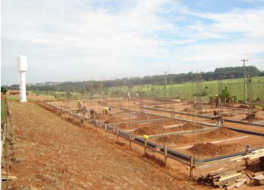
Escola no Jardim Paraíso