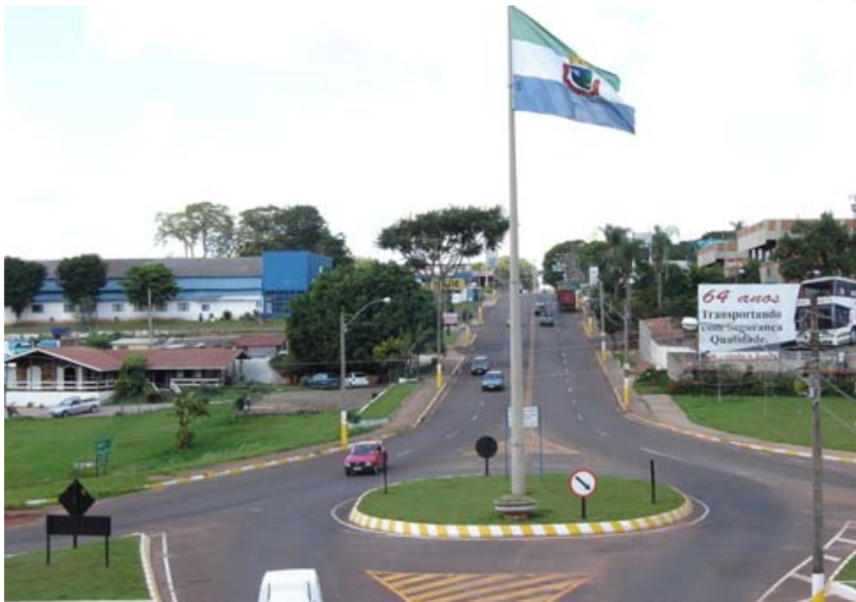
Pagando o IPTU em dia o cidadão ajuda a fazer uma Avaré cada vez melhor

Aproveitando a entrega dos carnês de IPTU a Prefeitura da Estância Turística de Avaré também está realizando a notificação