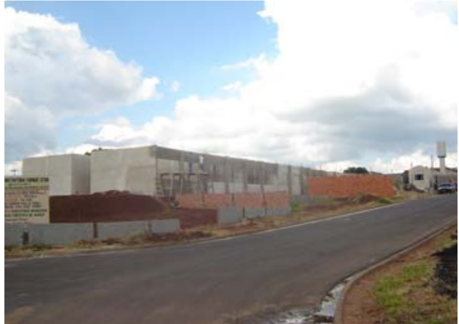
Escola no Bairro Vera Cruz

Já estão bastante adiantados os trabalhos para a construção de duas novas escolas em Avaré. A Prefeitura está construindo uma nova escola no Bairro Vera Cruz e outra no Bairro Paraíso.