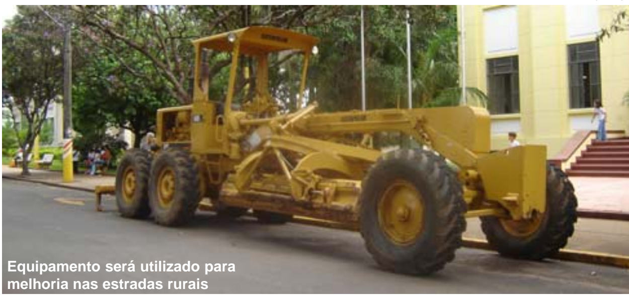
Equipamento será utilizado para melhoria nas estradas rurais

Nesta época do ano é difícil para Prefeitura manter em ordem as estradas rurais, devido às chuvas constantes neste período. Por este motivo a Prefeitura está adquirindo mais um equipamento para auxiliar no trabalho.