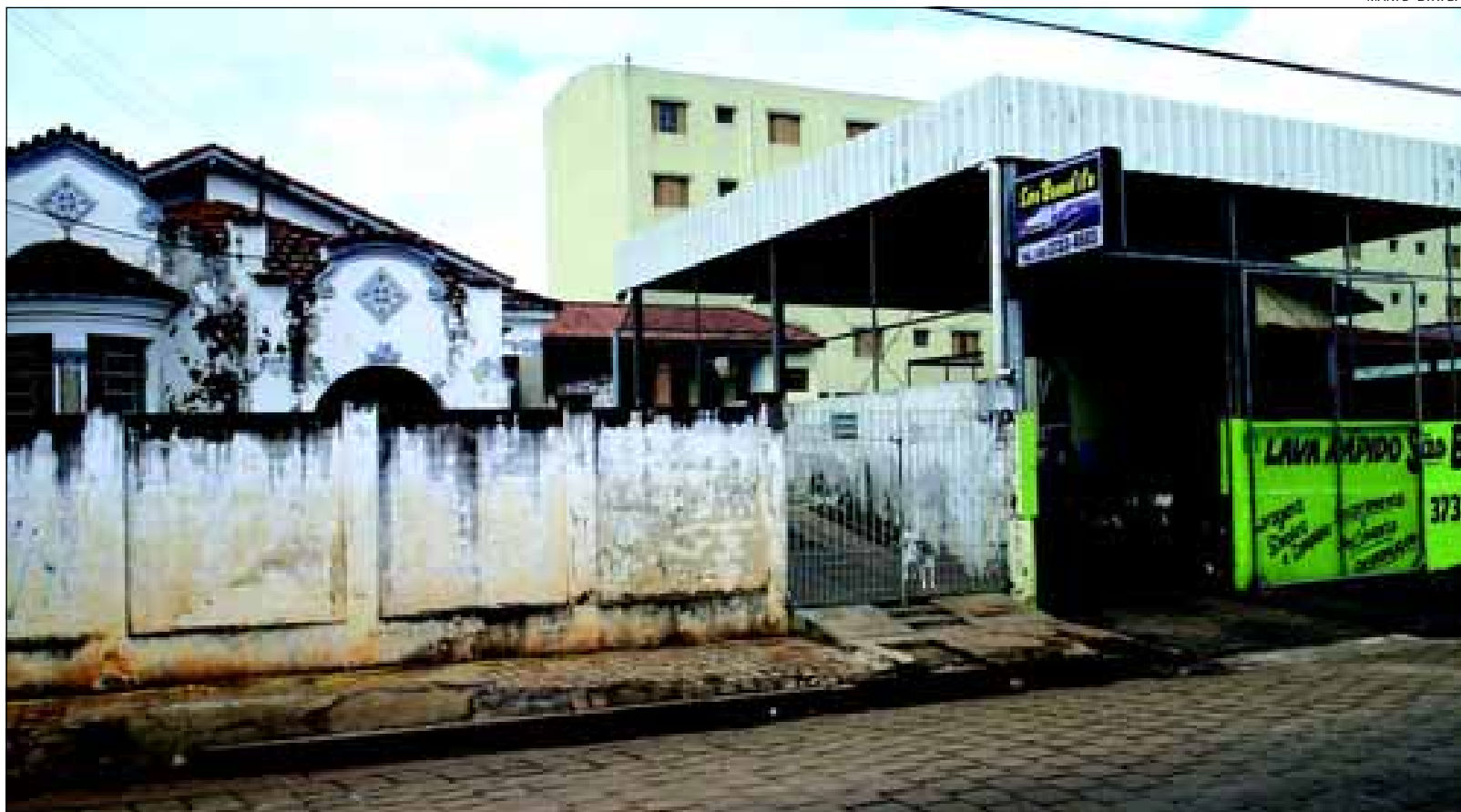
Imóvel da Rua Distrito Federal, 1584/94 desapropriada a ser demolido para construção de canal

Na próxima semana já estarão sendo iniciadas as demolições dessas construções para sequência da implantação de um canal de céu aberto para escoamento das referidas águas pluviais, ressaltando que outros imóveis já foram desapropriados ou cedidos nessas imediações para implantação dessa obra tão necessário.