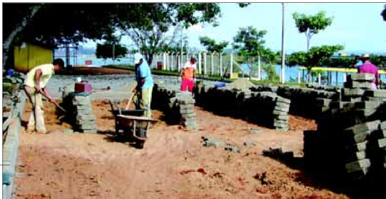
Obras de pavimentação em lajotas do acesso ao Pesqueiro do Camping

tem por objetivo melhorar as condições de fluxo de trânsito ao pesqueiro, e também em breve ao Farol Panorâmico e Restaurante que estão em fase de edificação, com objetivos da valorização a pratica do turismo da pesca e lazer, lembrando que as vias da área interna do Camping receberam pavimentação no ano passado.