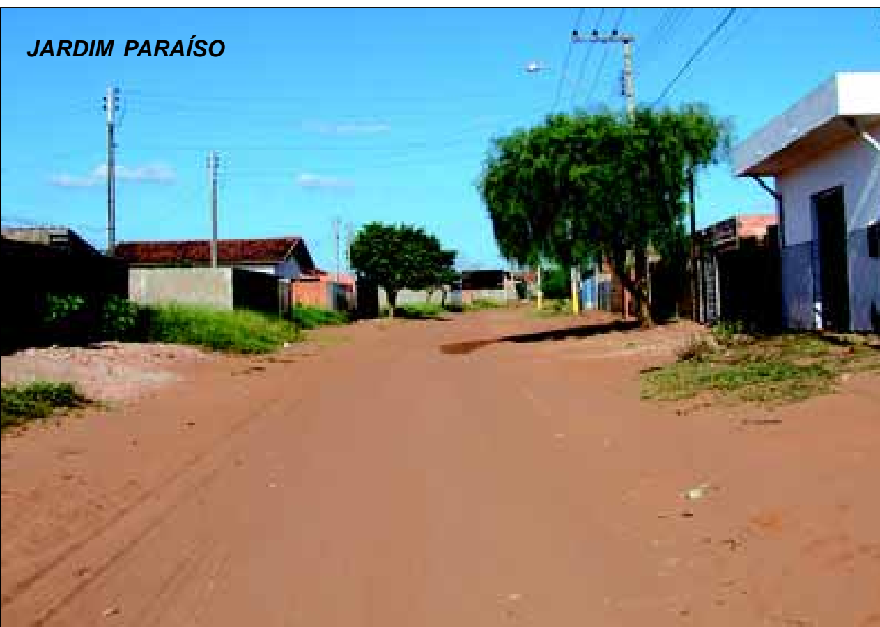
Da verba de R$ 5 milhões, R$ 1 milhão será destinado para pavimentação de ruas deste bairro