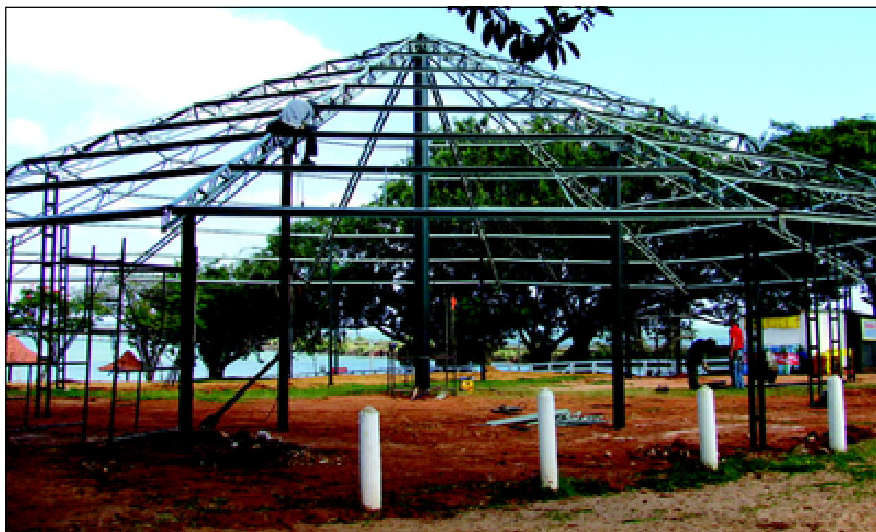
As obras do restaurante estão ganhando estrutura metálica da cobertura

trução o Farol Panorâmico que será mais um ponto turístico a ser visitado na Estância Turística de Avaré, o qual está localizado nas proximidades do pesqueiro do camping. O projeto de construção prevê uma altura de 24 metros, o que possibilitará aos visitantes que tenham uma visão privilegiada de boa parte da Represa de Jurumirim. Contará ainda com uma completa iluminação o que o deixará mais bonito e imponente, mesmo no período noturno.