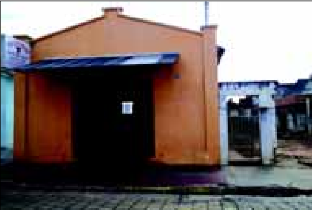
Imóvel localizado na Rua Rio Grande do Norte, 1585 onde será feita a demolição para construção de canal

SECRETARIA DOS TRANSPORTES E SISTEMA VIÁRIO