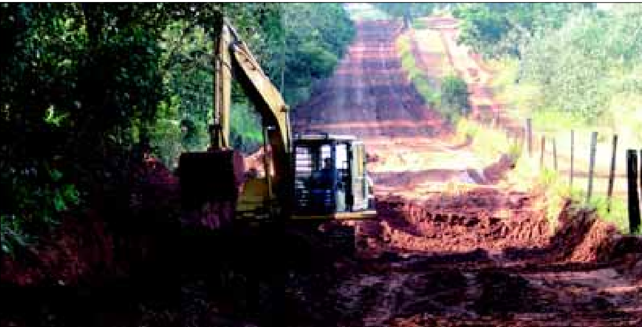
Serviços de terraplenagem em execução para posterior pavimentação asfáltica

Já foram iniciados os trabalhos de terraplenagem para posterior pavimentação asfáltica da AVR 362, que parte da Rodovia SP 255 e dá acesso ao Hotel Península, Berro D'Água e outras propriedades.