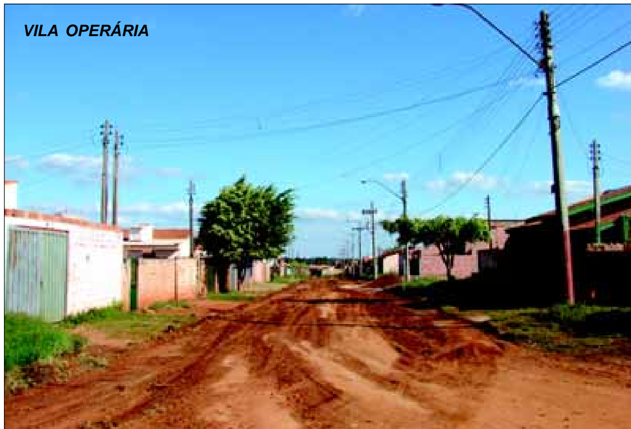
Investimentos de R$ 1 milhão serão destinados para pavimentação