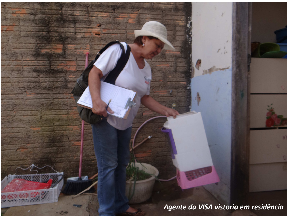
Agente da VISA vistoria em residência

Secretaria de Saúde fará mutirão no Jardim Tropical e no Residencial Mário Bannwart nos dias 13 e 14 de fevereiro. Ação terá vistoria para eliminação de criadouros e tratamento químico, quando necessário. Conheça medidas simples que você pode adotar para evitar a proliferação do mosquito no ambiente doméstico.