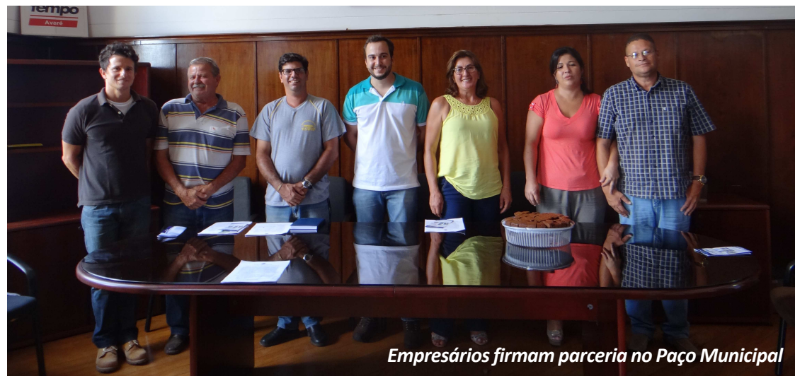
Empresários firmam parceria no Paço Municipal

A fabricação de casas modulares, muros modulares, postes para alambrados, pisos intertravados, guias e outros artefatos de concreto é a atividade da Kelley Cris-